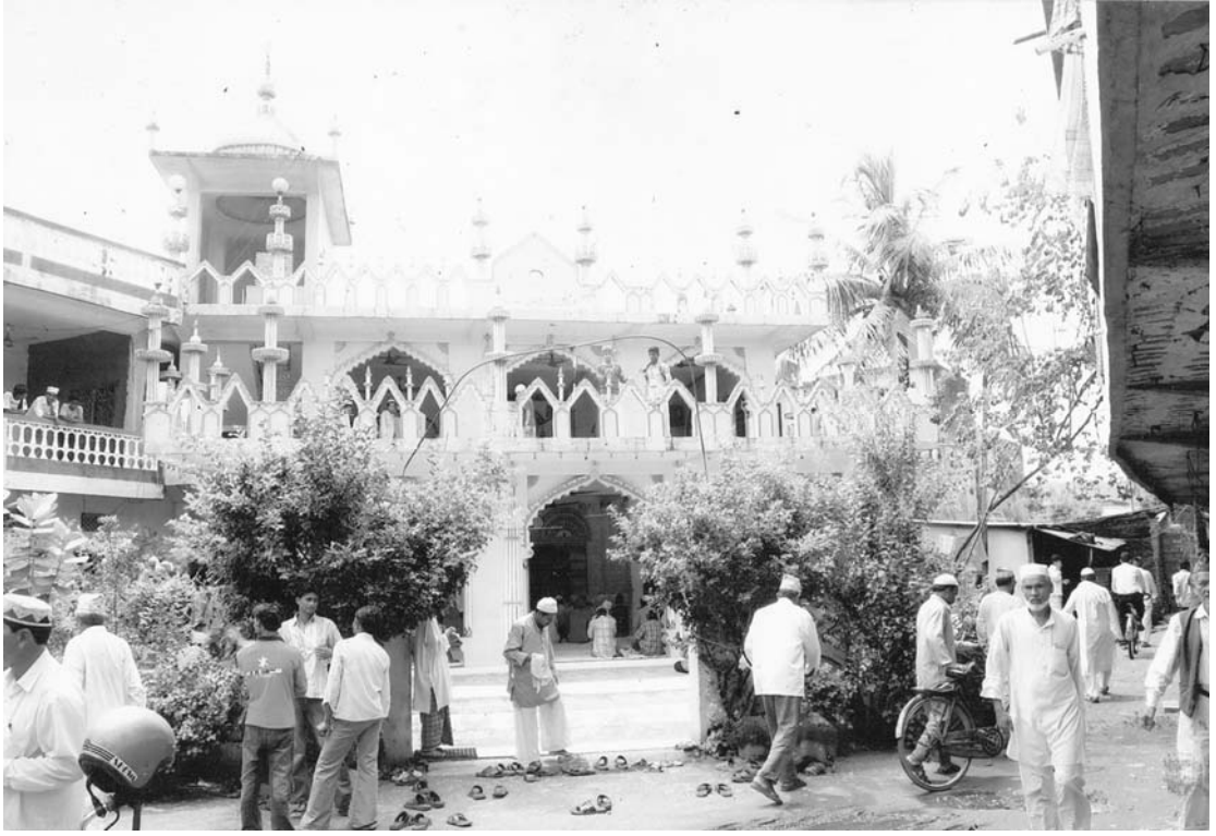
मस्जिद प्राङ्गणमा मुसलमानहरू