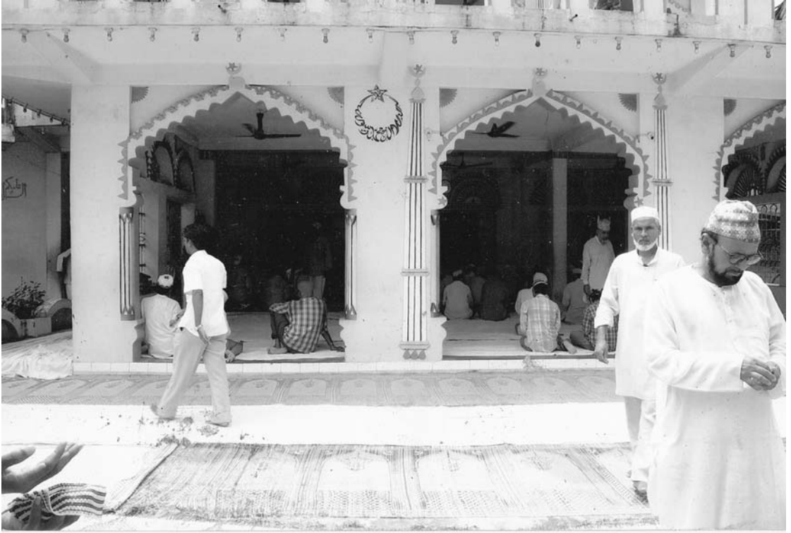
धार्मिक गाथा प्रस्तुत गर्न सहभागी मुसलमानहरू