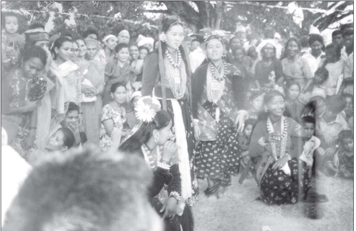
चुङ्का नाचदै गरेका युवतीहरूको दृश्य