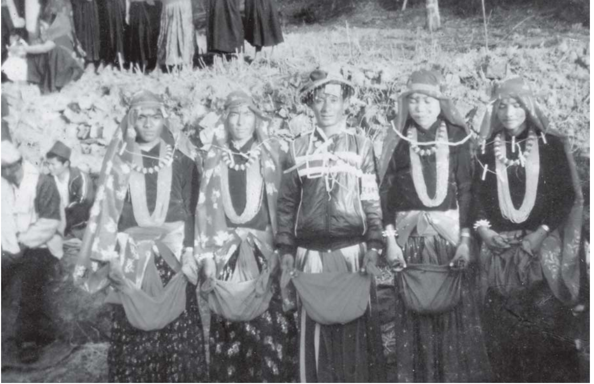
मारुनी (मादल) नाचको अन्तमा नचरीहरूको फोटो