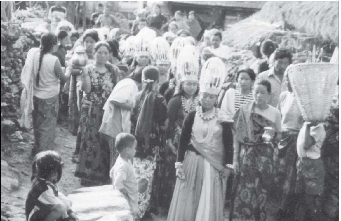
घाटु भुलाउँदाको वा अन्त गर्दाको दृश्य