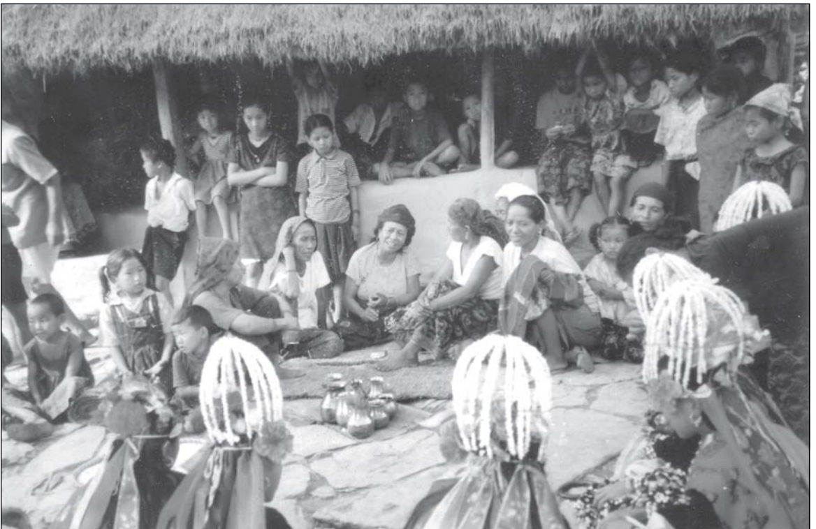
घाटु जगाउँदाको दृश्य