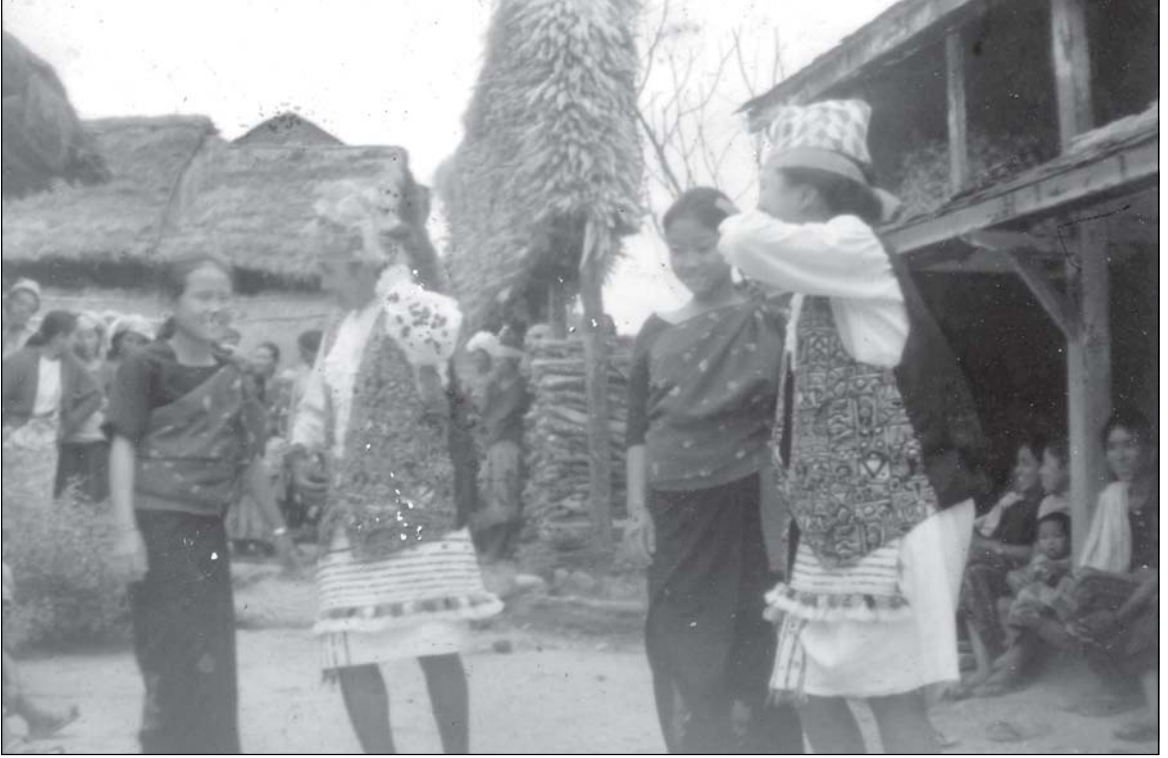
केटीहरू चुङ्का नाचमा केटाको भेष गरी नाचै