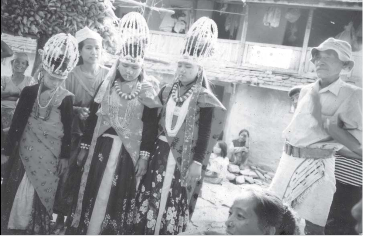
करुण मुद्रामा घाटुलीहरू