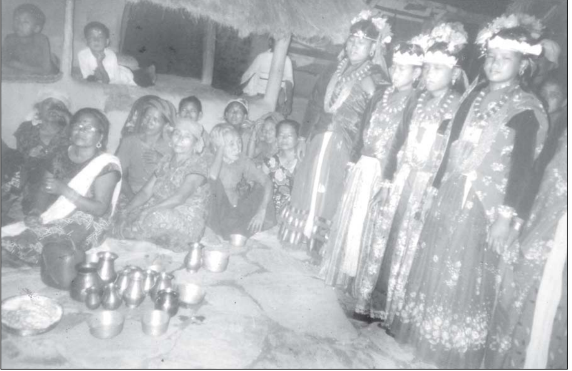
घाटु नृत्यको दृश्य