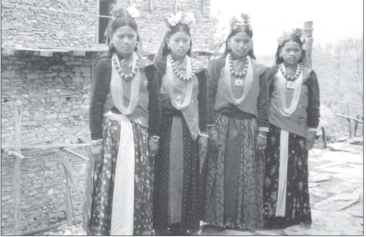
चुङ्का नाच्च तयारी युवतीहरू