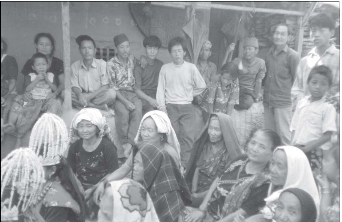
घाटु जगाउँदै गुरुआमा