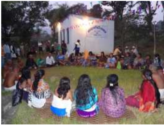
तिहारे औसीको रात वर्ष दिनको बरखी फुकाउन दरै समाज भवनमा जम्मा भएका दरै समुदायहरु