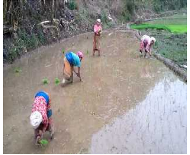
धान रोप्दै महिलाहरु