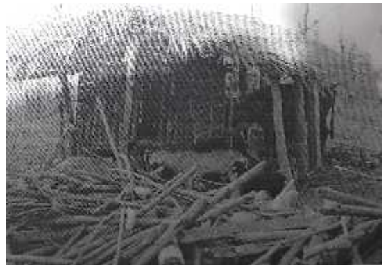
बाखा राख्ने खोर