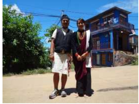
दरै युवायुवती आफ्नो पोशाक र गरगहनामा