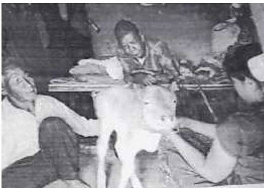
दरै गुराउले गाईको बाच्छीलाई भारफुक गर्दै