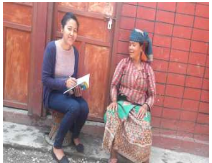
दरै महिलासँग अन्तरवार्ता लिदै