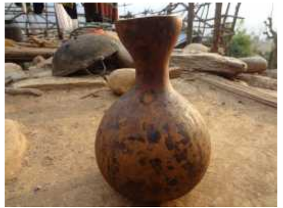
दरै जातिले लौका (एक प्रकारको फल) बाट बनाएको जाड खाने भाँडा