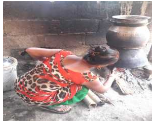
रक्सी बनाउदै महिला