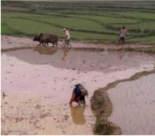
धान रोपणका लागि जोत्दै