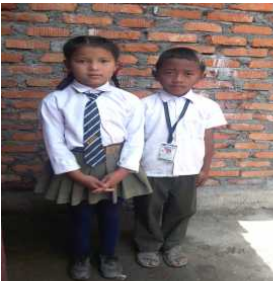
विद्यालय जाने तयारीमा बालबालिकाहरु