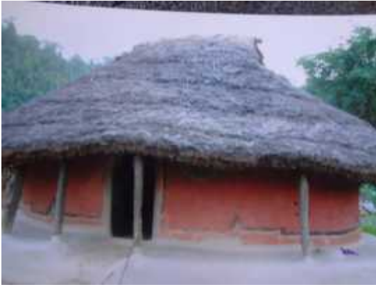
दरै जातिको परम्परागत घुमाउने घर