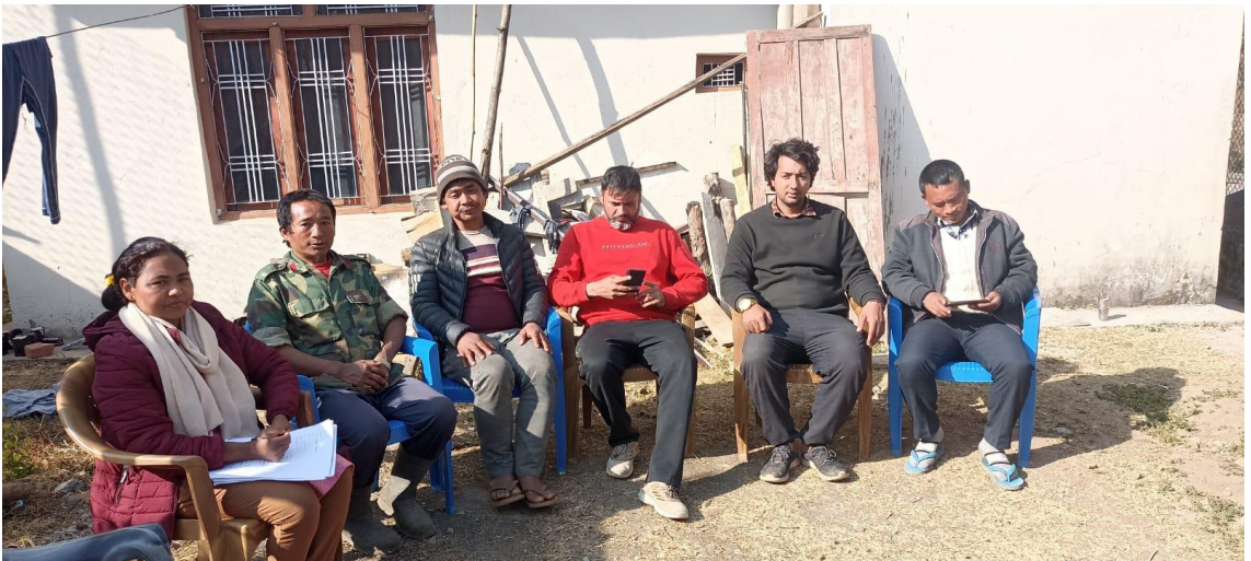
सिरिबाङ स्थित सुनछहारी गाँउपालिकाका स्थानीय बासिन्दाहरू (अध्ययन क्षेत्रको तस्बिर, १९ माघ, २०७९)