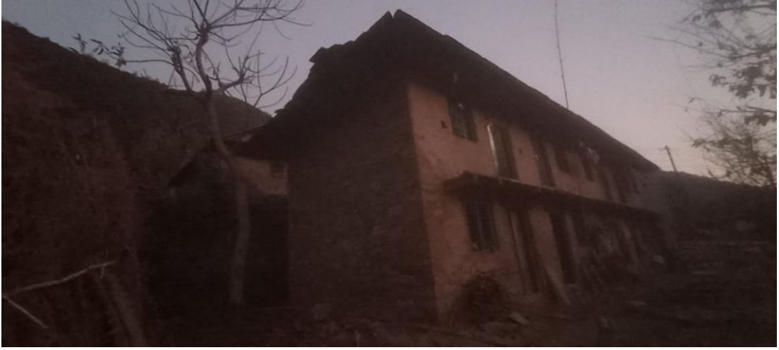
सिरिबाङ स्थित जलजला कम्प्युनको कम्प्युन घर (अध्ययन क्षेत्रको तस्बिर, २० माघ, २०७९)