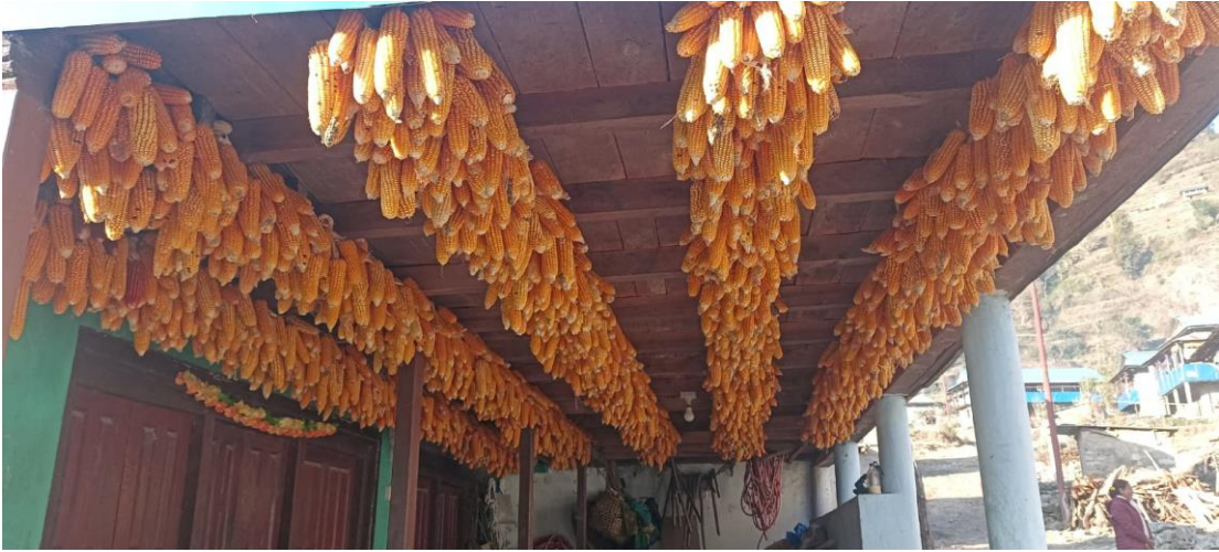
सिरिबाङ स्थित जलजला कम्प्युनको कम्प्युन घरमा मकै भंडारण गरि राखिएको (अध्ययन क्षेत्रको तस्बिर, २० माघ, २०७९)