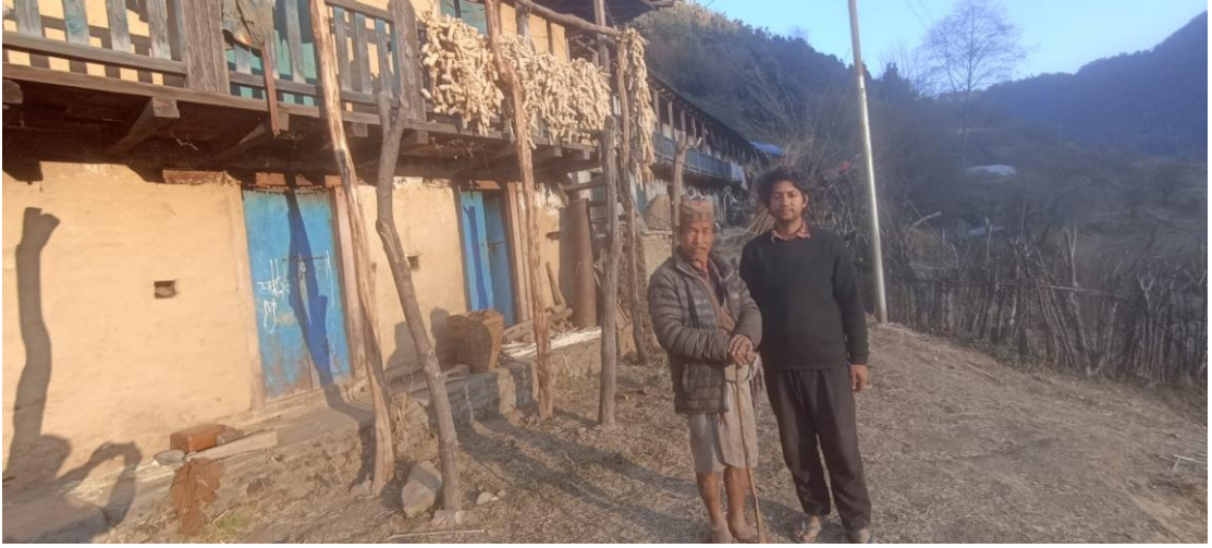
सिरिबाङ स्थित जलजला कम्युनका एक कम्यून सदस्य (अध्ययन क्षेत्रको तस्बिर, १८ माघ, २०७९)