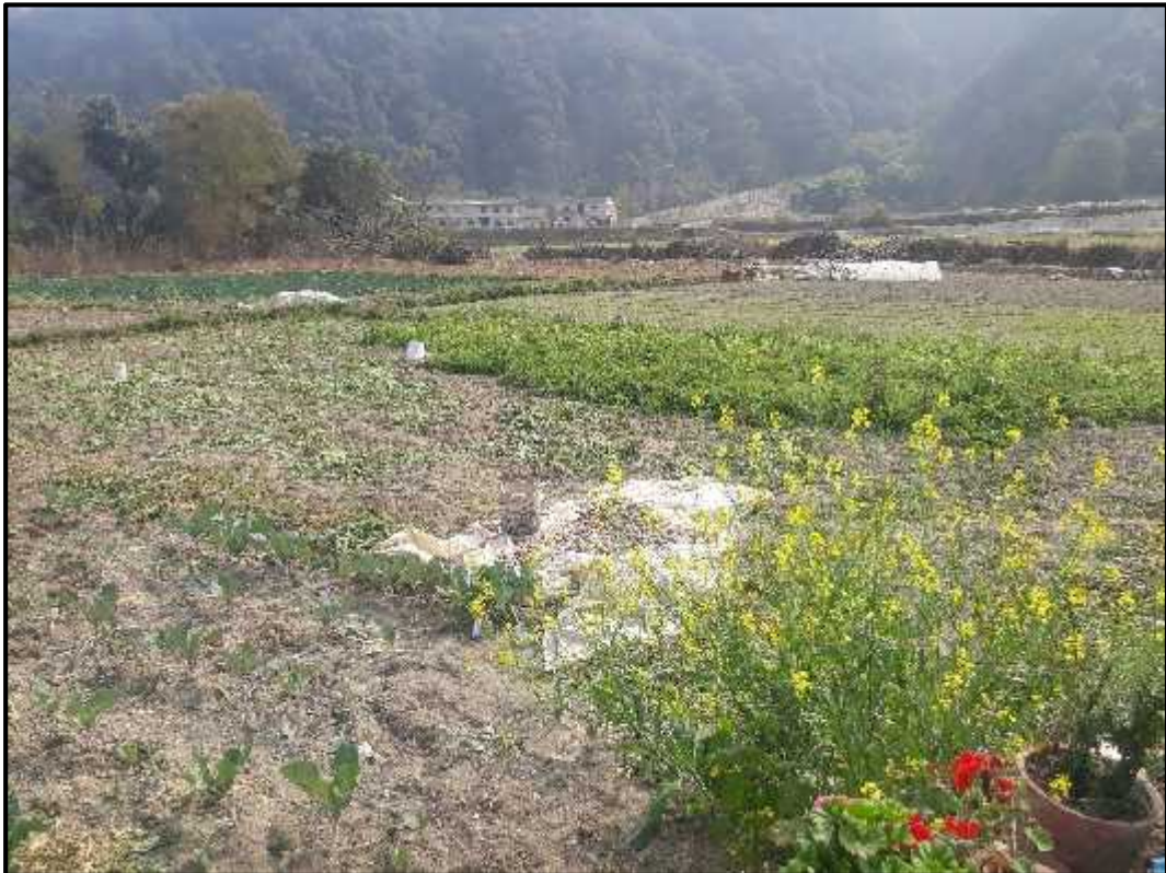
(शोधकर्ताले तरकारीवारीको अवलोकन)