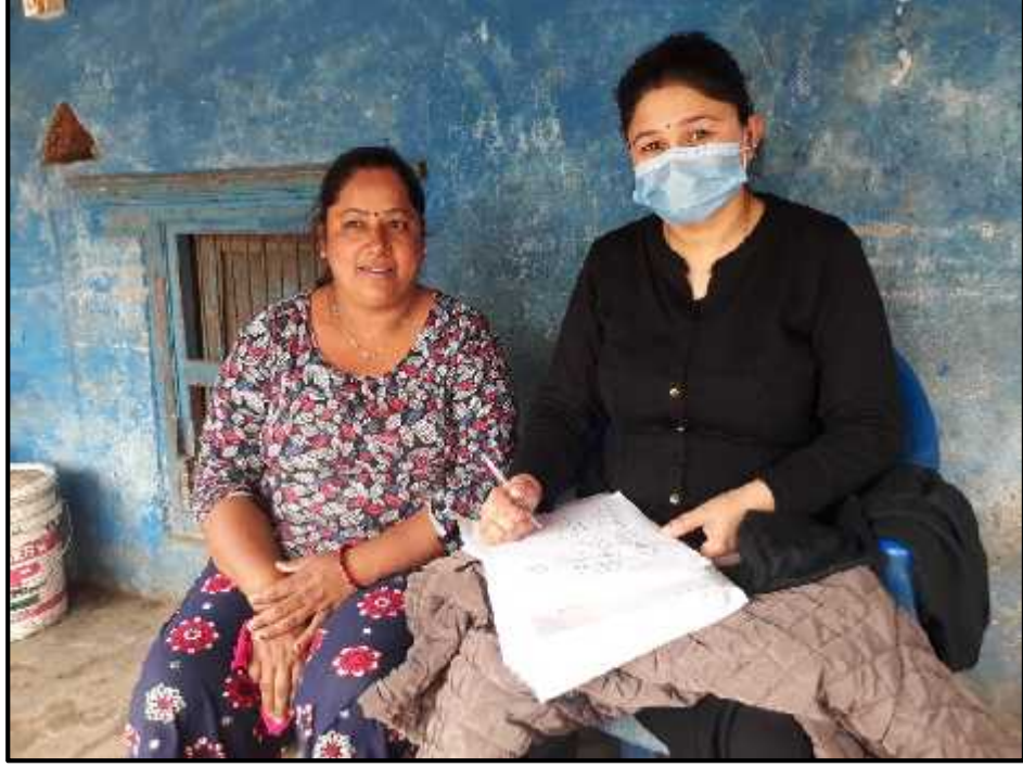
(वडा नं. ३३ को महिला कृषकसँग अन्तरवार्ता लिदै शोधकर्ता)