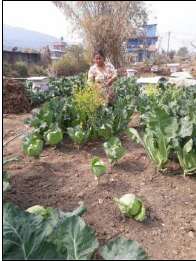
(महिला कृषक तरकारी वारीमा)