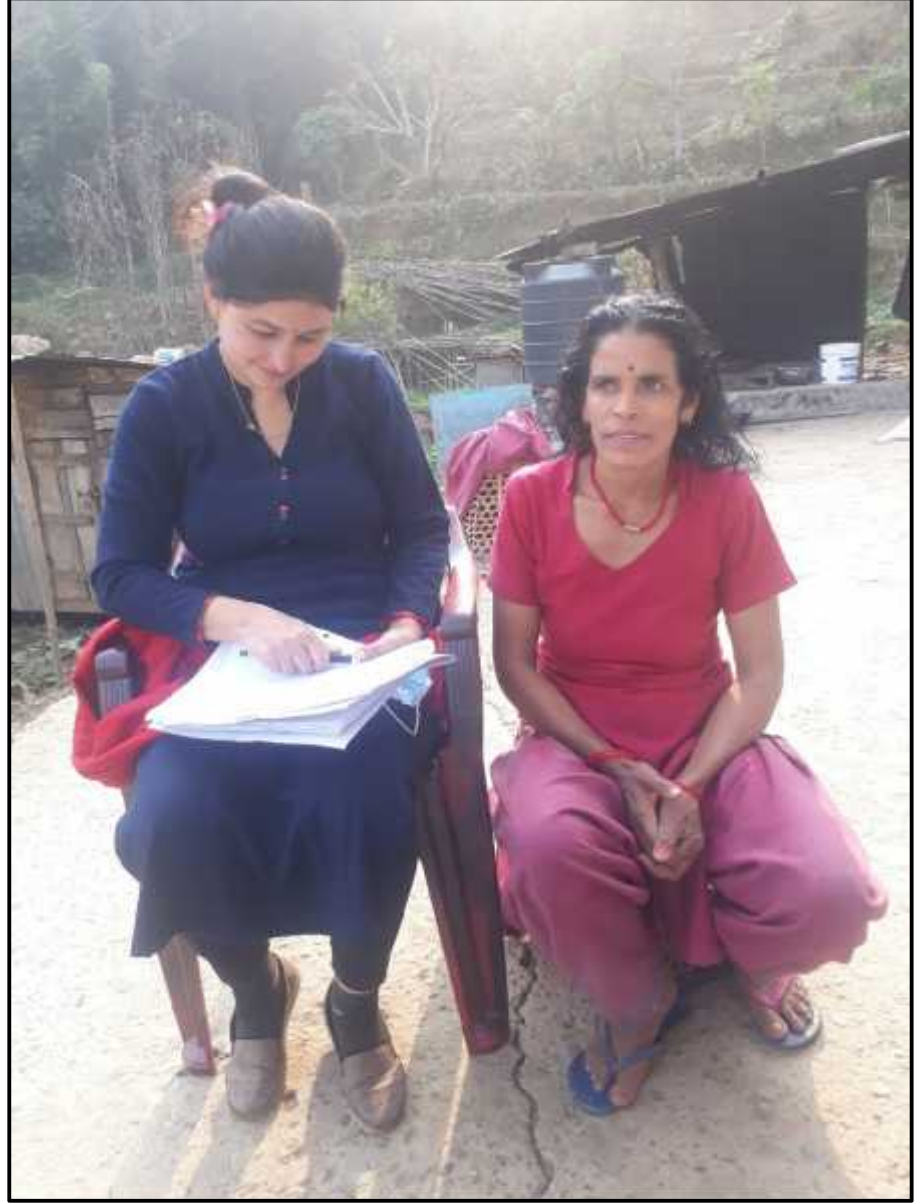
(वडा नं. ३३ को महिला कृषकसँग अन्तरवार्ता लिदै शोधकर्ता)