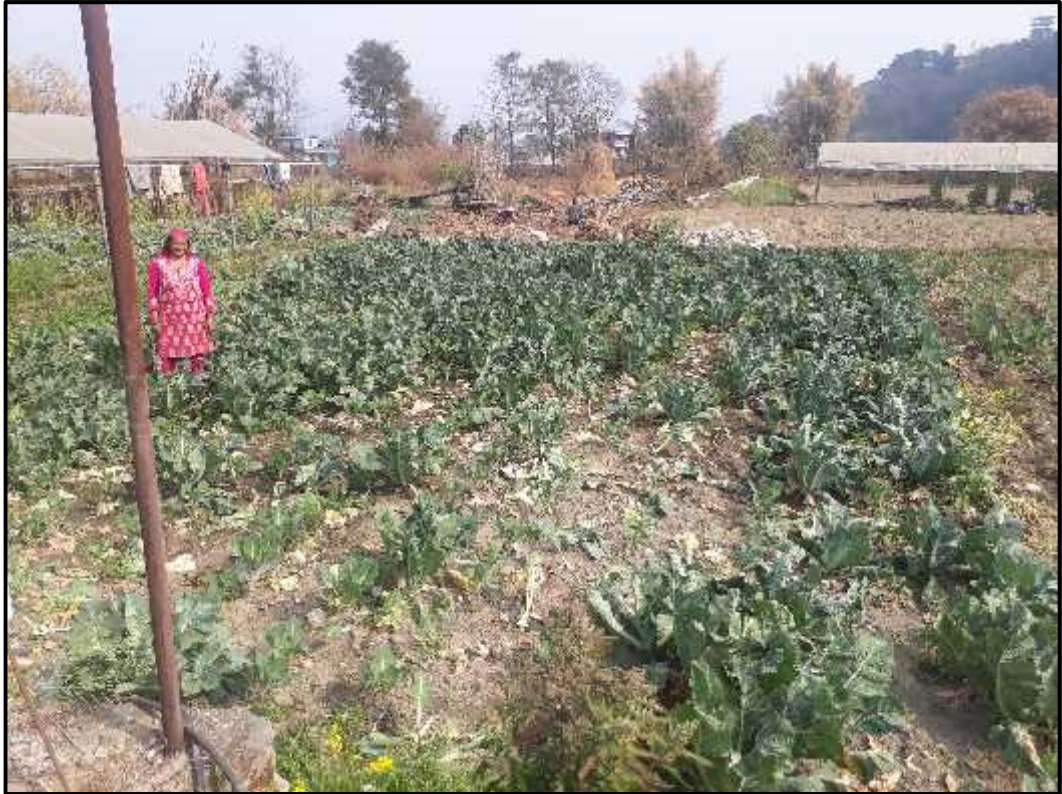
(महिला कृषक तरकारी वारीमा)