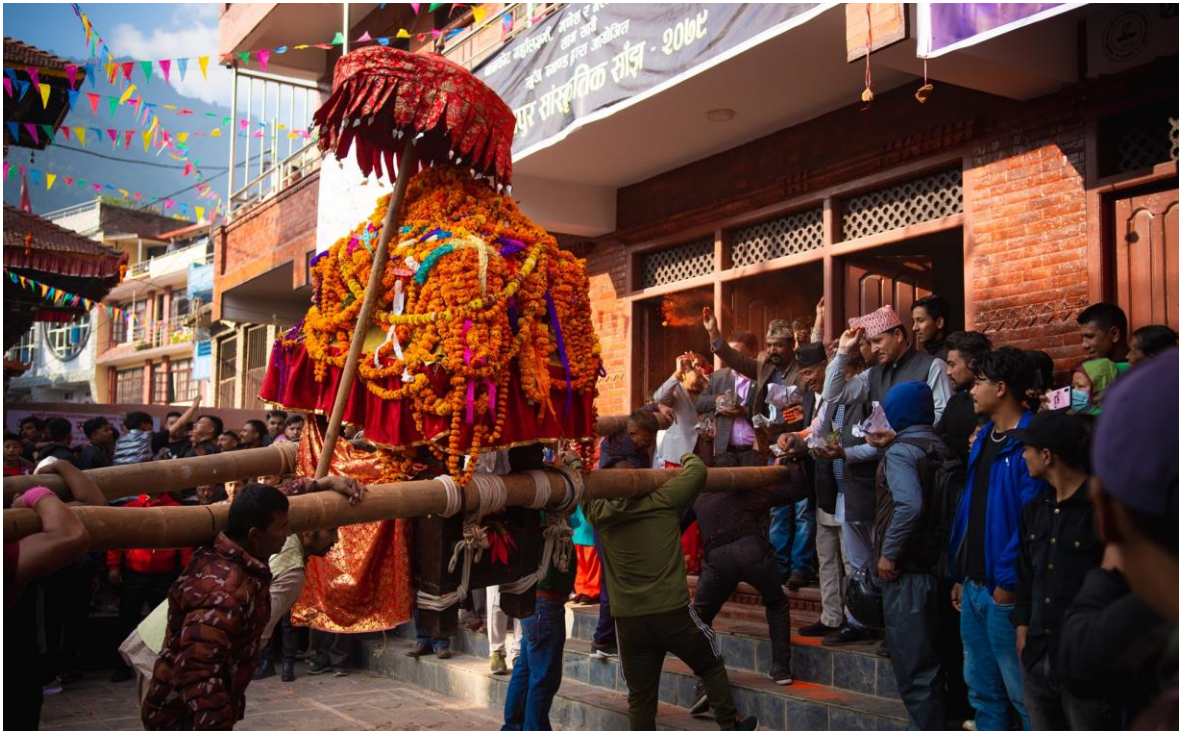
तस्वीर ९ : महालक्ष्मी गणेश भैरव जात्रामा खट उठाउँदै