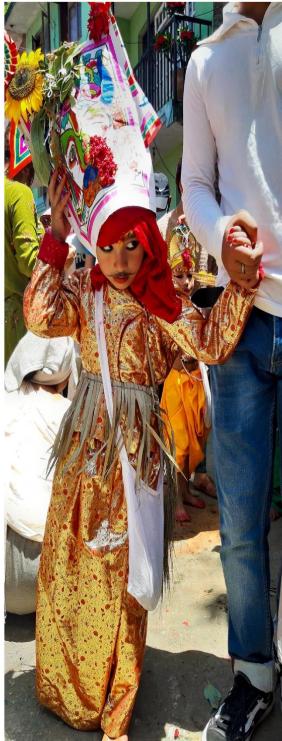
तस्वीर नं १० : शोणितपुरको गाईजात्रा