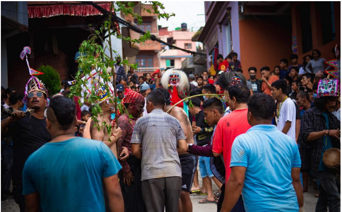
तस्वीर १२ : थानकोटस्थित सिलाफल पोखरीमा राँगोको टाउको लुकाउने जात्रा