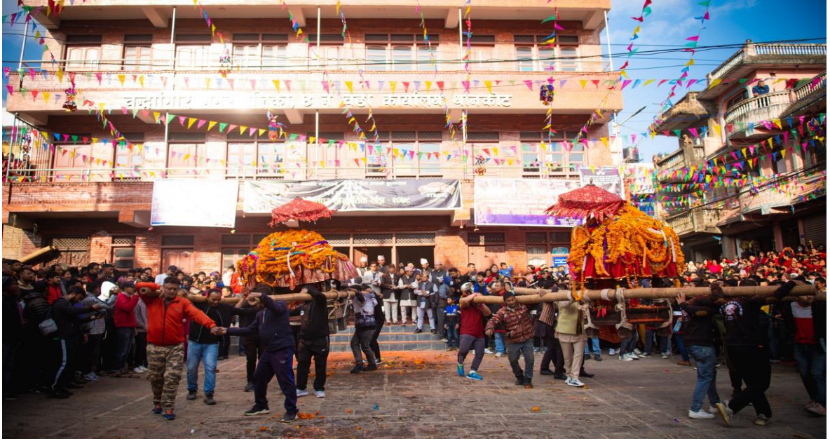
तस्वीर ८ : महालक्ष्मी गणेश भैरव जात्रामा खट उठाउँदै