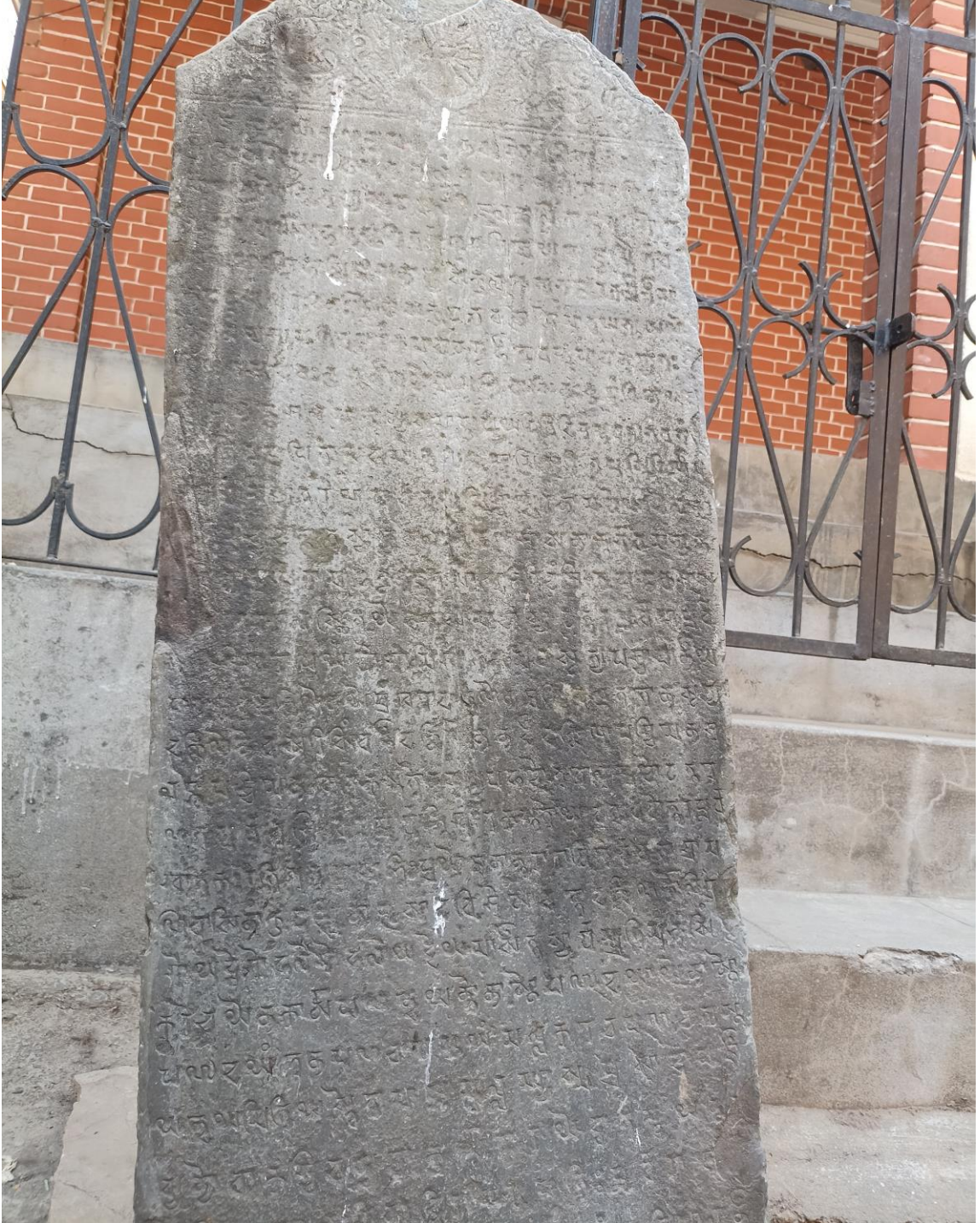
तस्वीर १ : आदिनारायण मन्दिरको पछिल्लिर रहेको भीमार्जुनदेव जिष्णुगुप्तको अभिलेख