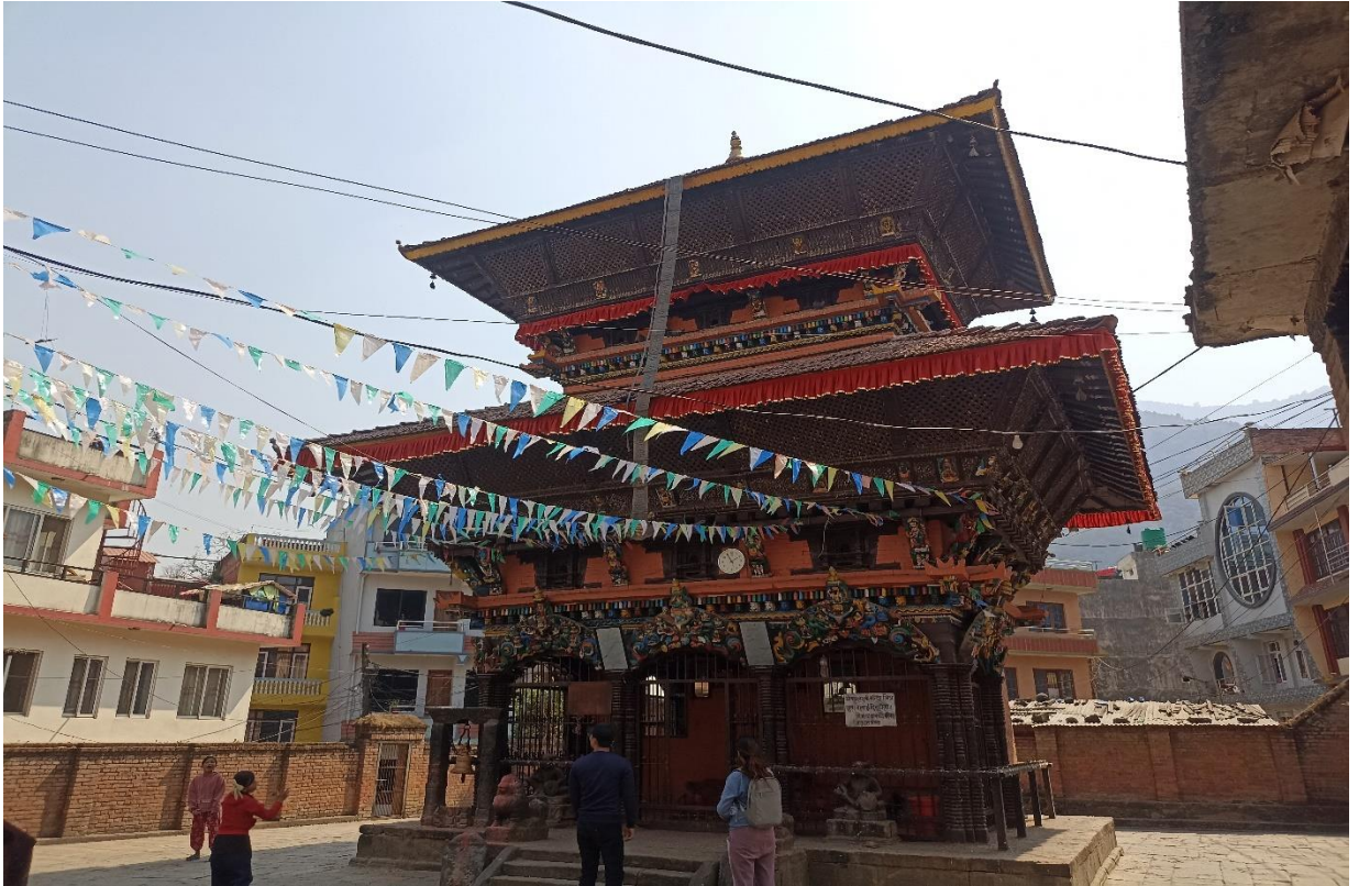
तस्वीर ३ : महालक्ष्मी मन्दिर, शोणितपुर