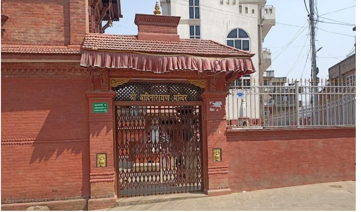
तस्वीर २ : आदिनारायण मन्दिर, शोणितपुर