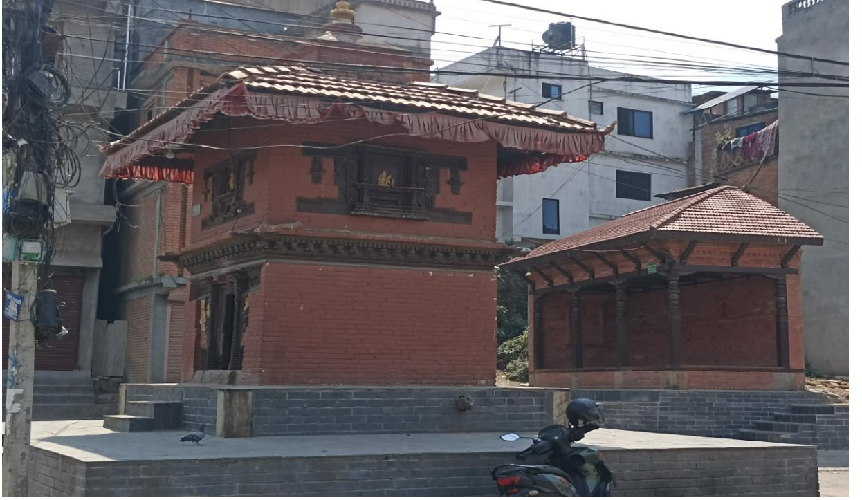
तस्वीर ४ : आदिनारायण मन्दिर परिसरमा रहेको पाटी र मन्दिर