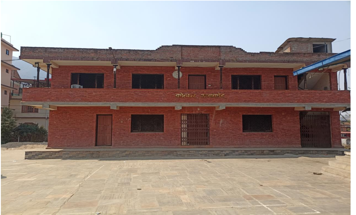
तस्वीर ५ : आदिनारायण मन्दिर परिसरमा रहेको कोतघर