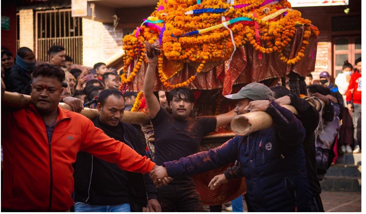
तस्वीर ६ : महालक्ष्मी गणेश भैरव जात्रामा खट उठाईदै