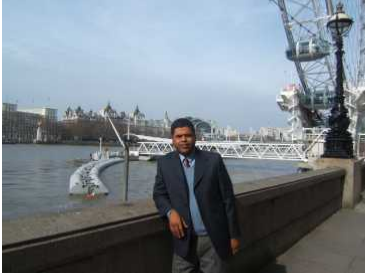
जेनेभा लेक, स्वीजरल्याण्ड अगाडि