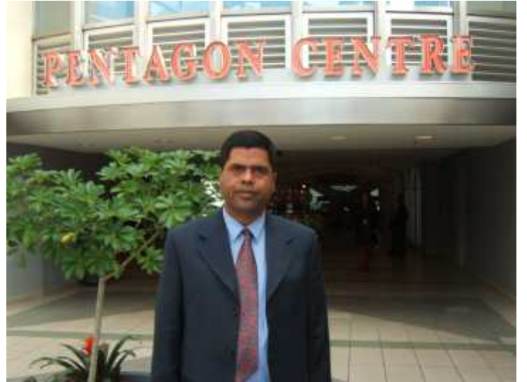
पेन्टागन सेन्टरमा लेखक