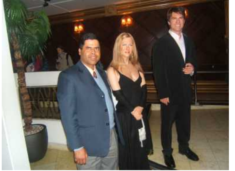
म्याडम टुसादका साथ लेखक