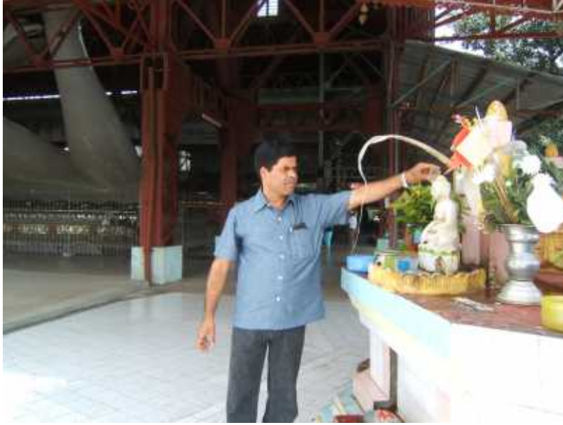
म्यान्मा रङ्गनमा लेखक