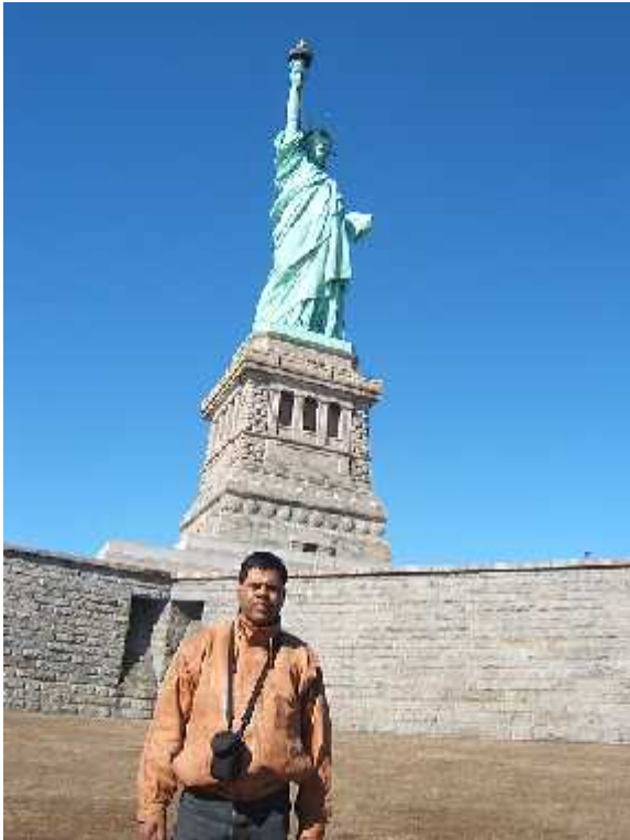
स्टाच्यु अफ लिबर्टी, न्यूयोर्क