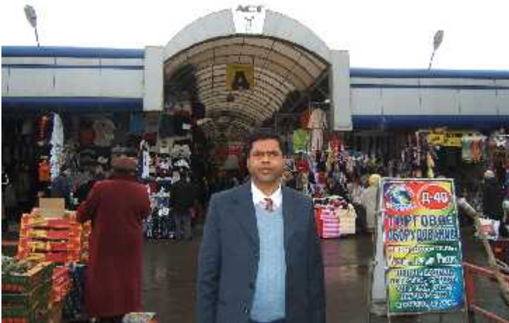
अमेरिकी बजारमा लेखक