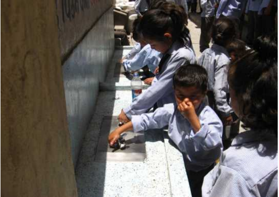
विद्यार्थीहरु धारामा पानी पिउदै

हात धोएको देखियो । जसवाट बालबालिकाहरुले शौचालय गएर आएपछि हात सावुन पानीले धुनु पर्छ भन्ने बानीको विकास गराएको देखिन्छ । जसले गर्दा उनीहरु स्वास्थ्य तथा सरसफाई गर्ने बानीको विकास हुने गर्दछ । बालबालिकाहरु पानी धेरै चलाउन मन पराउने हुनाले खानेपानीको धारा धेरै चलाउन सक्ने सम्भावना भएकाले खानेपानीको धारा थिचुन्जेल मात्र आउने खालको धाराको व्यवस्था गरिएको पाईयो । जसले गर्दा बालबालिकाहरुले धारा खोलेर पानी खोलेर पानी खेर फाल्ने सम्भावना हुदैन । जुन तल चित्रमा देखाईएको छ । अध्ययन क्षेत्र सरकारी विद्यालय भएकोले त्यहाँ खानेपानी लगायत विद्यालयका विभिन्न भौतिक सामग्री विभिन्न संघसंस्थाहरुवाट सहयोग स्वरुप प्राप्त भएको पाईयो । साथसाथै अति आवश्यक सामग्रीहरु विद्यालय आफैले पनि खरिद गरेको पाईयो । आदर्श मापदण्ड अनुसार प्रति बालबालिकाको लागि दुई वर्ग मिटर क्षेत्रफल भएको कोठा चाहिने भएता पनि त्यस अनुरुपको कक्षाकोठा नभएपनि चलन घुम्न, नाच्न, उफ्रन सजिलै अटाउने र साना बालबालिकाहरु भएकाले कक्षाकोठा साघुरो नभएको महसुस गरियो र त्यहाँ पढ्न आएका बालबालिकाहरुका लागि उपयुक्त नै देखिएको छ ।