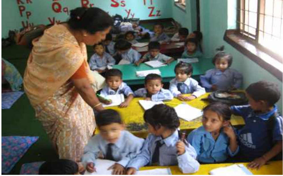
कक्षाकोठामा बालबालिकाहरूलाई मिलाएर राखी पढाईरहेको

यसरी बालबालिकाहरूलाई चकटीमा मिलाएर राखी सकेपछि सबै बालबालिकाहरूलाई उठाई राष्ट्रिय गान सयौं थुङ्गा फुलका हामी एउटै माला नेपाली गाउन लगाईएको थियो । यसबाट के कुरा स्पष्ट हुन्छ भने बालबालिकालाई राष्ट्रिय भावना प्रति सजक गराउने तथा विहानको दैनिक क्रियाकलापहरू नियमित गराउने बानीको विकास गराउन खोजेको देखिन्छ । यस बेलामा बालबालिकाहरू रमाएर राष्ट्रिय गान गाईरहेका थिए र कोही बालबालिकाहरू भर्खर-भर्खर मात्र भर्ना भएकाले कक्षाकोठामा बस्न नमानिरहेको देखियो । कोही बालबालिकालाई निदाईरहेका थिए तिनहरूलाई कक्षाका पछाडी चकटीमा सुताईरहेको थियो जुन तल चित्रमा छ ।