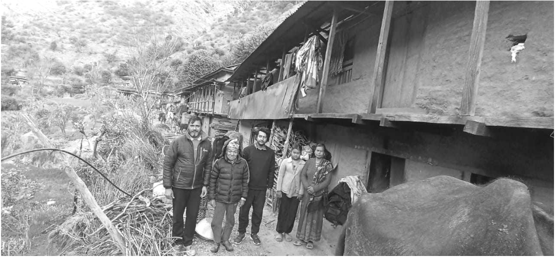
छिप खोला रुकुम पूर्वलडाकु र परिवारसँग लिएको फोटो