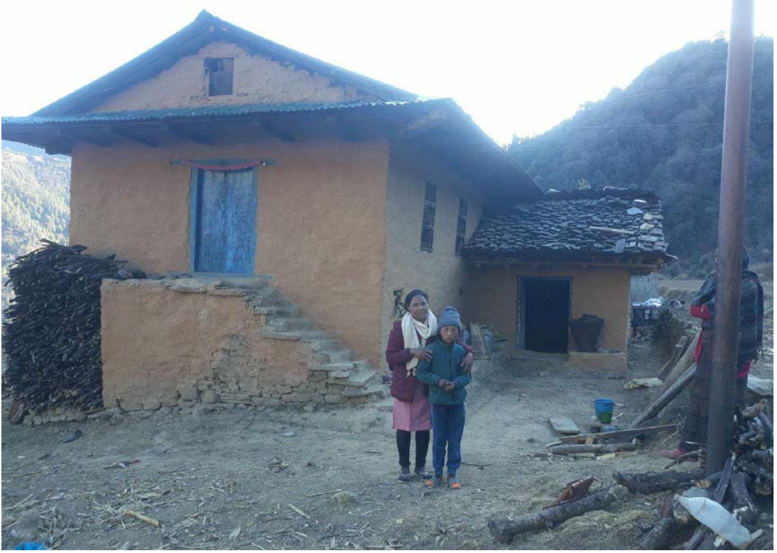
२०७९/१०/६ गते थबाङ उवाङुङचाङ पूर्वलङाकुको छोरीसङ्ग लिएको फोटो