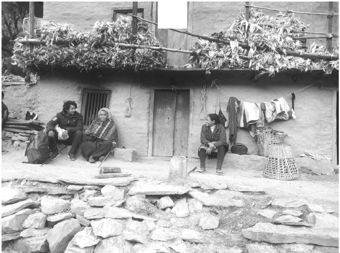
२०७९/१०/१५ गते छिपखोला पूर्व लडाकुको आमासँग घरमा लिएको फोटो