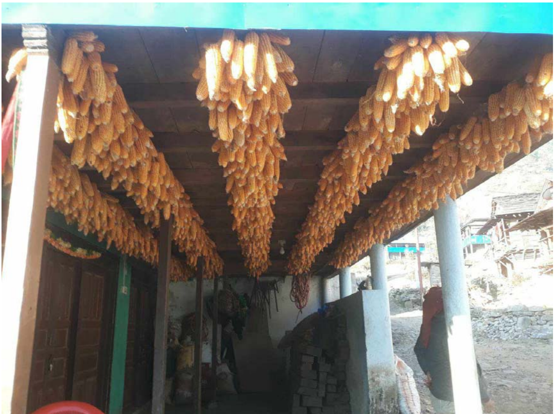
२०७९/१०/५ गते पूर्वलङाकुको घरमा लिएको फोटो जेलबाङको ठुलो गाउँ