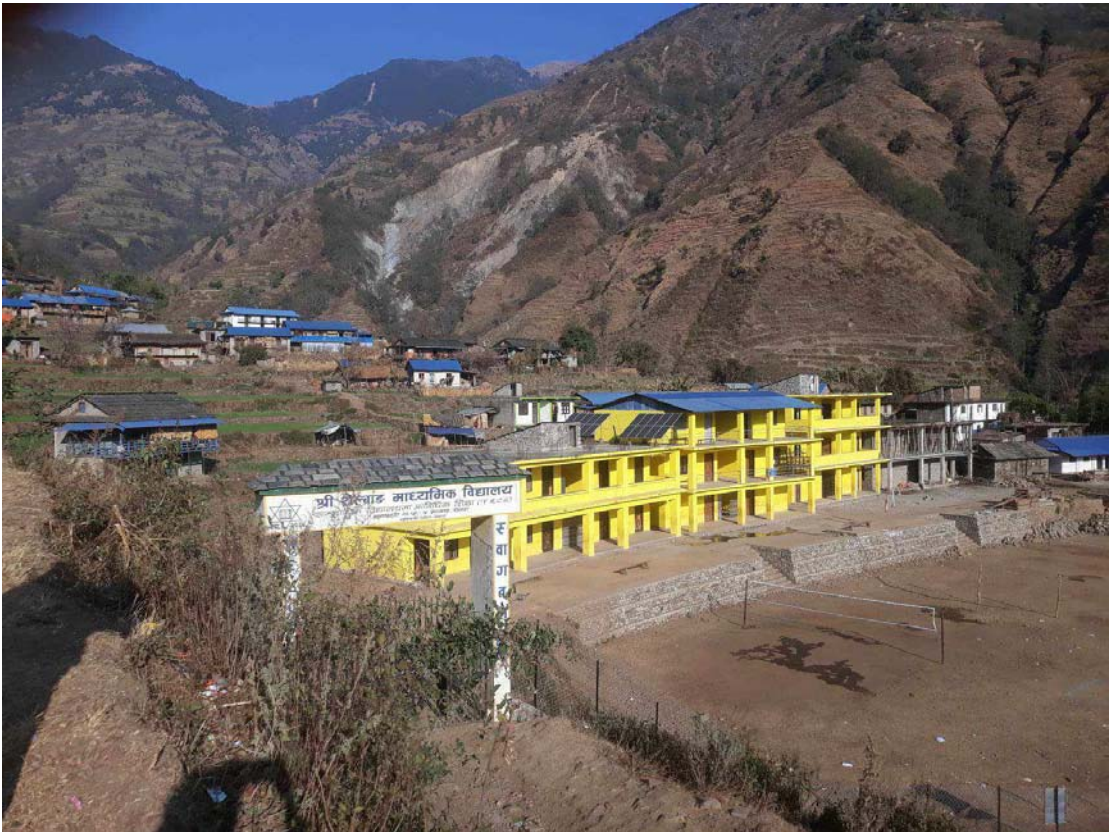
२०७९/१०/५ गते रोल्पाको जलजला स्कूलको फोटो