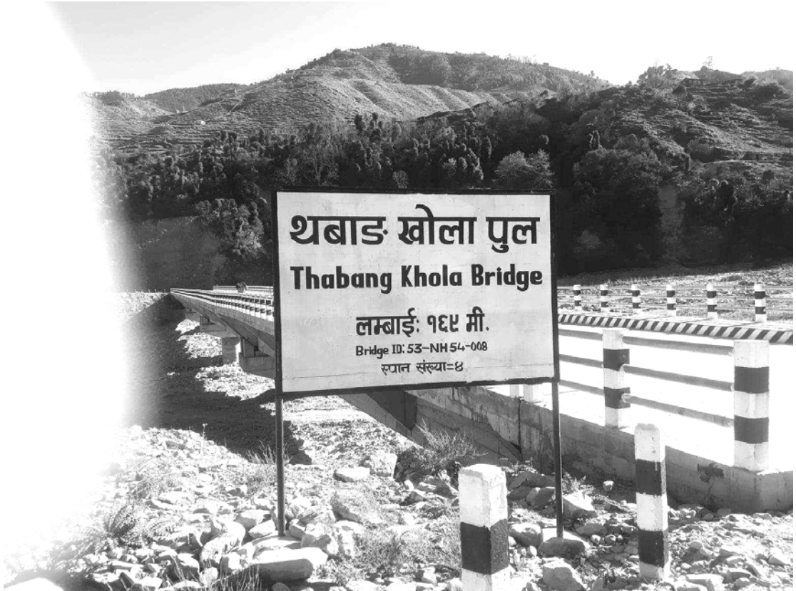
२०७९/१०/१२ गते लिएको फोटो