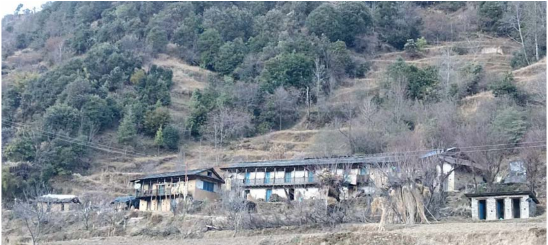
२०७९/१०/१२ गते राँचीबाडको कम्युनको घरको फोटो