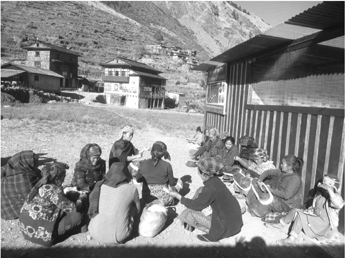
२०७९/१०/१६ गते पूर्व रुकुमको ताक्सेरामा पूर्वलडाकु र सरोकारवालासँग गरिएको छलफल