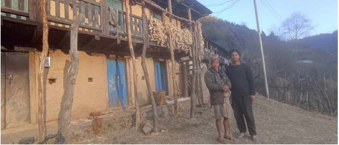
२०७९/१०/०७ गते थबाङको राचिवाङ, कम्युनमा बस्ने पूर्वलडाकुसँग लिएको फोटो