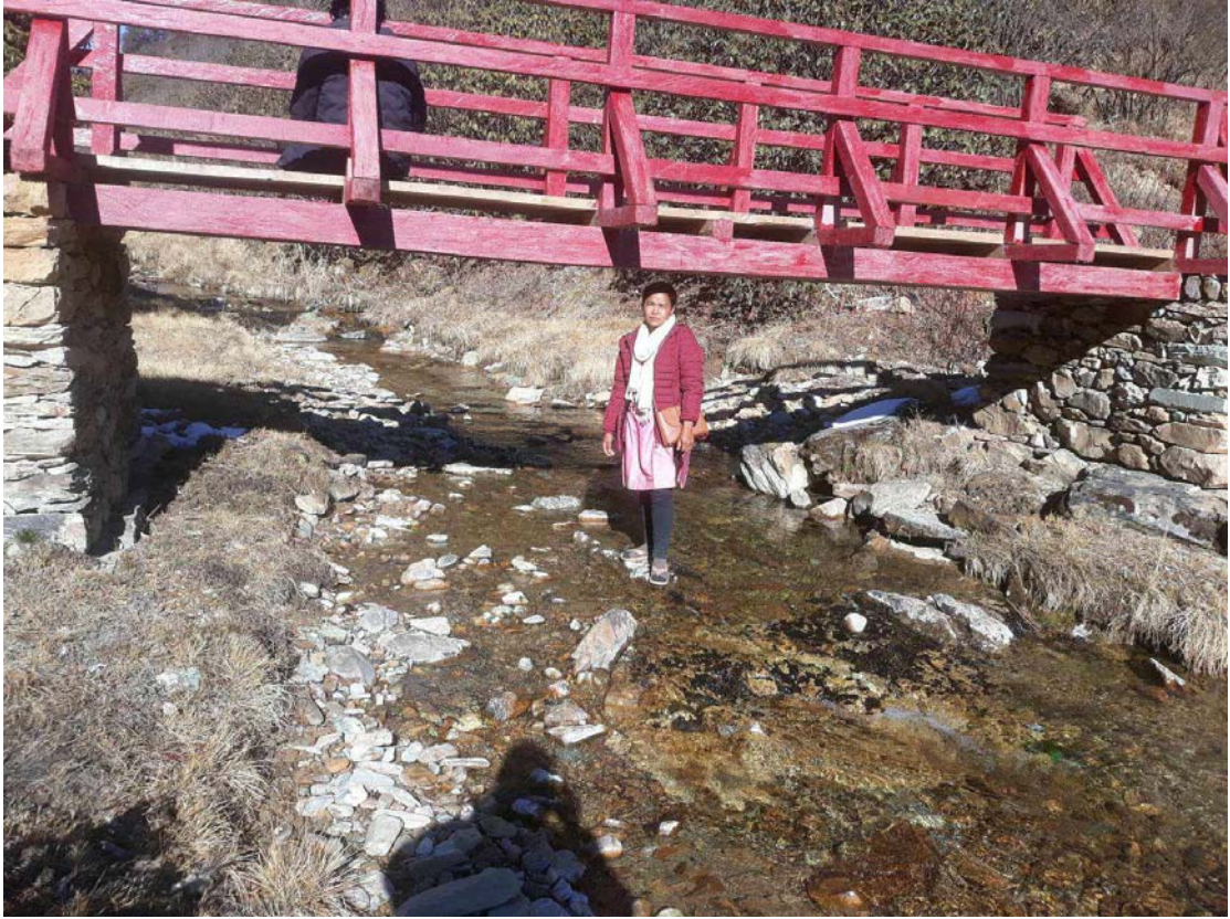
२०७९/१०/०७ गते जलजल हिमालबाट बगेको खोला