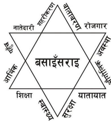
चित्र नं. ६.१ : बसाइँसराइका कारक तत्वहरु

सहयोग र सदभाव हुने भएका कारण बसाइँसराइ बढेको छ । यस क्षेत्रका मानिसहरु आफ्नो हैसियत, सामाजिक, मानमर्यादा, प्रतिस्पर्धाको कारणले बसाइँसराइमा जोड दिने गरेका छन् । मुख्य रूपमा शिक्षा, स्वास्थ्य, यातयात लगायतको सेवा सुबिधाको खोजीमा बसाइँसराइ हुने गरेको छ । ग्रामीण सहरको रूपमा स्थापित यस सहरमा निसीखोला, भुजीखोला, तमानखोला, बढिगाडबाट बसाइँसरी आएको पाइन्छ । विभिन्न जात जातिको बसोबास रहेको यो ठाउँमा बसाइँसरी आएकामा ब्राम्हण जातिको सबै भन्दा बढि २५ प्रतिशत रहेको छ । घरमुलिको मुख्य पेशा ५१ प्रतिशतले व्यापार व्यवसाय गरेको पाइन्छ । सामान्य दैनिक उपभोग्य वस्तुको खरिद बिक्रीदेखि लिएर सम्पूर्ण सामानको होलसेल तथा खुद्रा समानको लेनदेनको केन्द्र पनि भएको कारण मानिसको आवत जावत बढि हुने हुँदा र ग्रामीण भेगको मानिसहरु विभिन्न सेवा सुबिधाको उपभोग गर्न पैसा तिरेर आफ्नो आवस्यकाता परिपूर्तिमा सहजता हुने भएकोले पनि यस ठाउँमा आउने क्रम बढदो छ जसले गर्दा जग्गाको मूल्य पनि महङ्गीन पुगेको छ ।