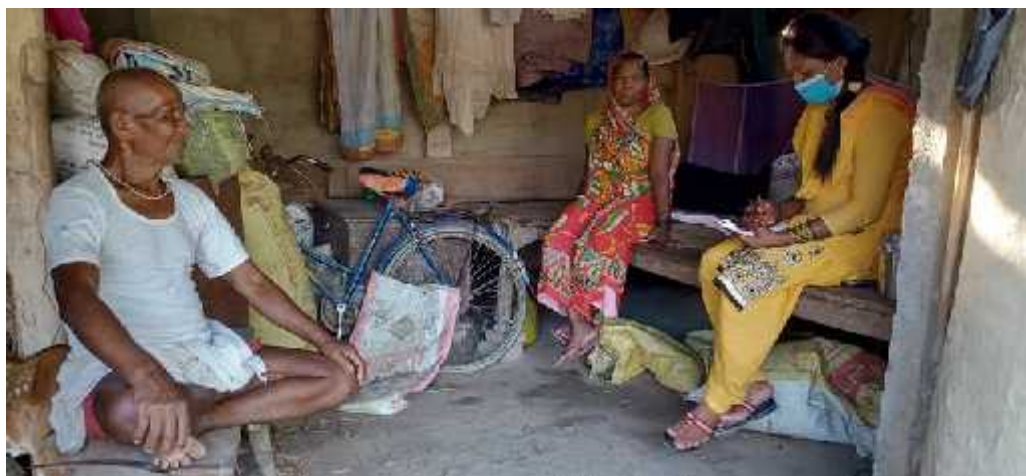
दृष्य नं. १- अर्न्तवर्ता लिएको अवस्था