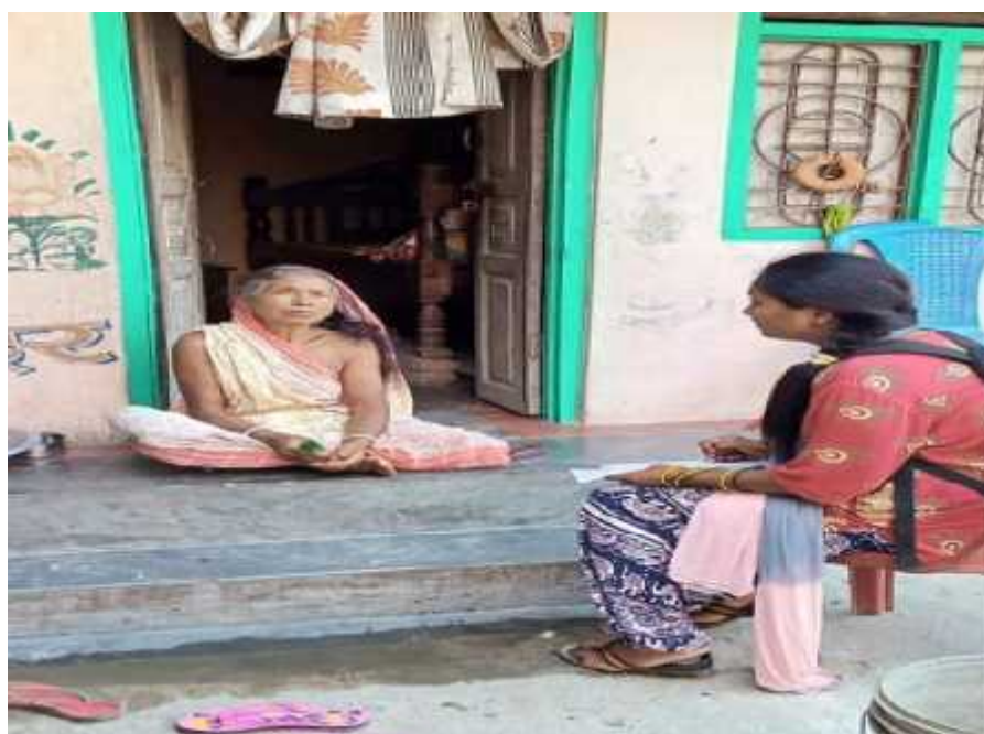
दृष्य नं. २-अर्न्तवर्ता लिएको अवस्था