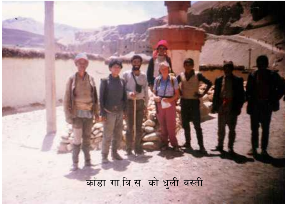
काँडा गा.वि.स. को धुली वस्ती