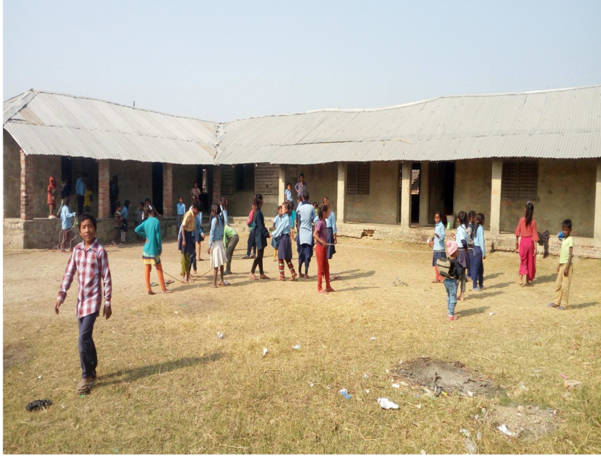
चित्र नं. ७ अध्ययन क्षेत्रमा रहेको श्री आधारभूत विद्यालय