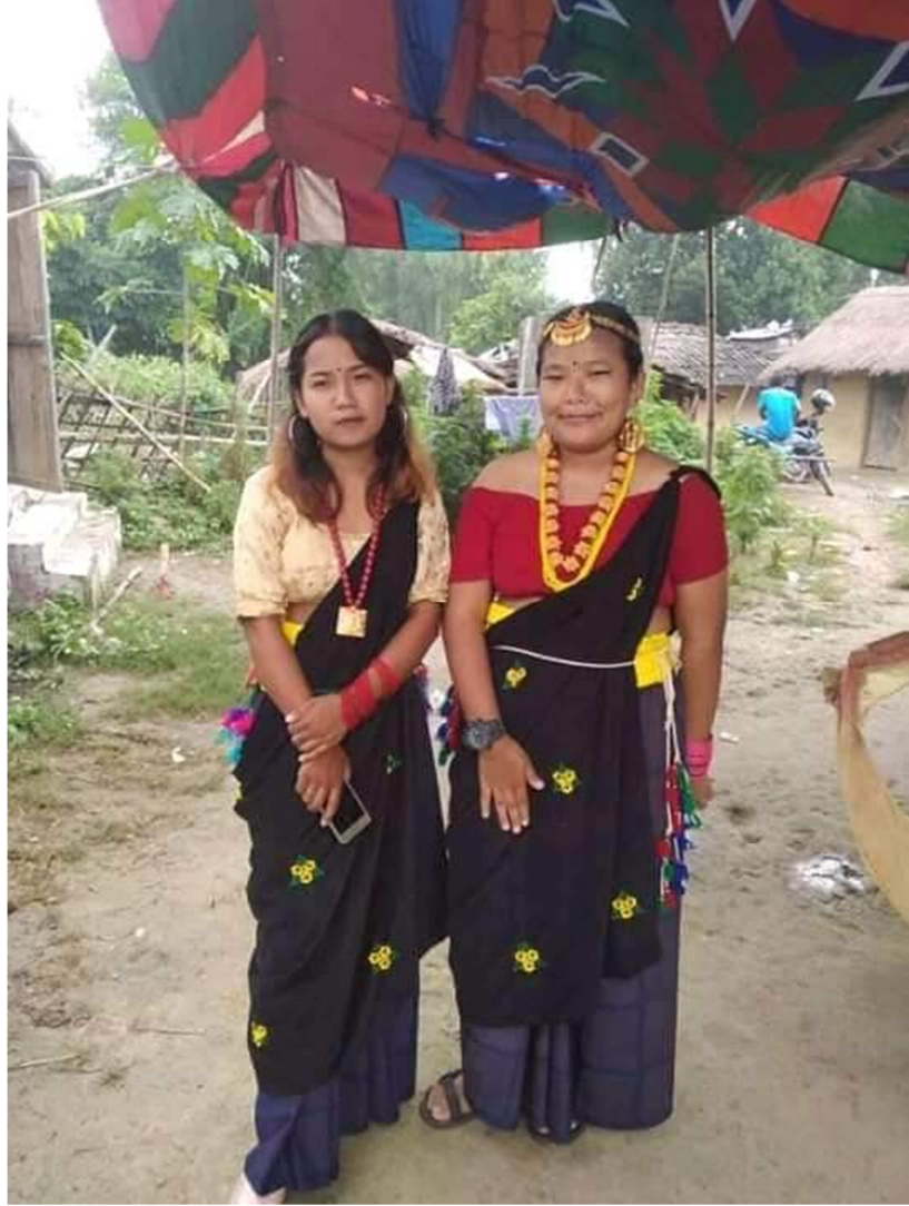
चित्र नं.२२ मगर जातिको पोशाकमा आएको परिवर्तनमा