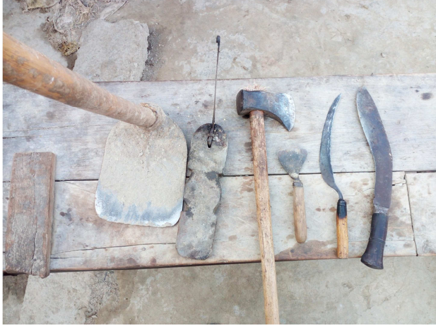
चित्र नं. ८ चारघरेका मगरहरुले प्रयोग गर्ने हातहतियारहरु