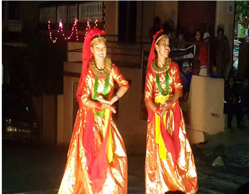
चित्र नं. १७ मगरहरूको मारुनी नाच