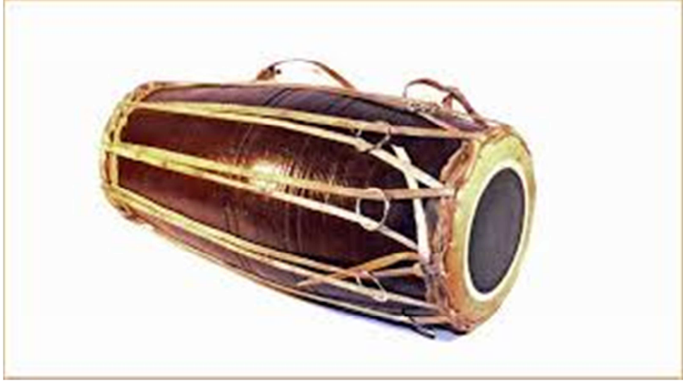
चित्र नं. १८ मादल