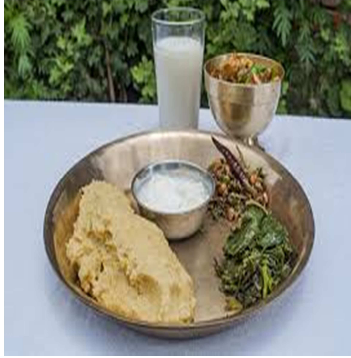
चित्र नं. १२ मगरहरूको खाना