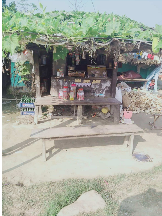
चित्र नं. ९ चरघरेमा अवस्थित स्थानीय खद्रा पसल