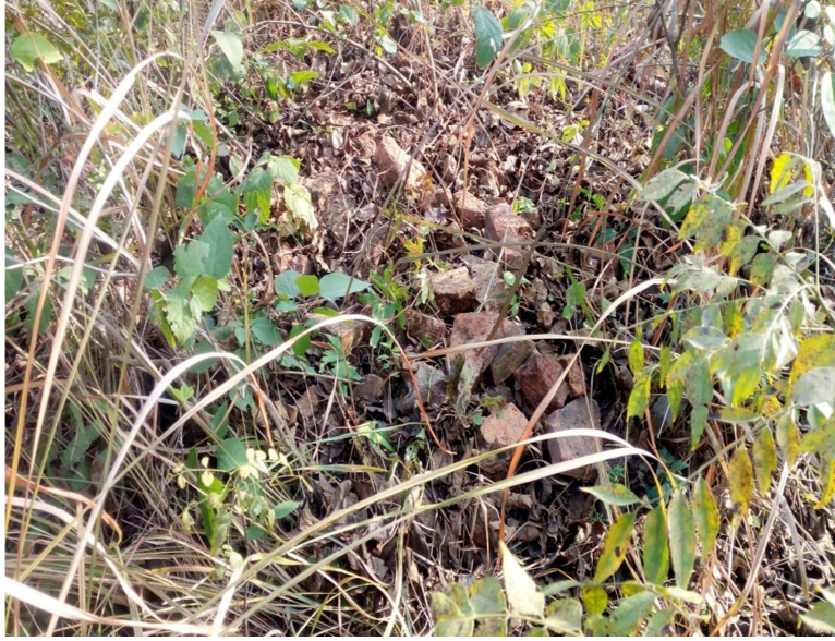
चित्र नं. ३ गढि डाँडा