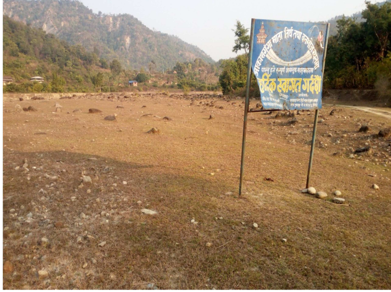
चित्र नं. ४. गोला