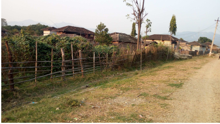
चित्र नं. १० चारघरेमा अवस्थित घरको बनावट