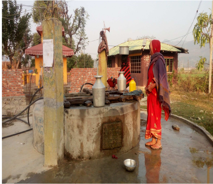
चित्र नं. ५ पुरानो इनार