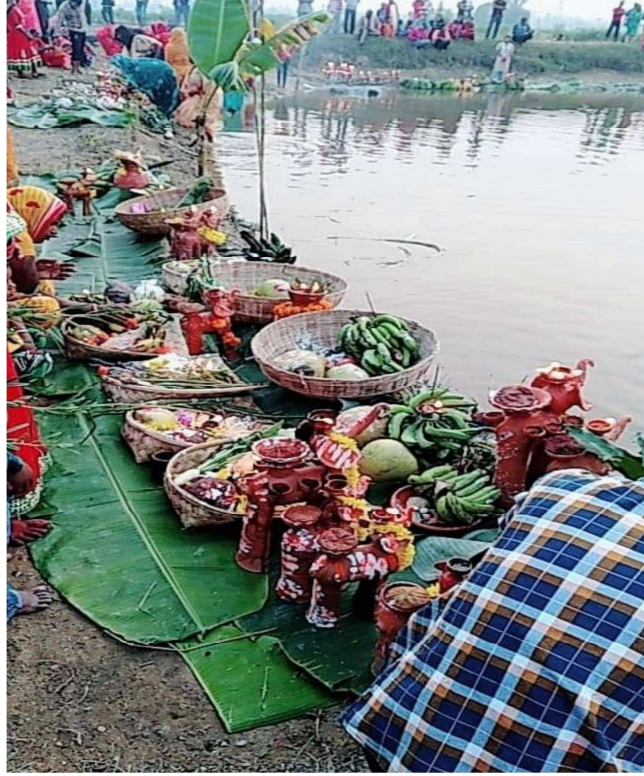
चित्र नं. १४ चारघरेका मगरहरुले छठको सामग्री तयार पार्दै