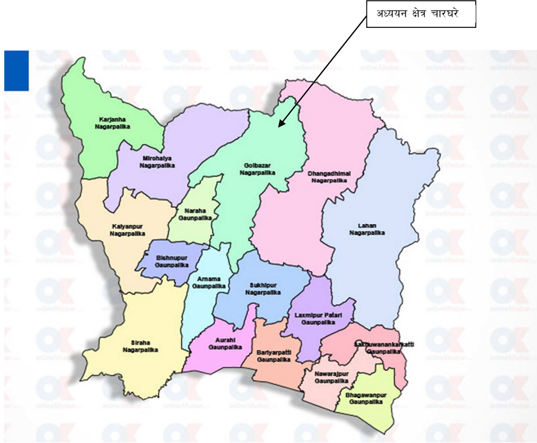
(चित्र नं. १)