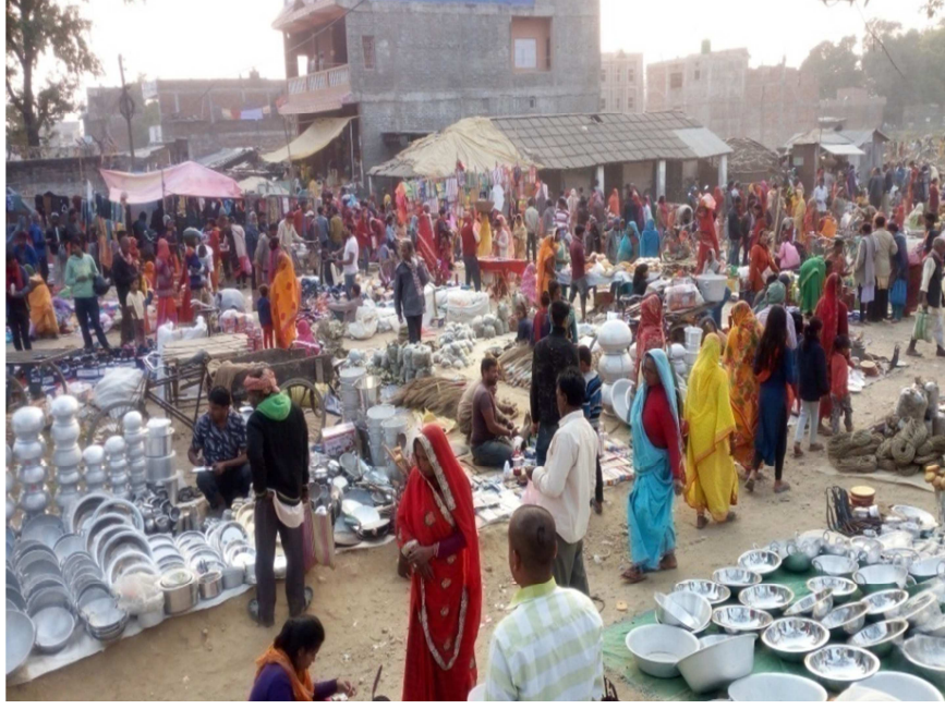
चित्र नं. ६ अध्ययन क्षेत्रमा रहेको गोलबजार