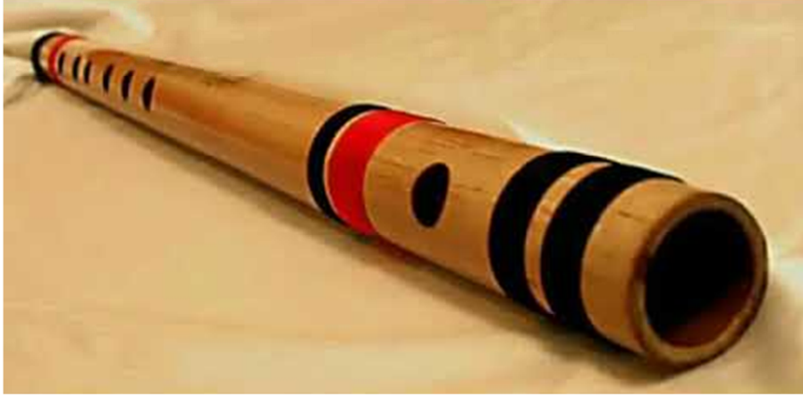
चित्र नं. २१ बाँसुरी