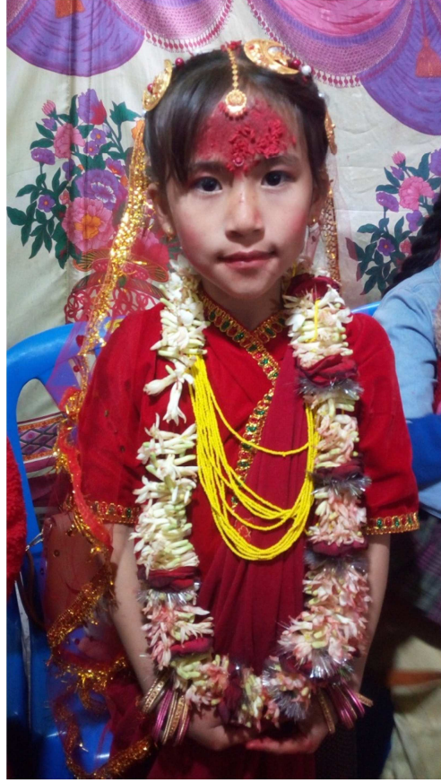
चित्र नं. १६ गुन्याचोलो संस्कारको बखत परम्परागत भेषभुषामा सजिएकी बालिका