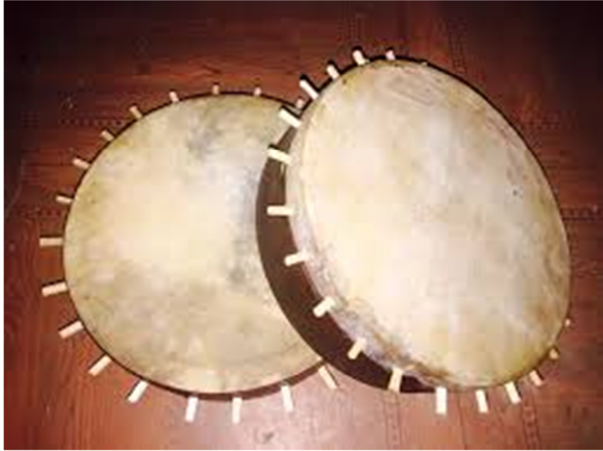
चित्र नं. १९ डम्फू