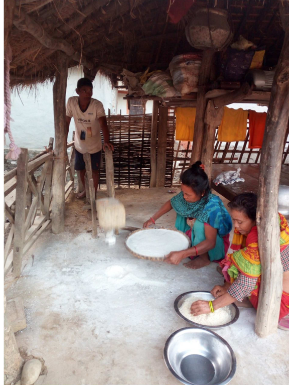
चित्र नं. १५ माघे संक्रान्तिको अवसरमा ढिकीमा चामल कुट्दै