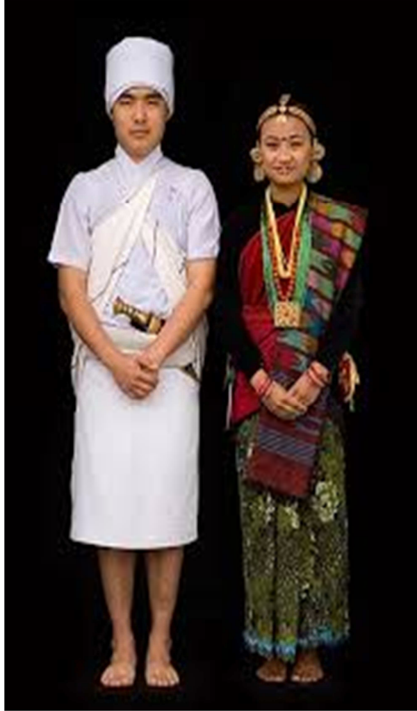
चित्र नं. ११ मगरको भेषभूषा