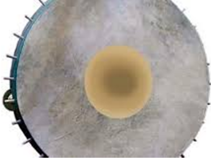
चित्र नं. २० खैजडी