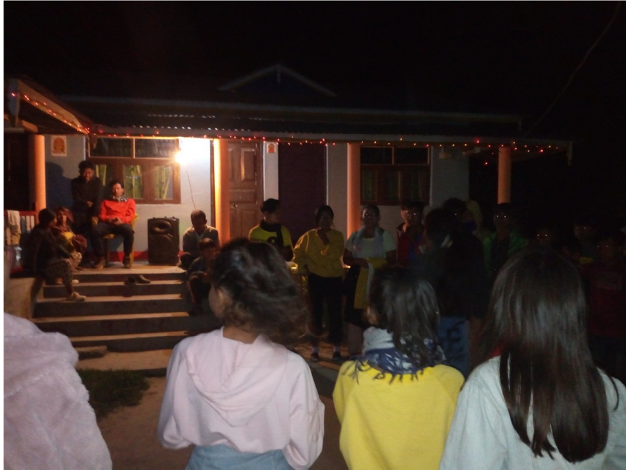
चित्र नं. १३ देउसी भैलो खेल्दै