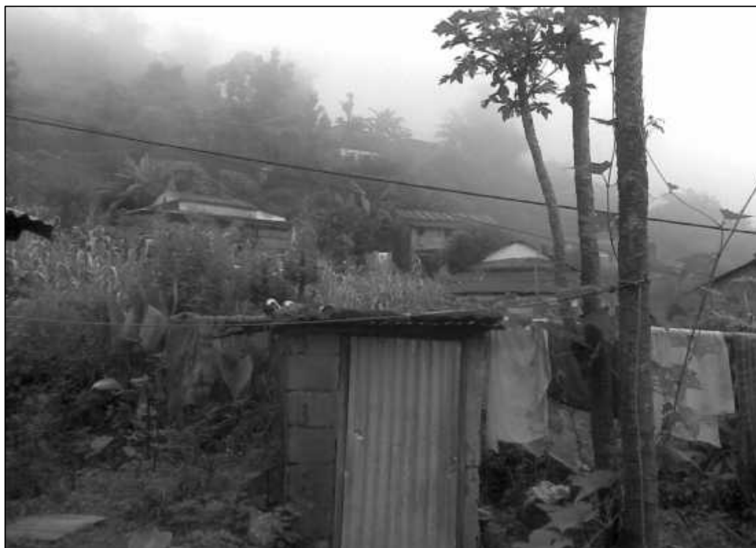
स्थानीय सार्की जातिको बस्तीमा शौचालयको व्यवस्था ।