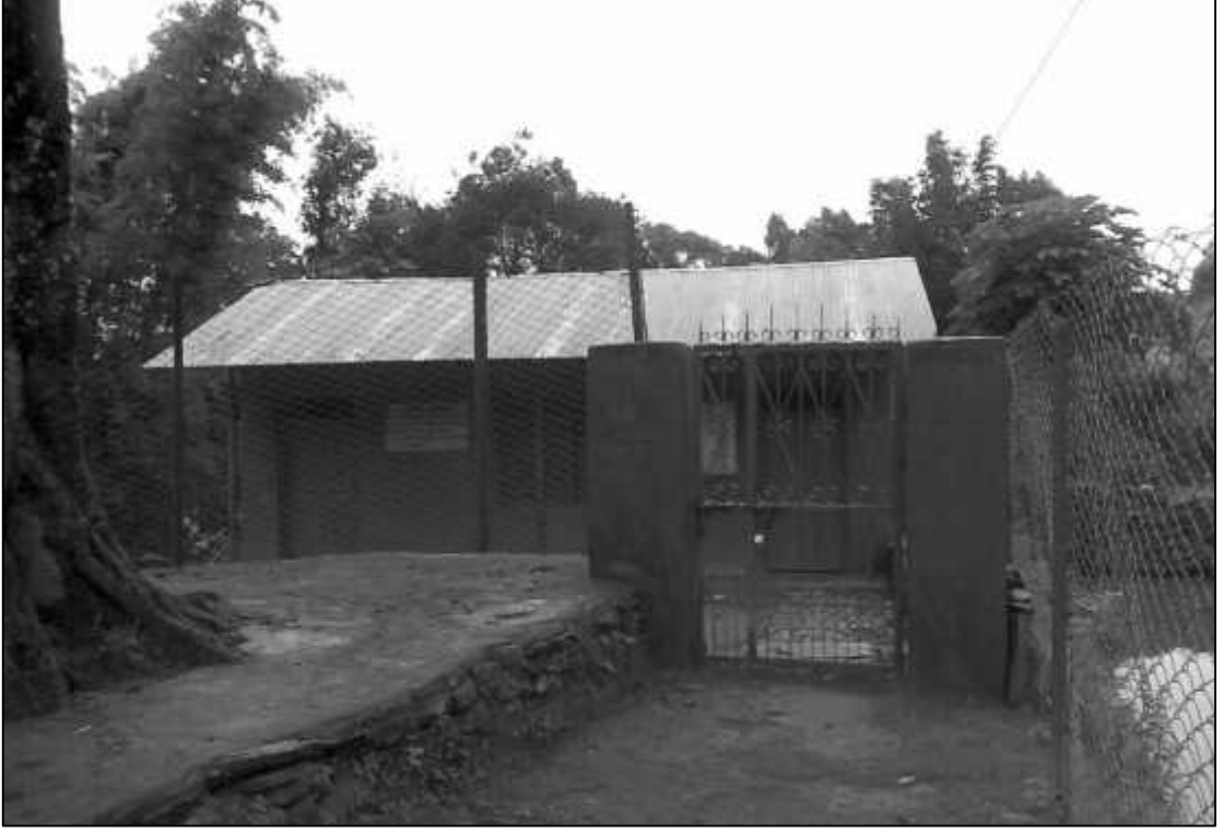
शिशु स्याहार तथा सामुदायिक भवन, माझठाना-१, डाँडागाउँ ।