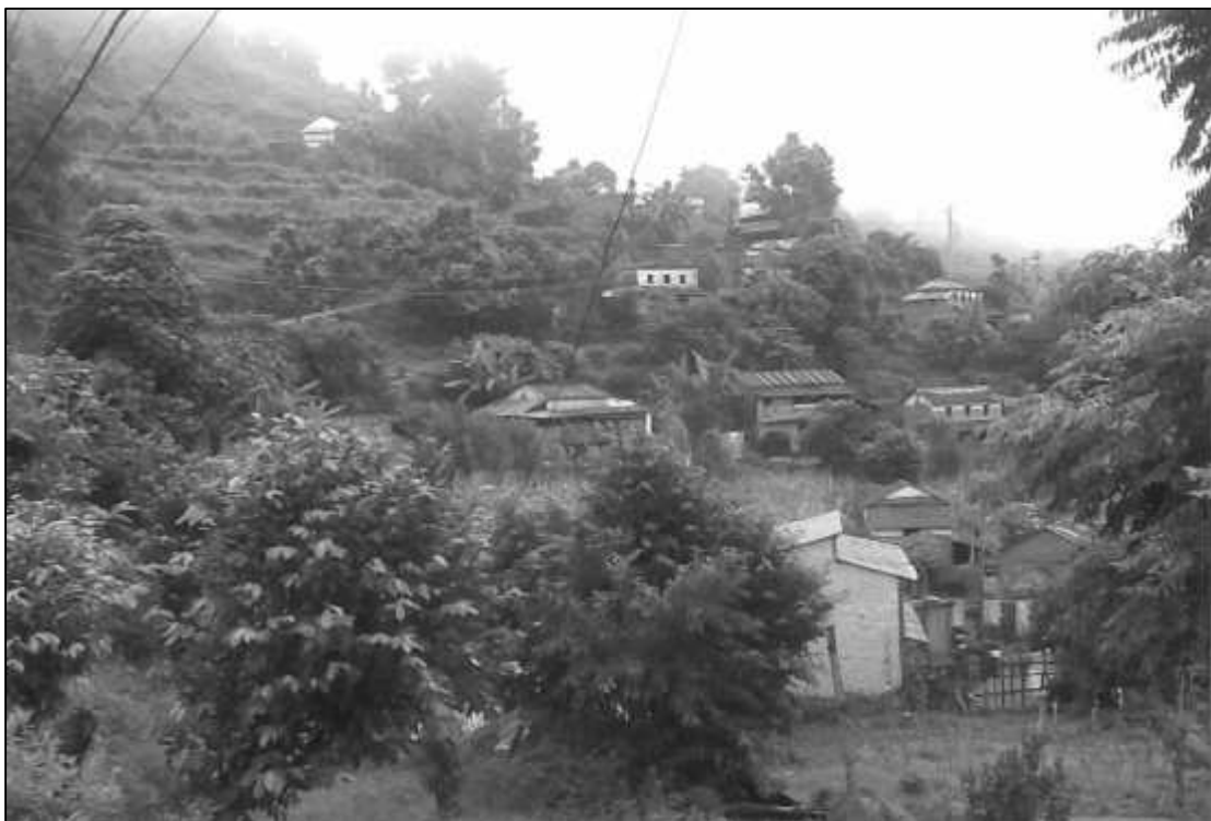
माभठाना-१, डाँडागाउँ (सार्कीथर) ।