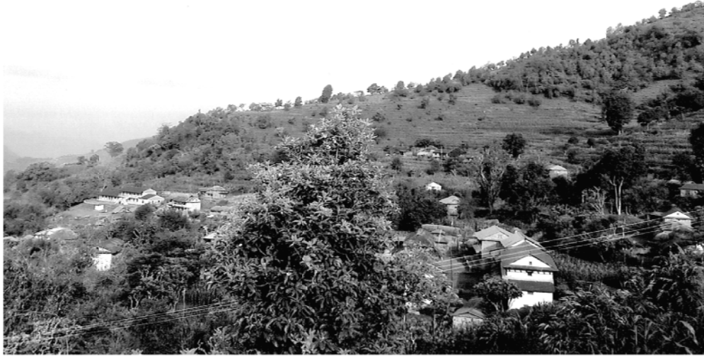
अध्ययन क्षेत्रका वाडा नं.६ अन्तर्गत पर्ने केहि बस्तिहरु