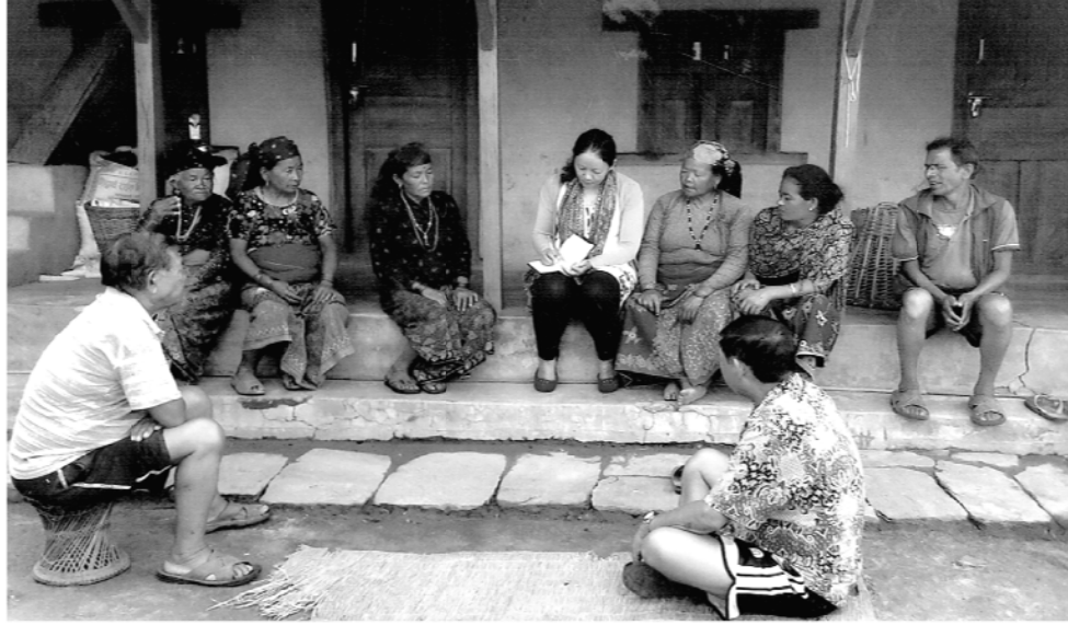
अनुसन्धानकर्ता अध्ययन क्षेत्रका दुरा समुदायका महिला पुरुषसँग सोधका प्रश्नहरु साध्दै