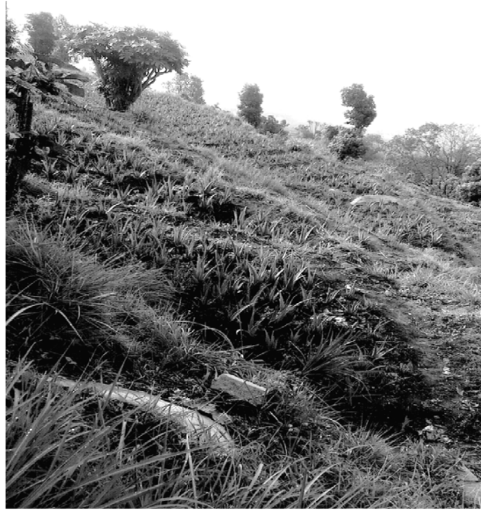
अनुसन्धान क्षेत्रमा प्ररम्परागत खेती प्राणलीलाई न्युनिकरण गर्दै आधुनिक खेती प्राणली अपनाउदै गरेको एक दृष्य