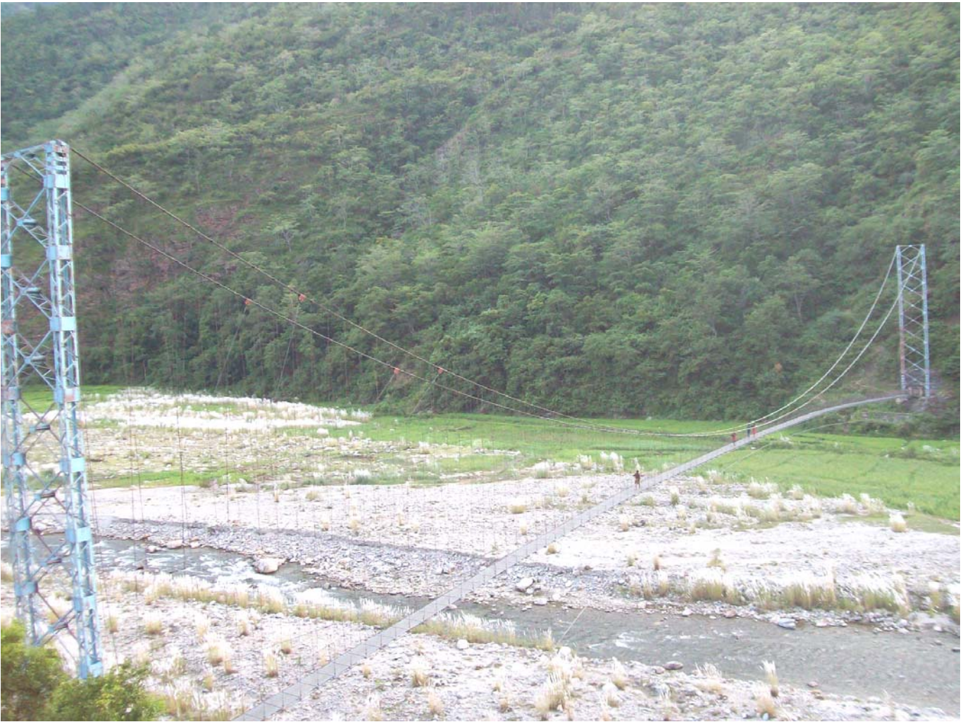
कुरुले तेनुपा वडा नं. ४ मा पर्ने नयाँ खोलामा रहेको एक मात्र भोलुङ्गे पुल