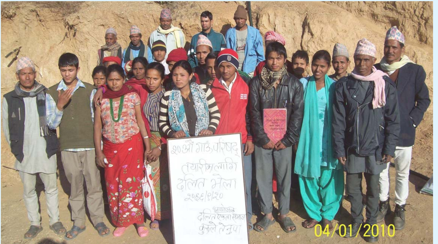
बीसौँ गाउँ परिषद् तयारीका लागि २०६६ पौष २० गते गाविस परिसरमा सम्पन्न कुरुले तेनुपा गाविसका अगुवा दलितहरुको भेला