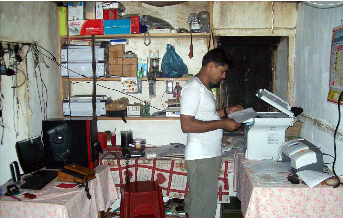
कुरुले तेनुपा वडा नं. ९ मा रहेको एक मात्र कम्युनिकेशन सेन्टर