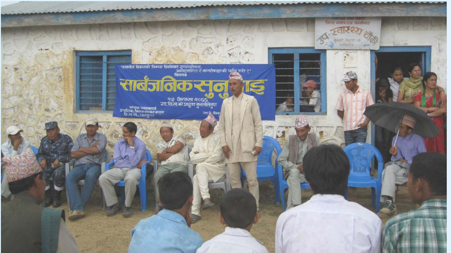
कुरुले तेनुपा गाविसमा २०६६ बैशाख १७ गते सम्पन्न सार्वजनिक सुनुवाइका अतिथि वक्ता एवं सहभागीहरू