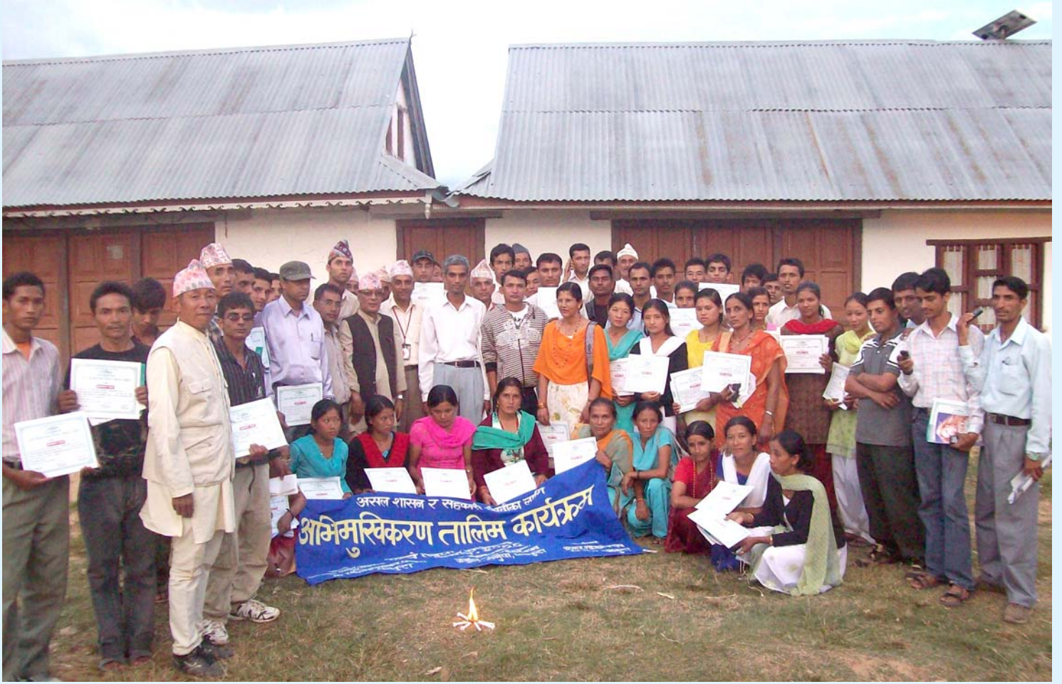
डिभिजन सहकारी कार्यालय र जनहित असल शासन क्लबको संयुक्त संयोजनमा २०६६ असोज १९-२० मा कुरुले तेनुपा गाविसमा सम्पन्न अभिमुखीकरण तालिमका प्रशिक्षक एवं सहभागीहरू