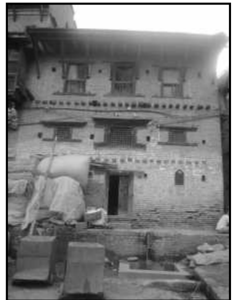
चित्र नं. १९ भक्तपुर तालाक्को मठ