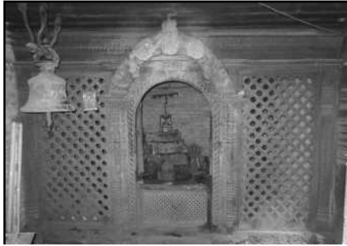
चित्र नं. ३५. भक्तपुर सुकुलढोका मठ स्थित शिवपाञ्चायन देवताहरु सहितको पूजाकोठा