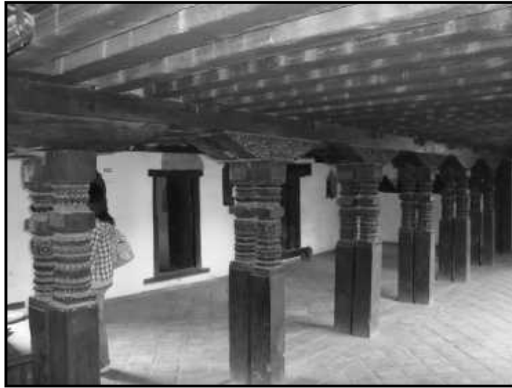
चित्र नं. २१ चिंकफ मठको खुल्ला चोटाकोठा