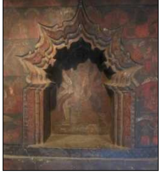
चित्र नं. २७ अर्धनारीश्वर