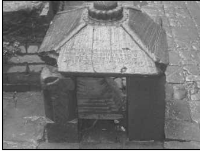
चित्र नं. ३४. जंगम मठ भित्र रहेको अभिलेख सहितको क्षेत्रपाल