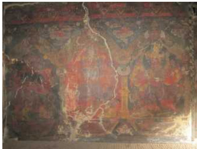
चित्र नं. २५ कुथु मठमा रहेको महिषासुरमर्दिनी, महाकाली र कुमारीको भित्तेचित्र