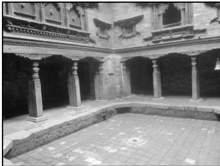
चित्र नं. २२ पूजारी मठ भित्र चोकमा रहेको बुट्टेदार जोडी खम्बा सहितको खुल्ला दलान