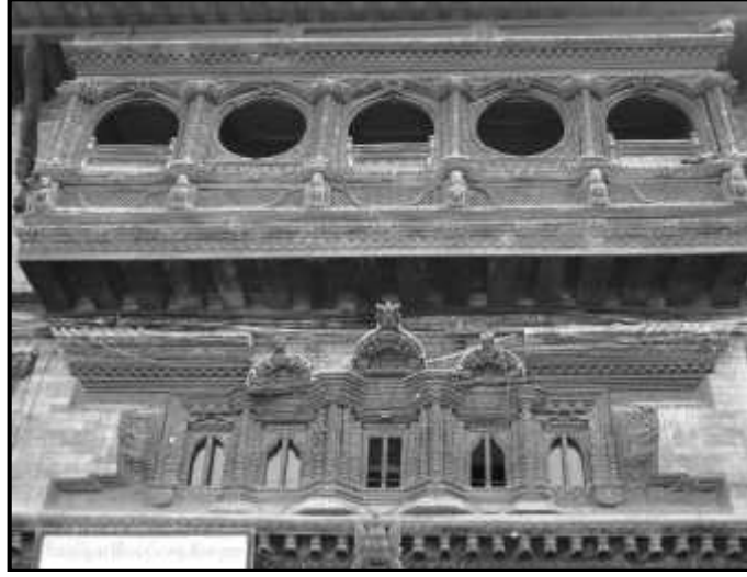
चित्र नं. ५. भक्तपुर दथु मठ स्थित विमान भ्याल तथा पासुखा भ्याल