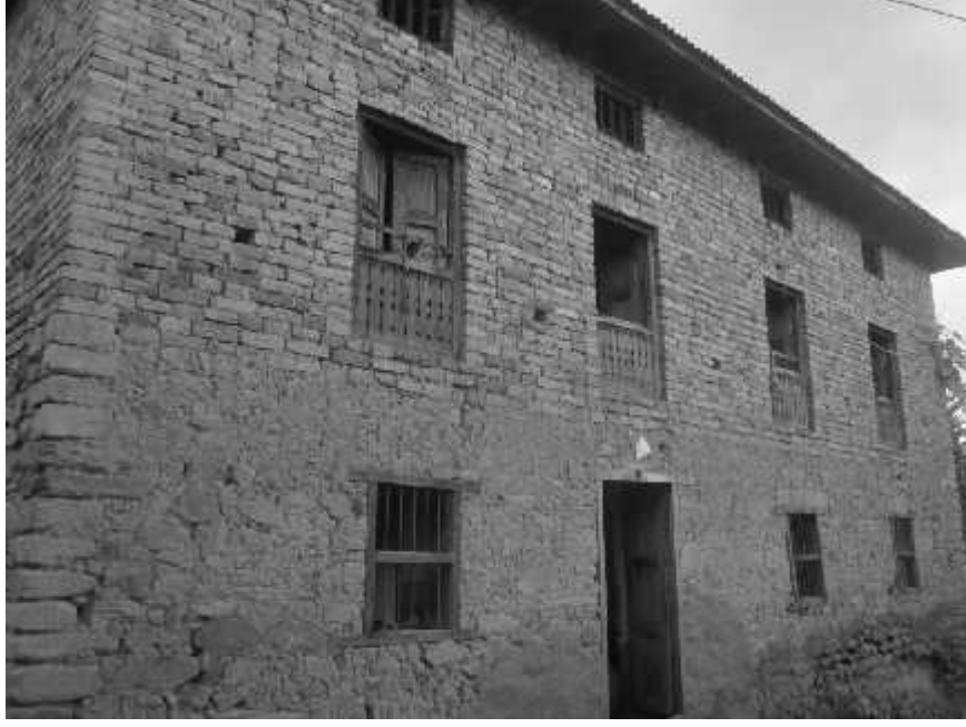
चित्र नं. ४० चाँगुनारायण गाविस वडा नं. ७ मा अवस्थित ग्वालदह मठ