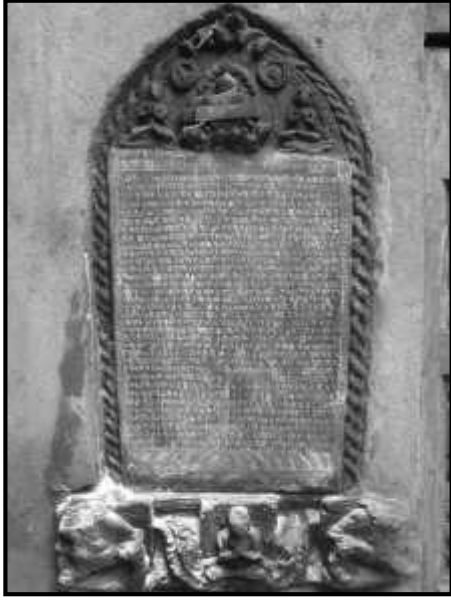
चित्र नं. ३०. भक्तपुर क्वाठण्डौ मठको शिलापत्र