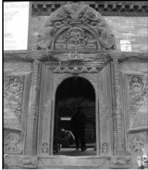
चित्र नं. ११. भक्तपुर दथु मठ स्थित तोरण सहितको मूल प्रवेशद्वार