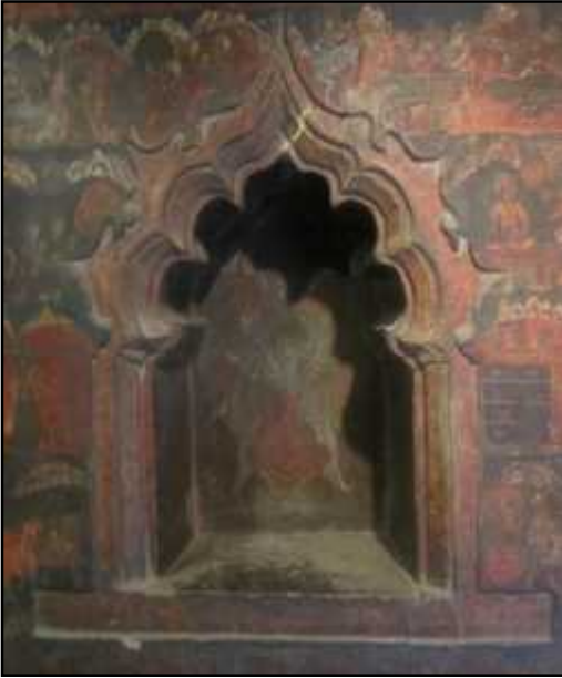
चित्र नं. २८. गरुडासन विष्णु