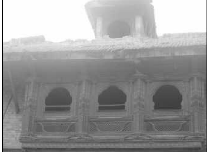
चित्र नं. ७. भक्तपुर गोदावरी मठ स्थित माकःप्वल भ्याल तथा विमान भ्याल