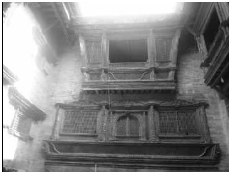
चित्र नं. ३९ सुकुलढोका मठ स्थित गा:भ्याल