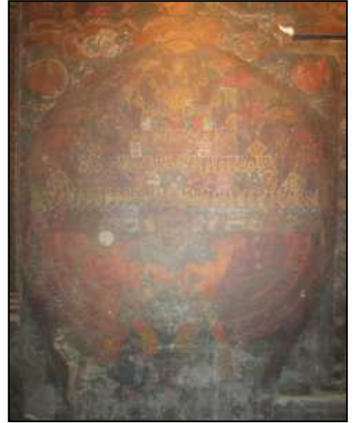
चित्र नं. २९. विश्वरूप भैरव