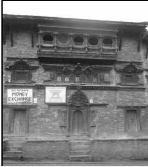
चित्र नं. १०. भक्तपुर दथु मठ