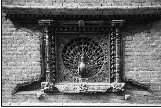
चित्र नं. १.क भक्तपुर पूजारी मठ स्थित मयूर भ्याल