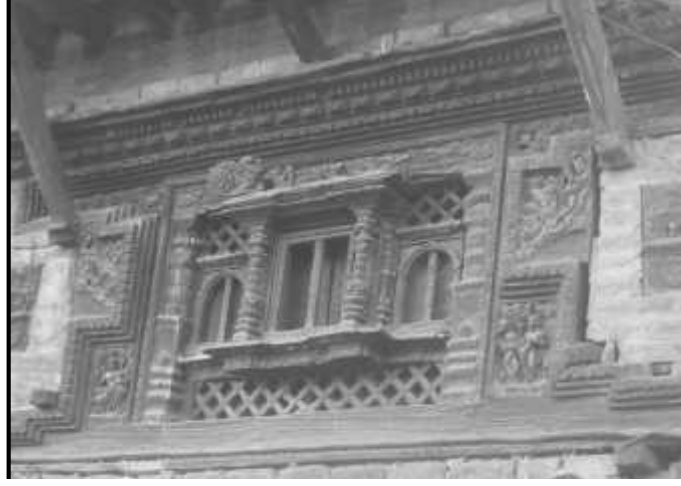
चित्र नं. ४ भक्तपुर जंगम मठ स्थित बाकु भ्याल