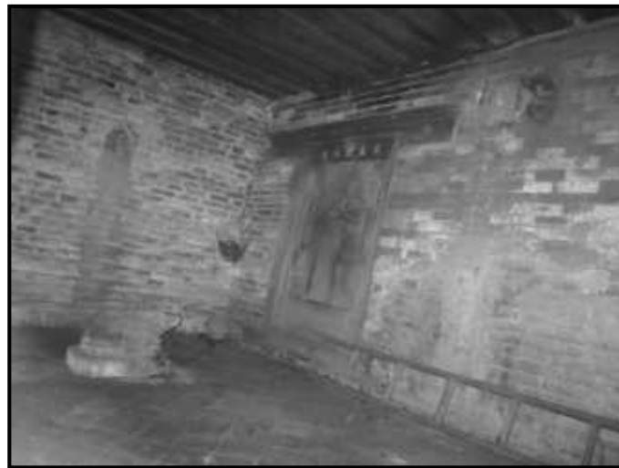
चित्र नं. ३६. भक्तपुर पुजारी मठ स्थित भैरव, नन्दी सहित विश्वेश्वर महादेवको पूजाकोठा