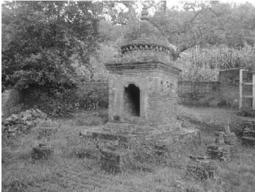
चित्र नं. ४३ ग्वालदह मठ स्थित पूर्व महन्तहरुको समाधिमाथि स्थापना गरिएका शिवलिङ्गहरु ।