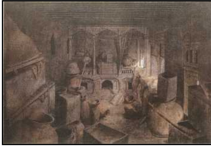
चित्र नं. २३ पुनःनिर्माण हुनु अगाडिको कुथु मठमा रहेको भित्तेचित्र सहितको गद्दिकोठा