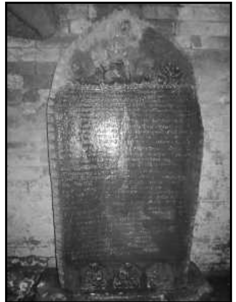
चित्र नं. ३३. भक्तपुर क्वाठण्डौ मठको शिलापत्र