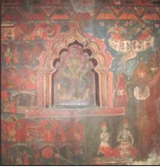
चित्र नं. २६ दत्तात्रय