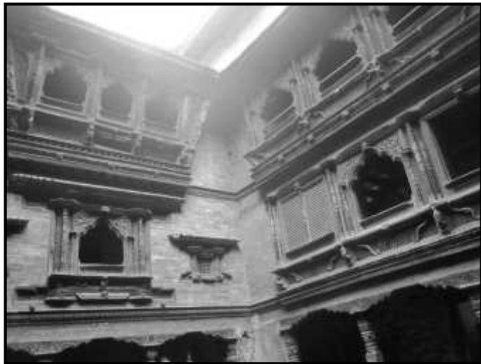
चित्र नं. ९. भक्तपुर सुकुलढोका मठ स्थित विमान भ्यालहरु