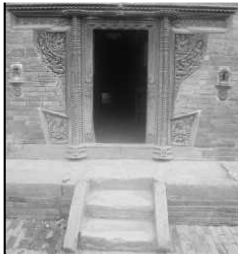
चित्र नं. १२. भक्तपुर पूजारी मठको मूल प्रवेशद्वार