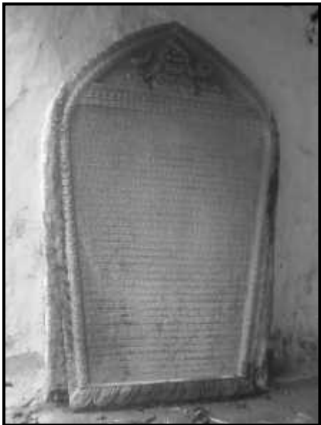
चित्र नं. ३२. भक्तपुर जंगम मठको शिलापत्र