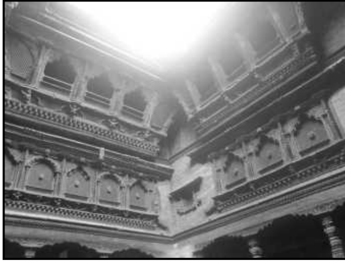
चित्र नं. १४. भक्तपुर पूजारी मठ स्थित संभ्याल तथा विमान भ्यालहरु