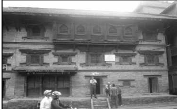
चित्र नं. २० भक्तपुर चिंकफ मठ