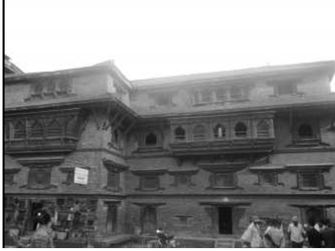
चित्र नं. १३. भक्तपुर पूजारी मठ