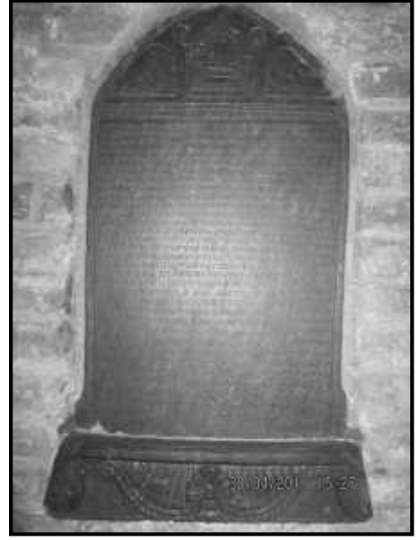
चित्र नं. ३१. भक्तपुर सुकुलढोका मठको शिलापत्र