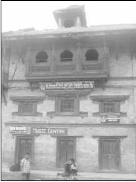
चित्र नं. १६ भक्तपुर गोदावरी मठ