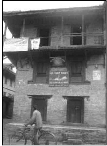
चित्र नं. १७ भक्तपुर वार्दली मठ