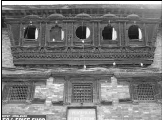
चित्र नं. ८. भक्तपुर तःजा मठ स्थित छत्र सहितको विमान भ्याल