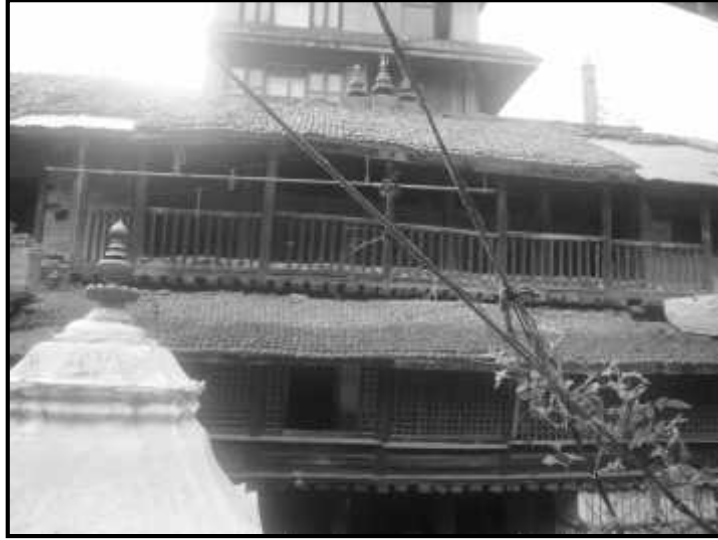
चित्र नं. ३७ जंगम मठ भित्र कुल देवता वीरभद्र रहेको स्थान