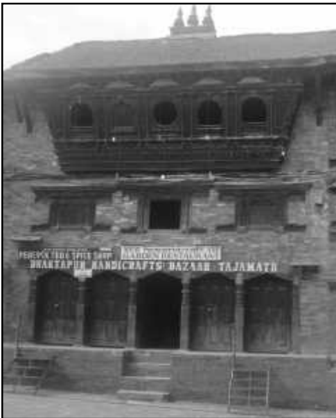
चित्र नं. १८ भक्तपुर गजूर सहितको तःजा मठ