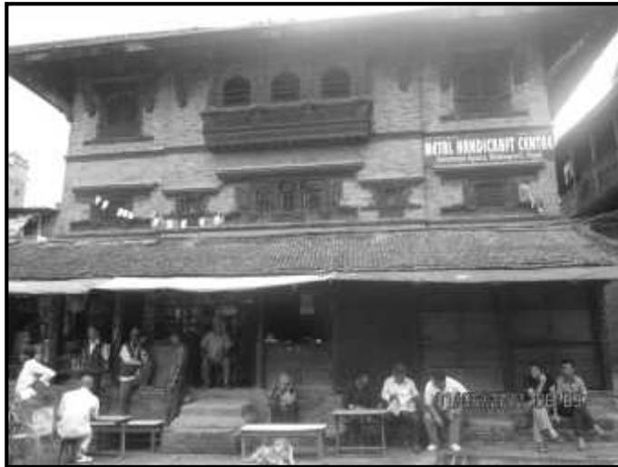
चित्र नं. १५. भक्तपुर पुलांचोटा मठ