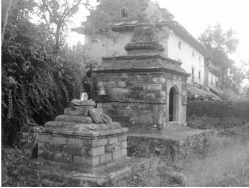
चित्र नं. ४२ ग्वालदह मठमा रहेको विश्वेश्वर महादेव र विष्णुको मूर्ति रहेको देवल