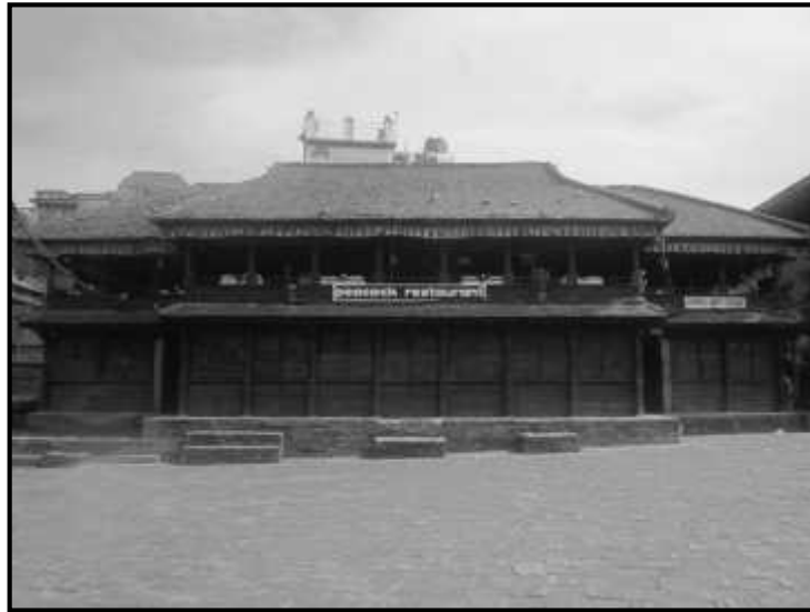
चित्र नं. ३८ भक्तपुर तचपाल टोल स्थित जंगम पाटी