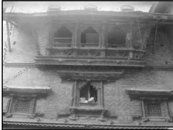
चित्र नं. ६. भक्तपुर ईखालखु मठ स्थित विमान भ्याल