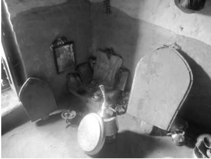
चित्र नं. ४१ ग्वालदह मठ भित्र रहेका अभिलेखहरु