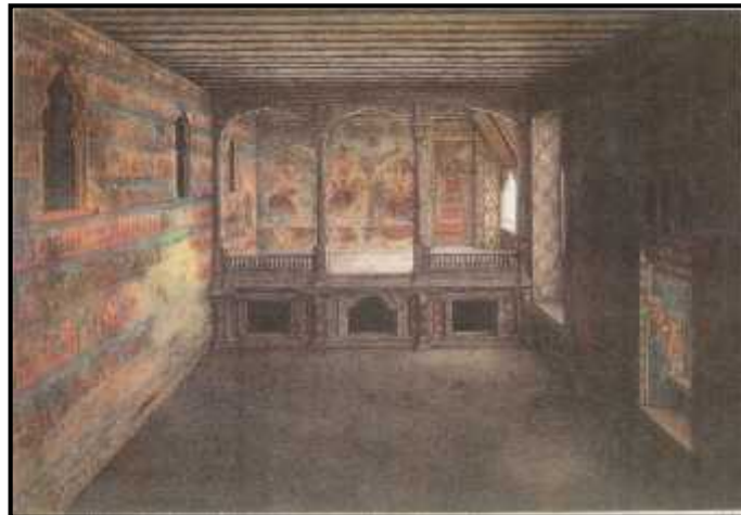
चित्र नं. २४ पुनःनिर्माण भइसकेपछिको कुथु मठमा रहेको भित्तेचित्र सहितको गद्दिकोठा