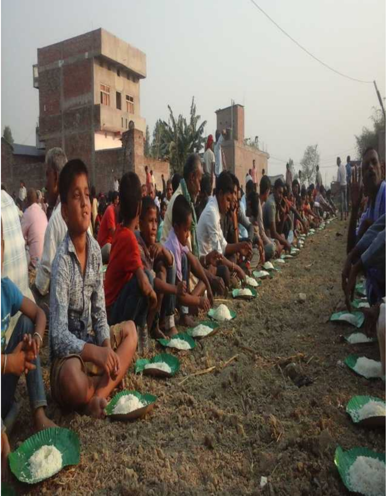
तस्वीर: यादव जातिको सभा भोज गोलबजार न.पा. ८