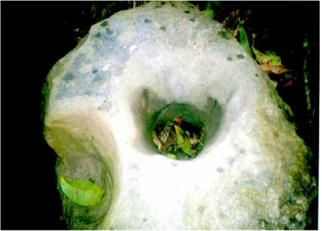
पुरानकोटको भगनावशेषमा भेटाइएका ढिकिको ओखल