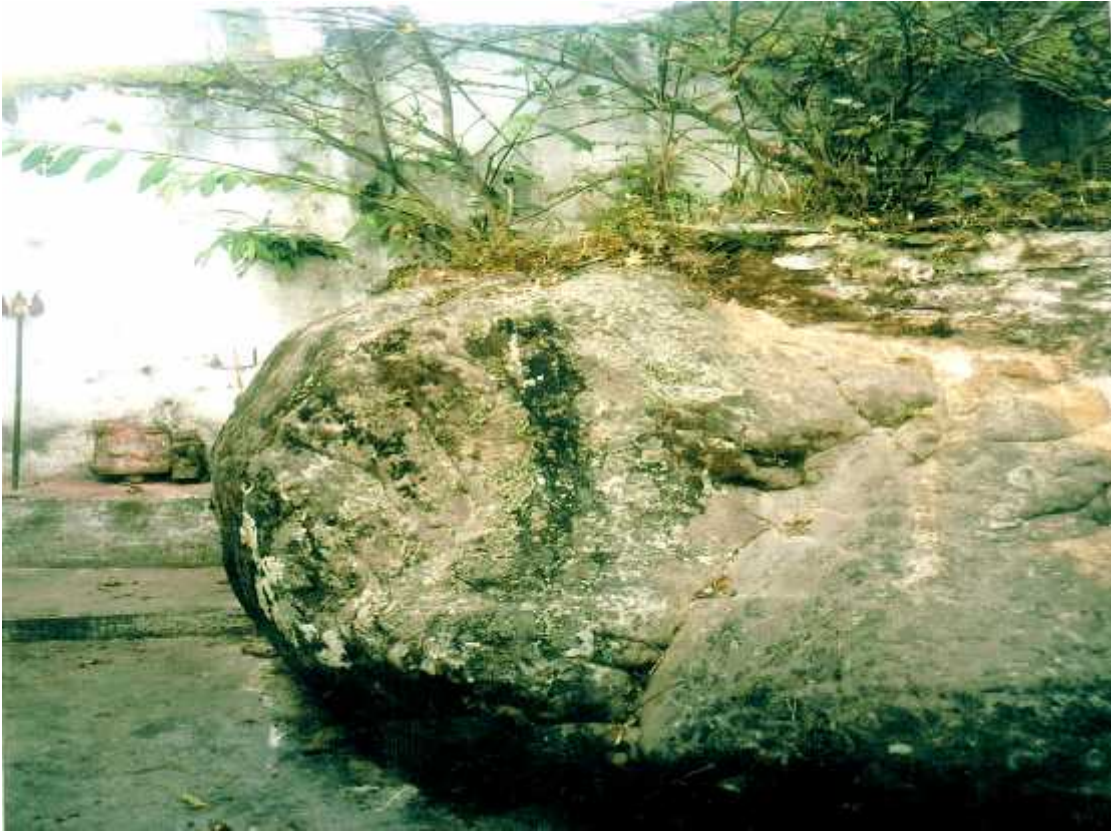
लमजुड दरवार स्थित गुरु गोरखनाथ बाबाको गुफा