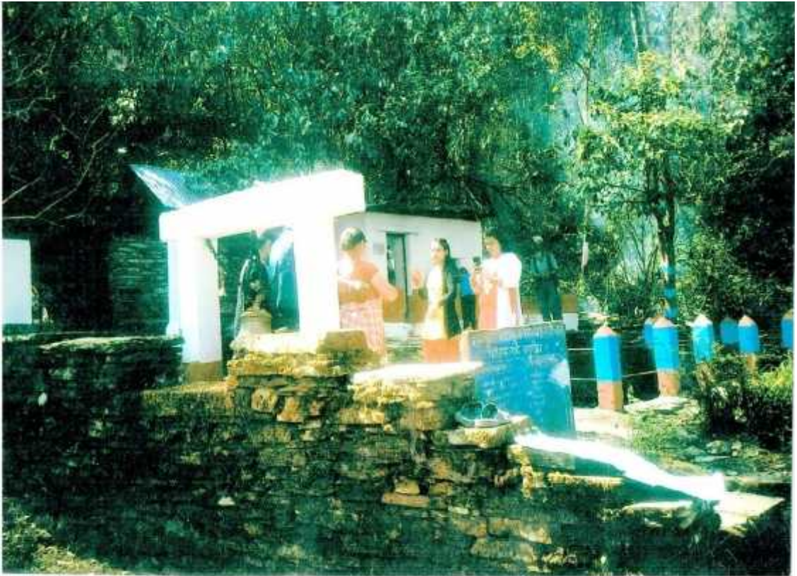
काउलेपानी देवीको मनिदर