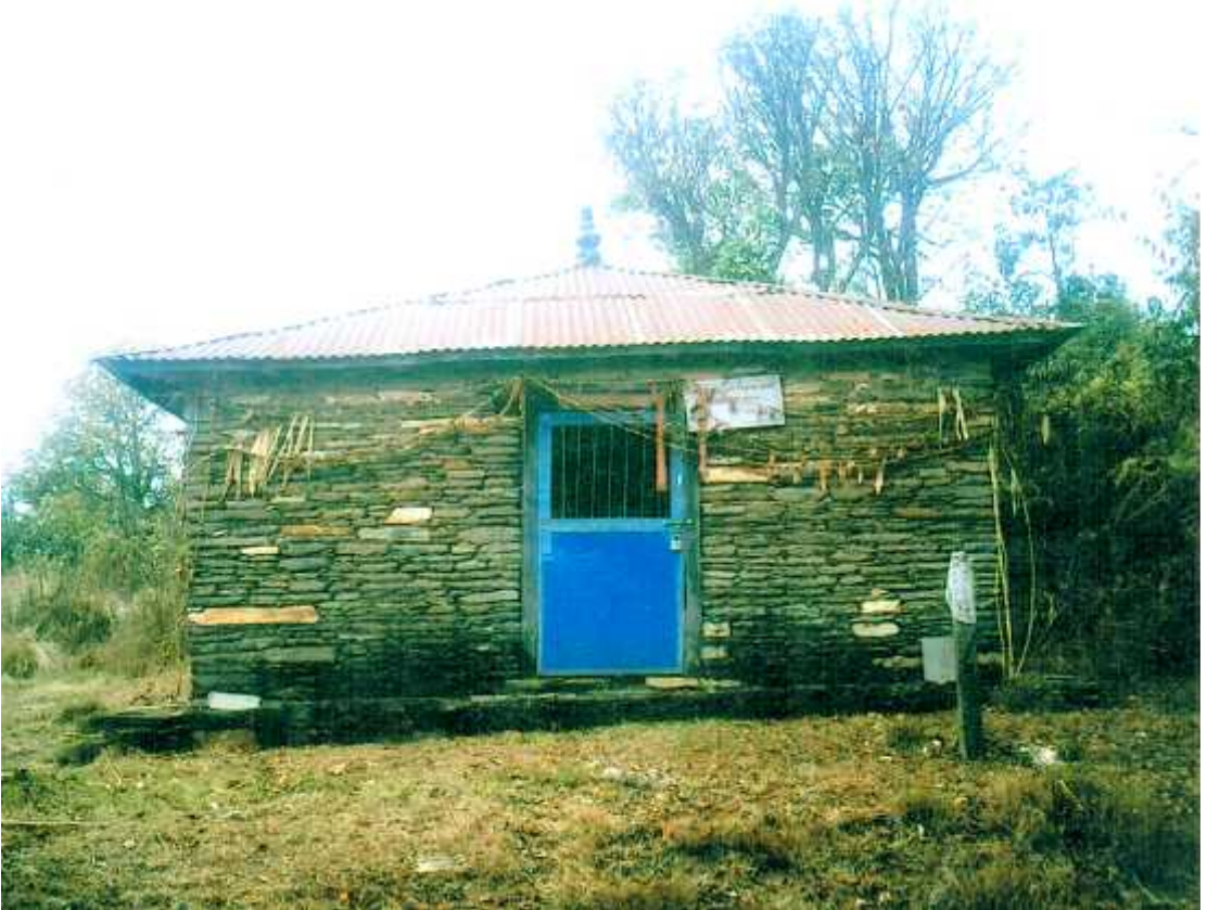
पुरानोकोट गढि स्थित मौला कालिकाको मन्दिर