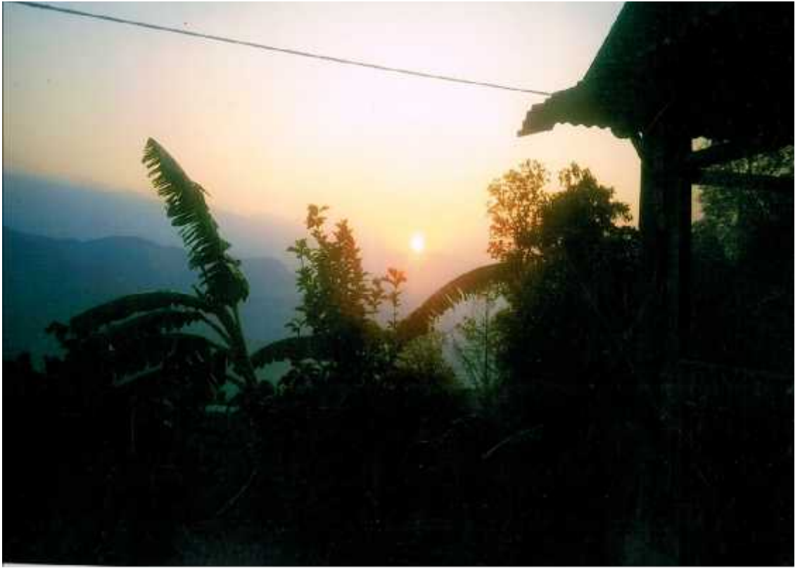
काउलेपानीबाट देखिने सूर्योदयको दृष्य