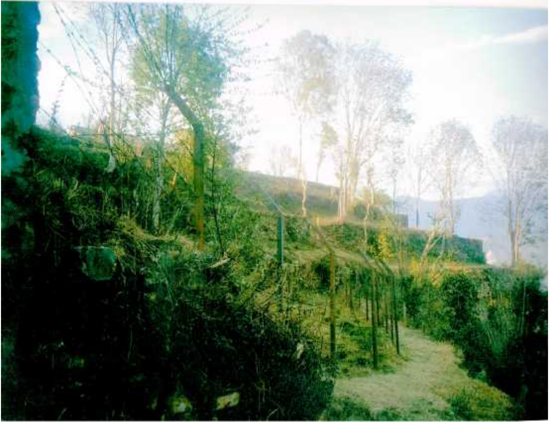
मनाङका भोटेहरूले उठाएको लमजुङ दरवारको ५ तले जग