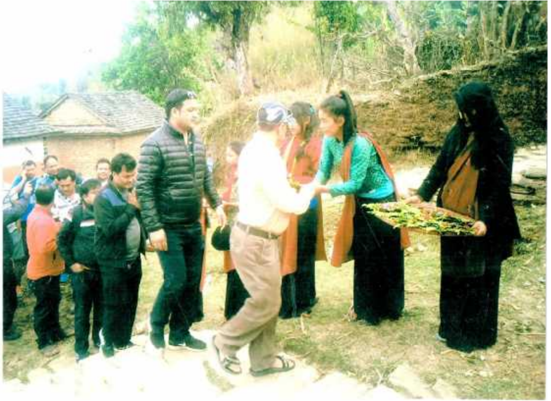
काउलेपानीको मूल प्रवेशद्वारमा पाहुनाहरुको स्वागत गर्दै