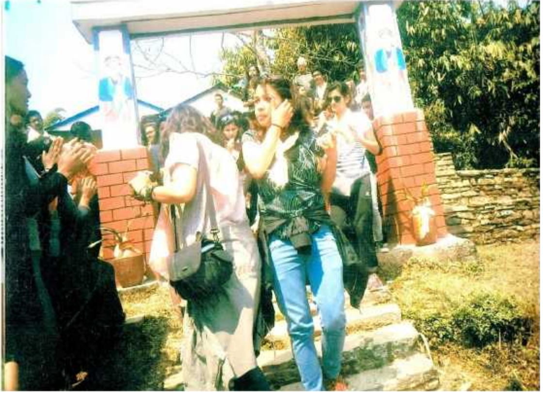
काउलेपानीको मूल प्रवेशद्वारबाट अतिथि बिदाई