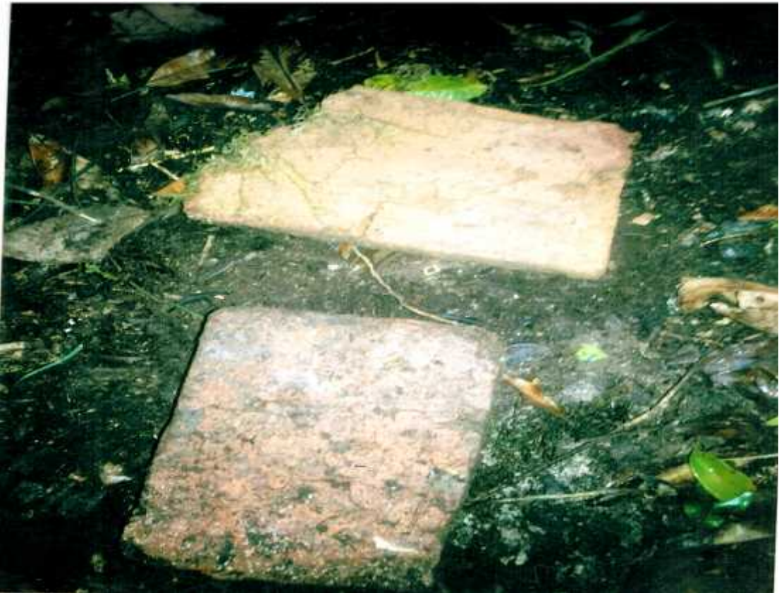
पुरानकोटको भगनावशेषहरुमा भेटाइएको पुरानो इटाका टुक्राहरु