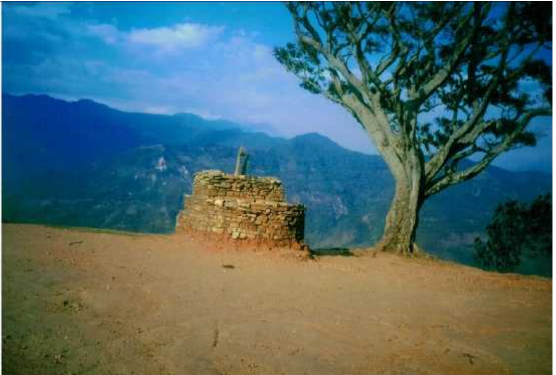
लमजुङ दरवार स्थित चण्डिस्थान