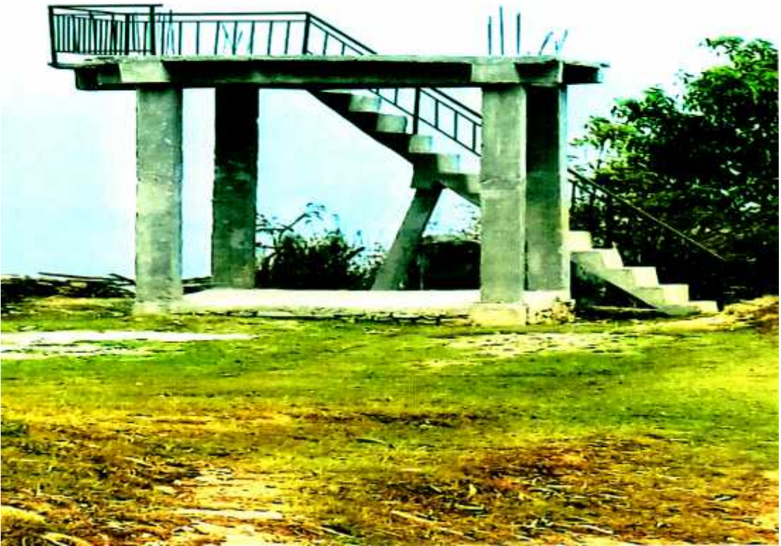
काउलेपानीको भ्यू टावर