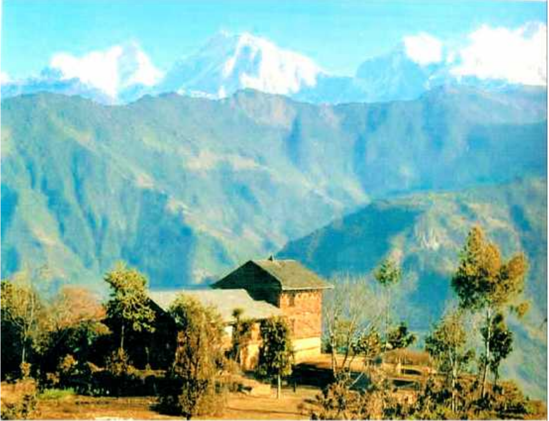
यशोब्रह्म शाहको लमजुङ दरवार र लमजुङ कालिकाको मन्दिर