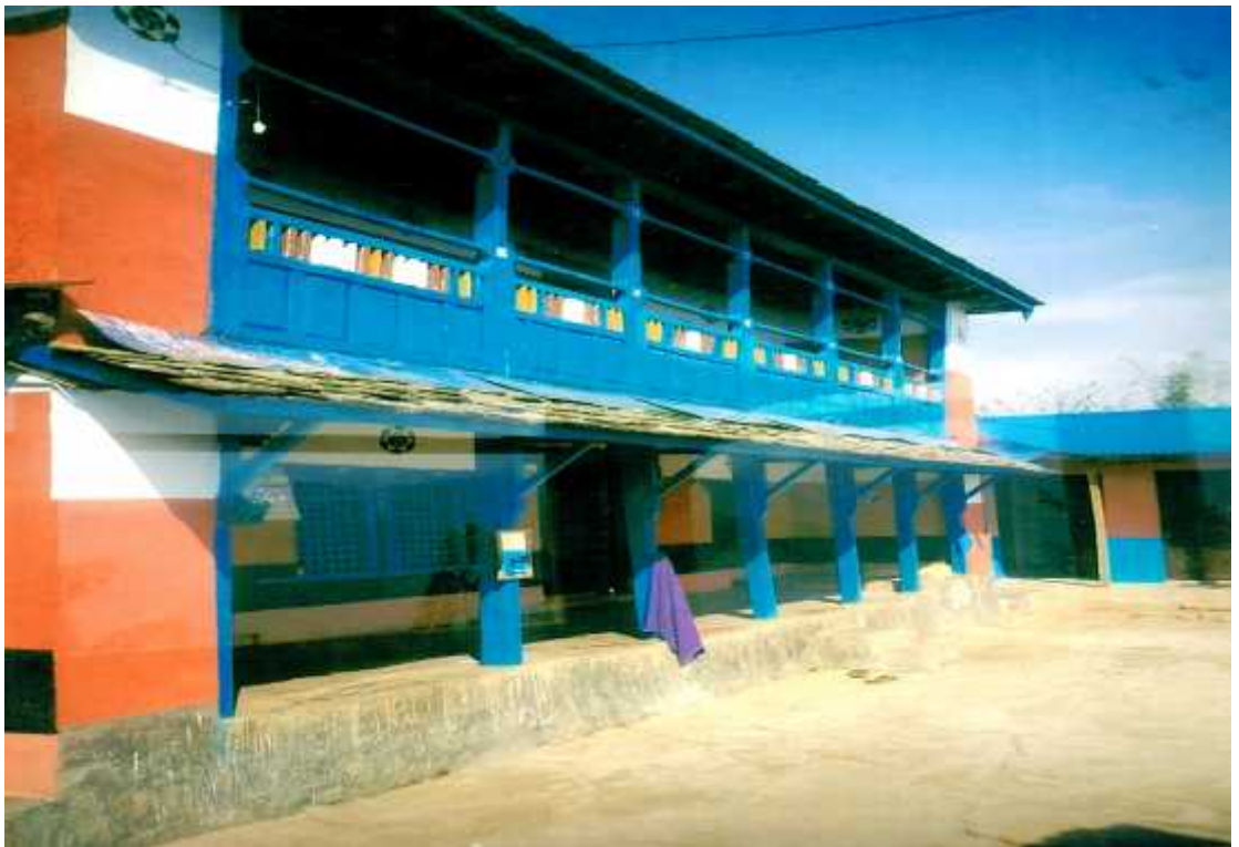
काउलेपानीको होमस्टे घर