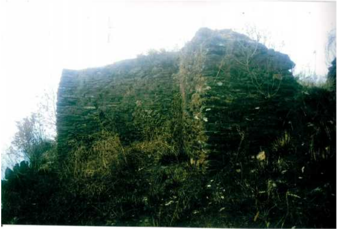
यशुब्रह्म शाहको ग्रिस्मकालिन दरवार तथा पुरानोकोट गढि