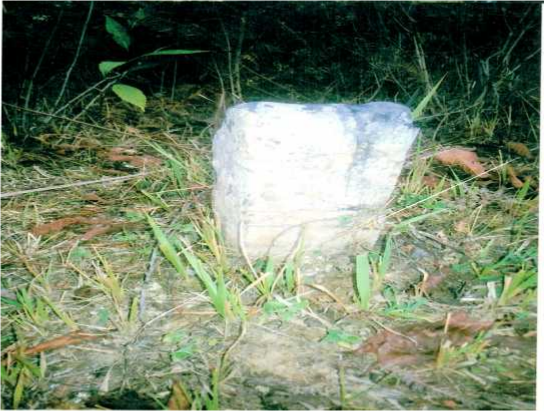
लमजुडे राजाहरुको कुकुर बाँधने दुइगा