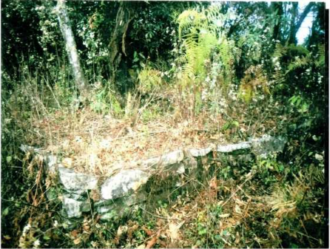
लमजुडे राजाहरुले कोटिहोम गर्ने यज्ञशाला