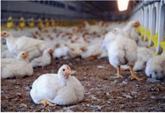
कुखुरा पालन व्यवसाय