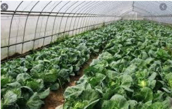
व्यावसायिक तरकारी खेती