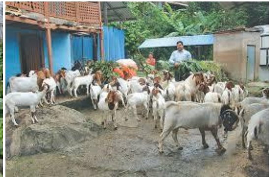
उन्नत जातका बाखा पालन