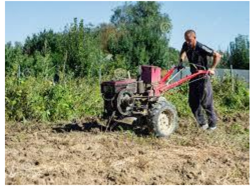
आधुनिक हाते ट्रेक्टरको प्रयोग गर्दै