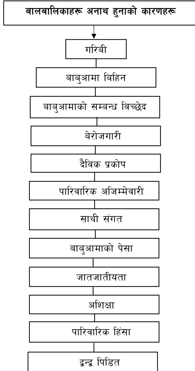
चित्र २.१ अवधारणागत खाँका

यस अध्ययनमा मुख्य रूपमा बालबालिकाहरू अनाथ हुनाको कारणहरूमा गरिबी, बाबुआमा बिहिन, बाबुआमाको सम्बन्ध विच्छेद, पारिवारिक हिंसा, अशिक्षा, बेरोजगारी, जातजातीयता, बाबुआमाको पेसा, साथीसंगत, पारिवारिक बेजिम्मेवारीता, द्वन्द्वपिडित, दैविक प्रकोप जस्ता चरणहरू रहेका छन् । यस्ता संवेगात्मक रूपमा प्रत्यक्ष प्रभाव पारेको पाइन्छ । जसको कारण बालबालिकाहरू अनाथ, बेसहारा भई कुकार्यमा लाग्ने, सडकमा भौतारिने, विभिन्न किसिमका दुर्व्यसनहरूमा फस्ने गरेको पाइन्छ ।