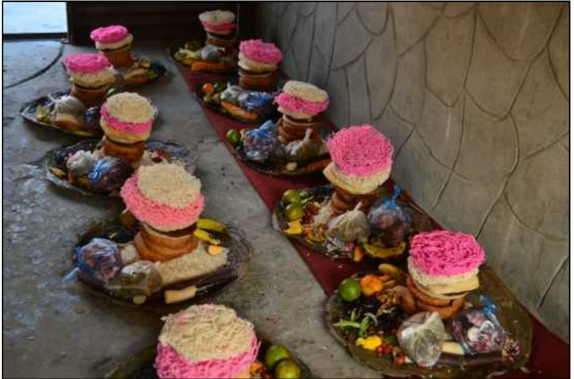
गुठीको वार्षिक भेलामा पालेहरूले ल्याइएको सेलरोटी र अन्य खानेकुराहरू