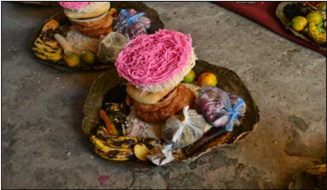
श्री रमा भगवती सिं गुठीको प्रसाद