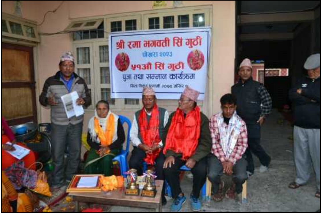
गुठीको वार्षिक भेलामा जेष्ठ नागरिकहरू र पालेलाई सम्मान गर्दै ।