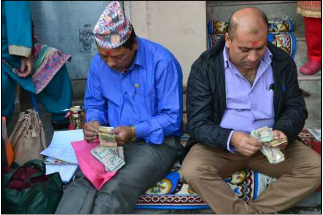
गुठीको वार्षिक भेलामा जम्मा भएको रकम लगानी गर्दै ।