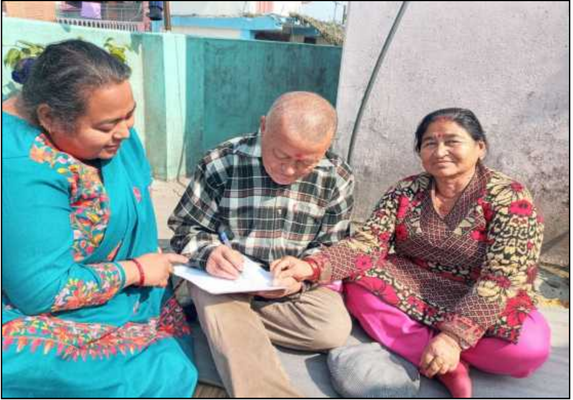
गुठीका गुठियारहरूसँग प्रश्नावलीहरू भराउँदै ।