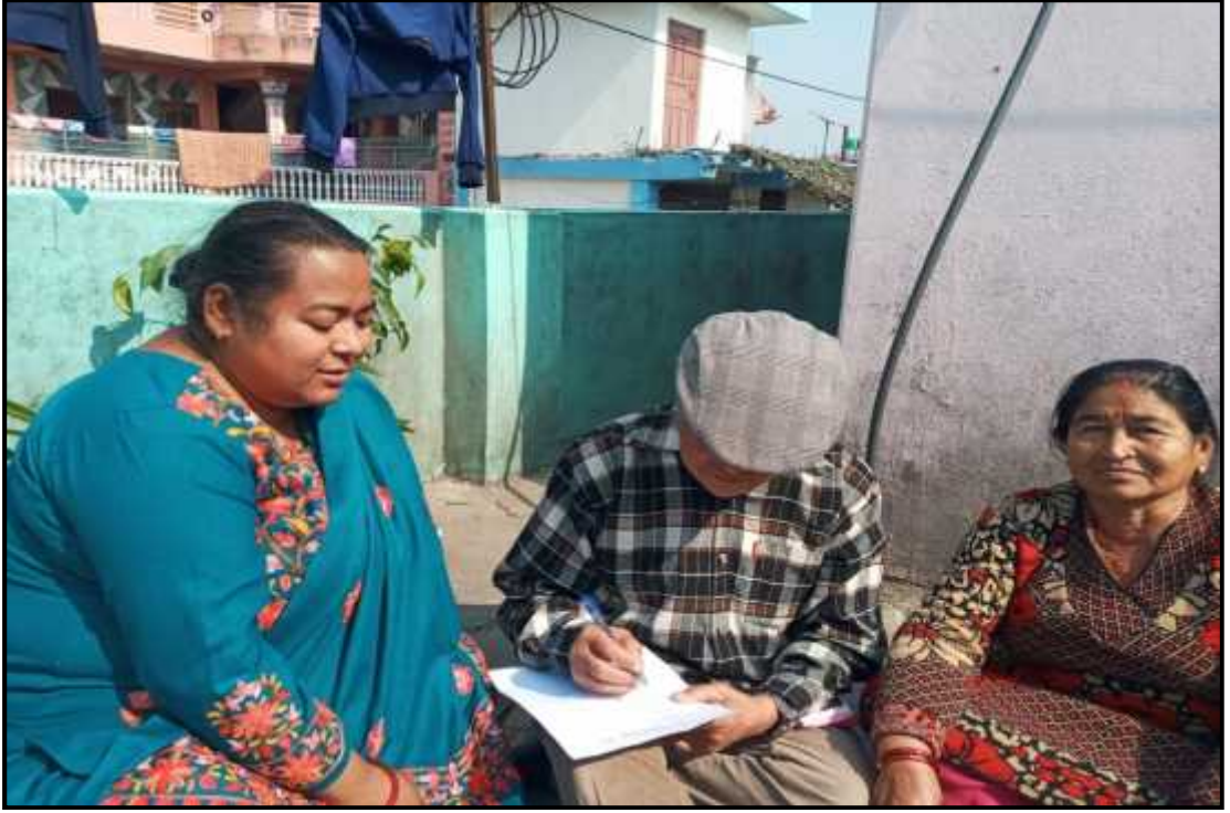
शोधकर्ता उत्तरदातासंग प्रश्नावली सूची भर्न अन्तर्वाता लिदै