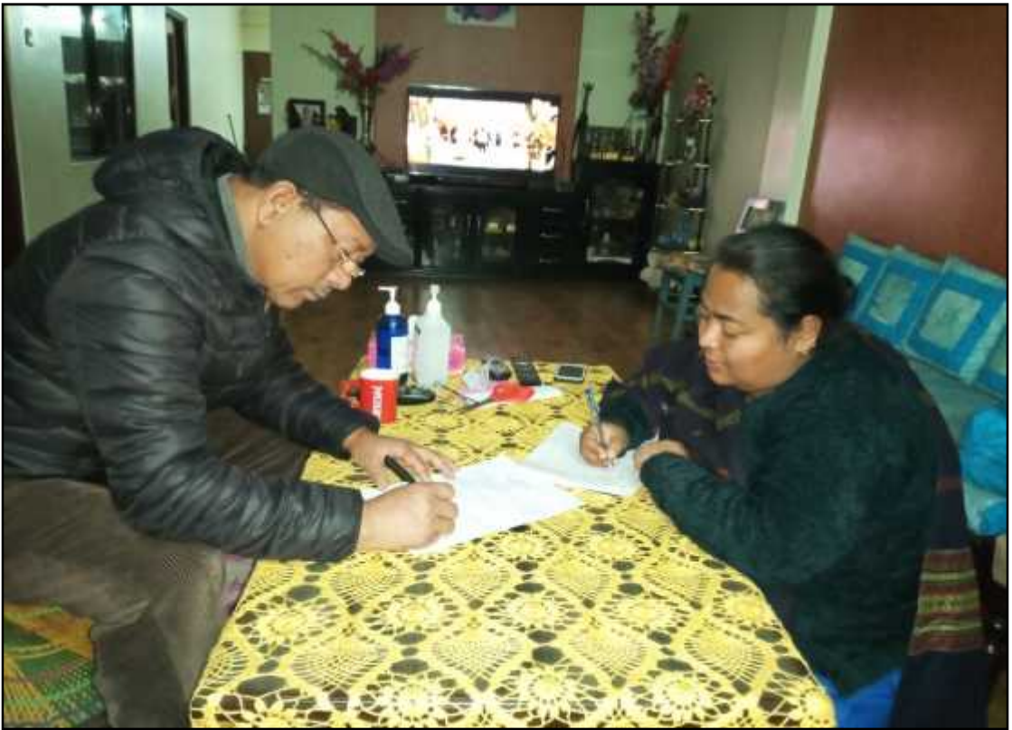
गुठीको वर्तमान नायोसँग अन्तर्वाता लिँदै ।