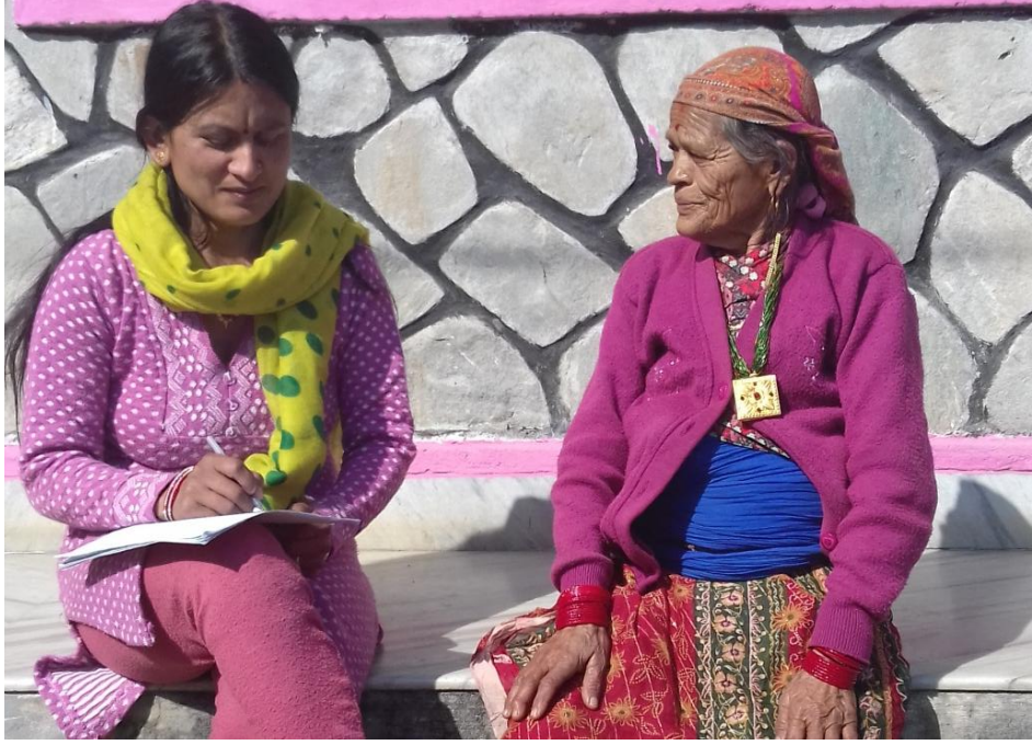
शोधकर्ता उत्तरदातासँग अन्तर्वार्ता लिँदै