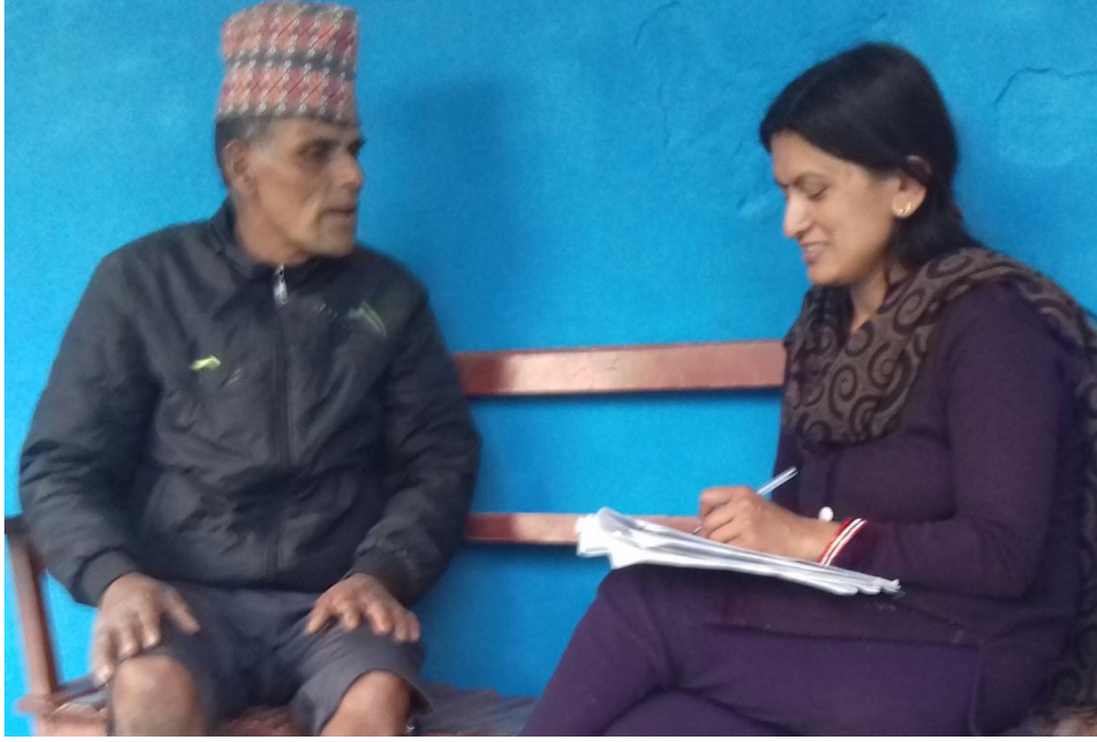
शोधकर्ता उत्तरदातासँग अर्न्तवार्ता लिँदै