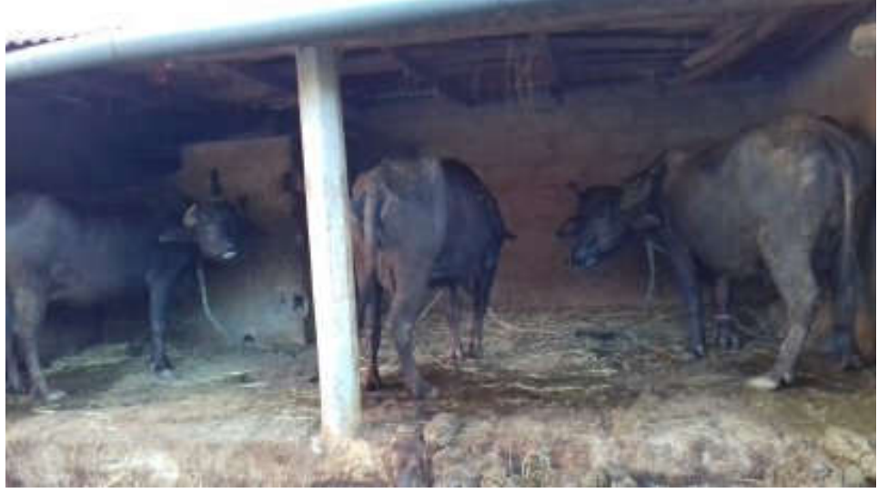
अध्ययन क्षेत्रमा व्यावसायिक रुपमा पालिएका भैंसीहरु ।