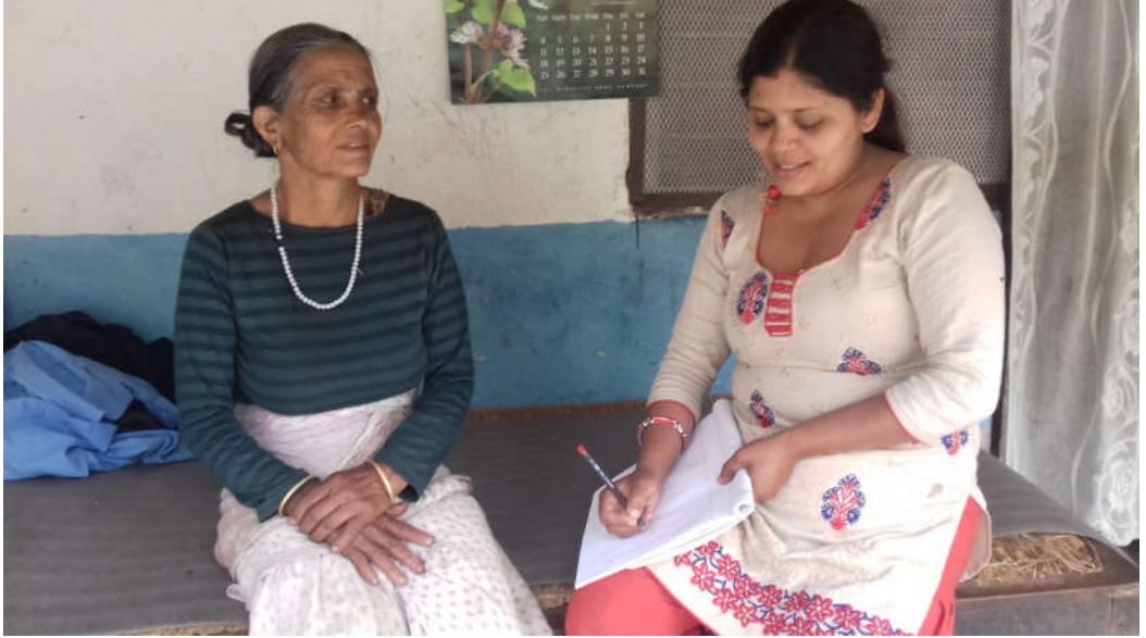
मुख्य जानकार व्यक्तिसँग छलफल गर्दै ।