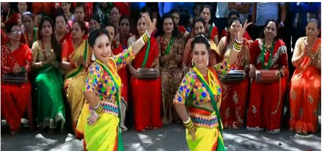
तीजे गीतमा नाचगान गर्दै