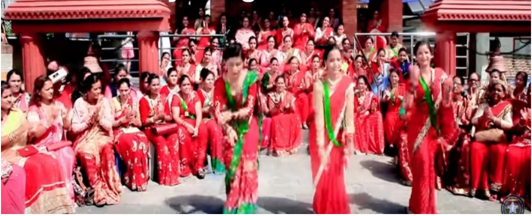
तीज पर्वको नाचगानका केही भलकहरू