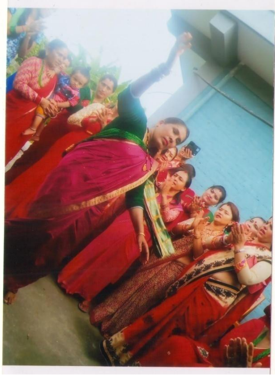
हरितालिका तीजमा नाचगान गर्दै