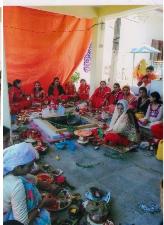
ऋषि पञ्चमीमा पूजा गर्दै