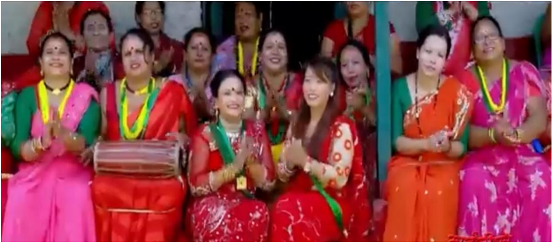
तीजे गीत गाएका केही भलकहरू