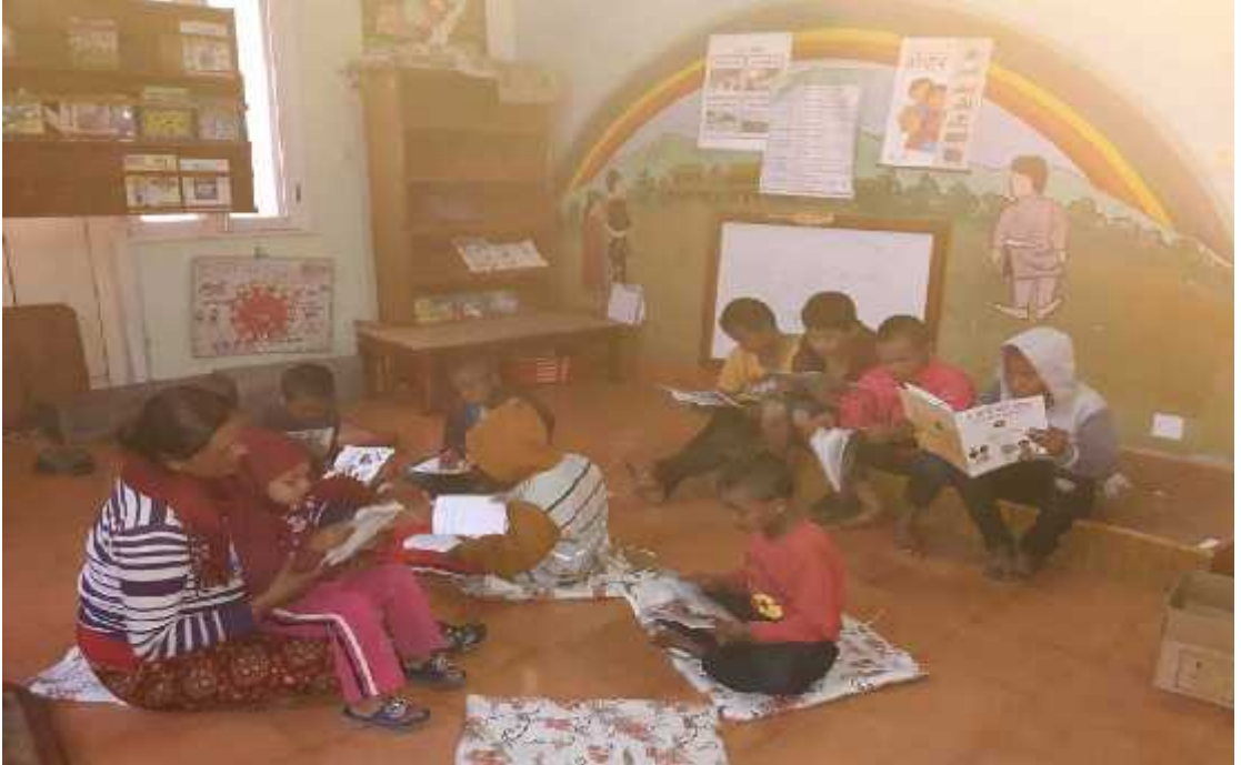
कक्षा १ देखि ४ सम्मका उत्तरदाताहरुलाई शिक्षीकाले पढ्न सहयोग गर्दै