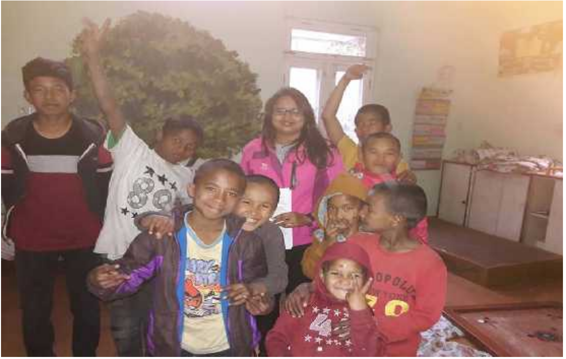
उत्तरदाताहरूसँग लिएको तस्विर