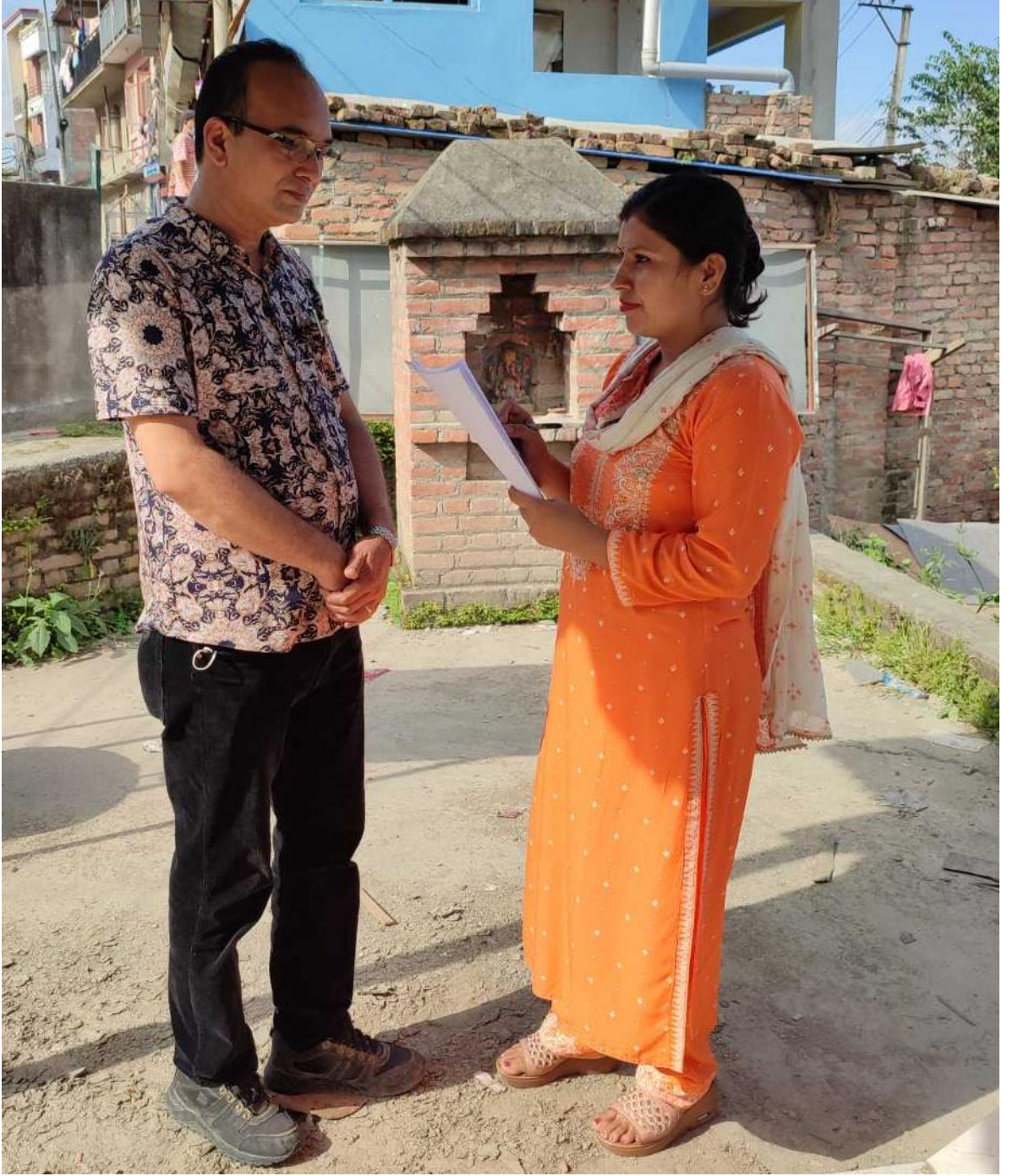
शोधनायकसँग अन्तर्वार्ता लिँदै