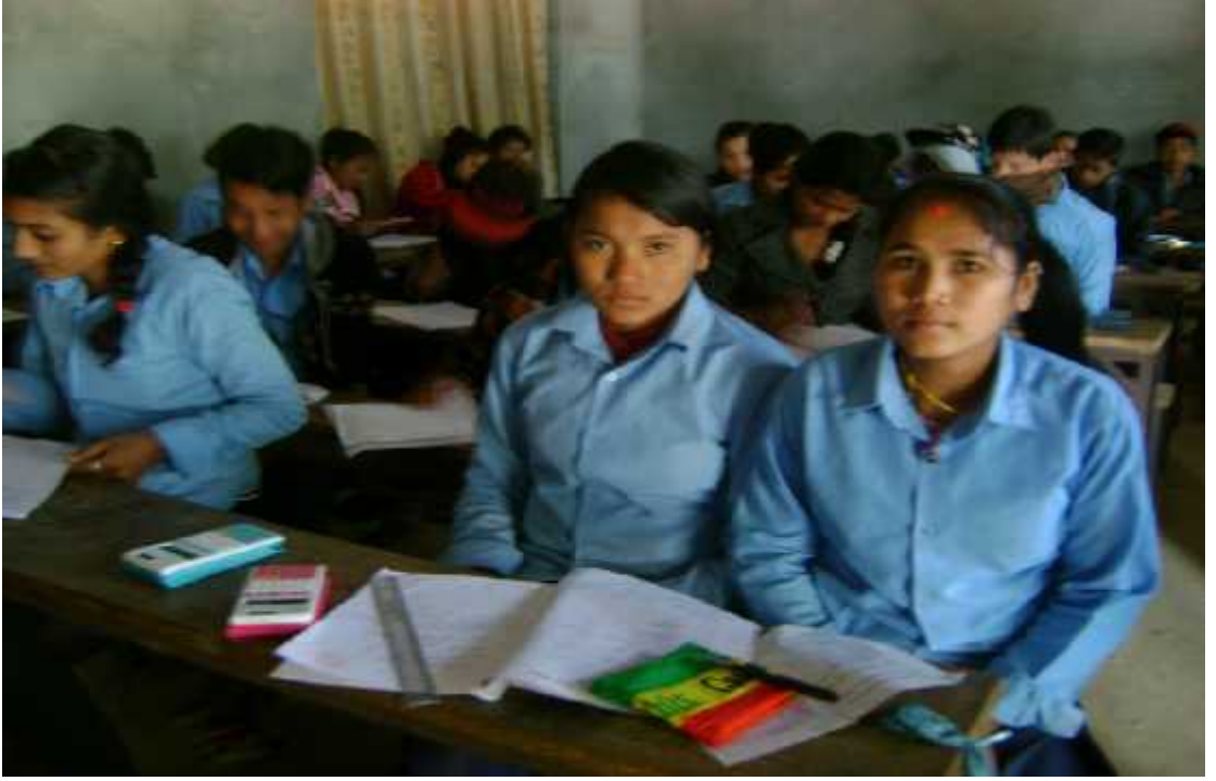
कक्षा सातका विद्यार्थीहरु