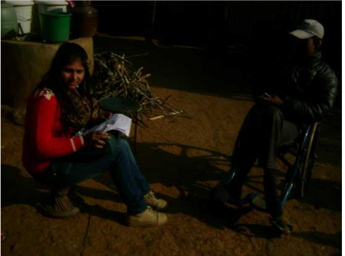
उत्तरदातासँग अन्तरवार्ता लिँदै