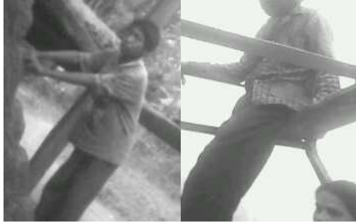
तुइनतारदै वोटे जातिकायुवकहरू ।