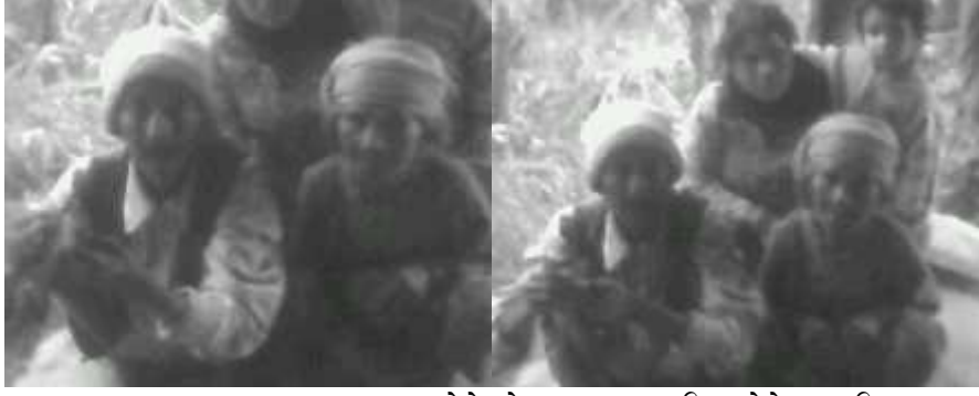
वोटे भेषभूषामास्थानियवोटे दम्पति साथमाशोधकर्ता