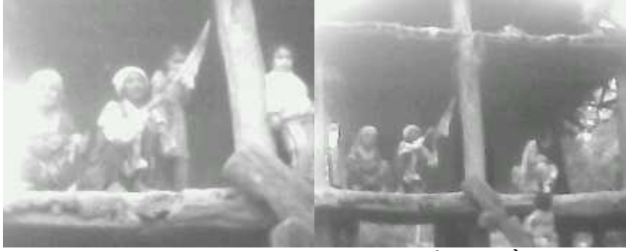
माछामार्ने जालबुन्दै गरेकावोटे जातिहरू ।