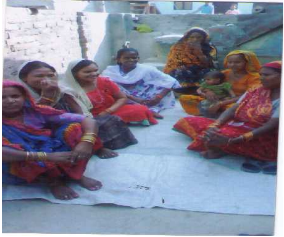
चिडिमर जातिका महिला समुहमा छलफल गर्दै