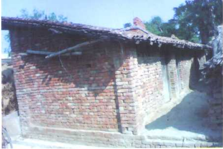
चिडिमर जातीको खपराले छाएको घर