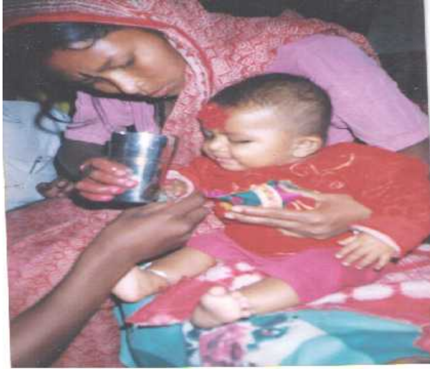
चिडिमार जातिको जन्मसस्कार मनाउदै गरेको एक भलक