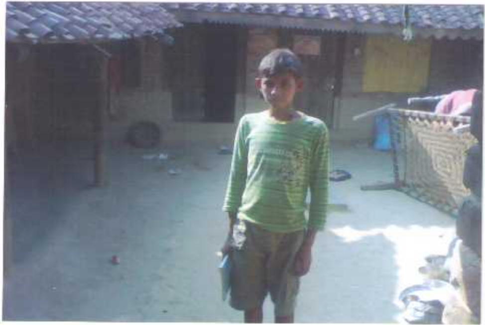
चिडिमर जातीमा स्कुल जाँदै गरेको बालक