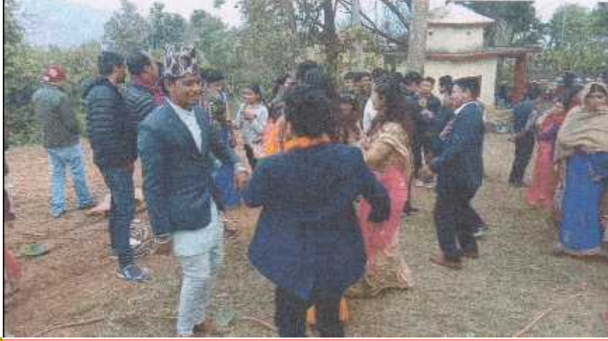
मिति २०७५ माघ १० गते, कालीगण्डकी -६, इमसिल, देउरालीमा पञ्चेबाजा लोकगीत

Formatted: Font: Preeti, 16 pt, Bold, Font color: Text 1