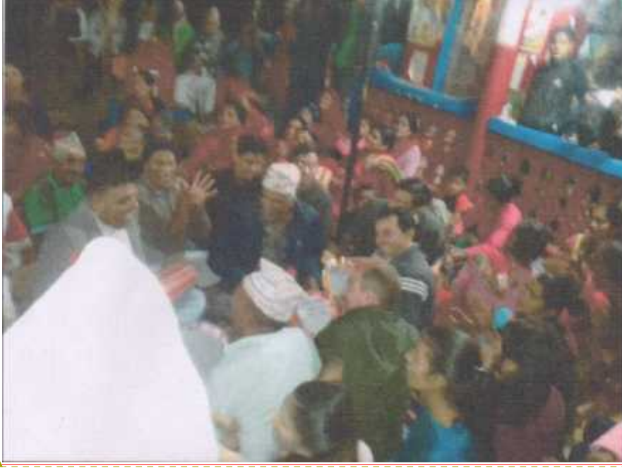
मिति २०७५ आश्विन ३१ गते, कालिगण्डकी -५, ताँपमा गाइएको लोकभजन

Formatted: Font: Preeti, 16 pt, Bold, Font color: Text 1