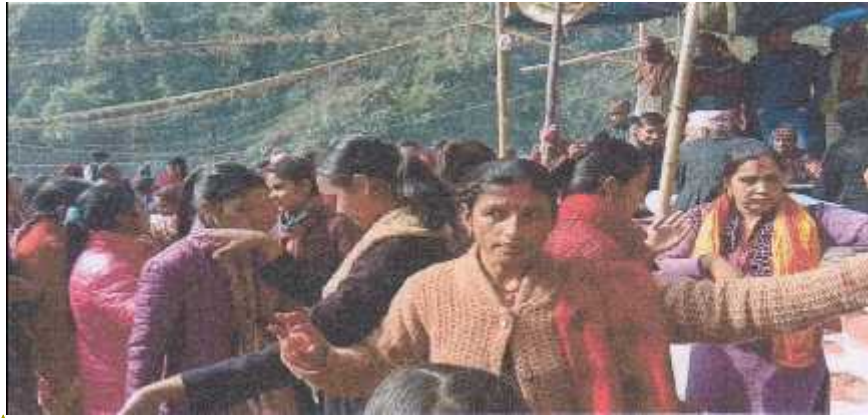
मिति २०७५ फाल्गुण २० गते, कालिगण्डकी -७, मिर्मीमा गाइएको ख्याली गीत

Formatted: Font: Preeti, 16 pt, Bold, Font color: Text 1