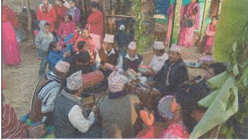
मिति २०७५ माघ २७ गते, कालिगण्डकी -५, नयाँमिलमा गाइएको हरेराम भाकामा

Formatted: Font: Preeti, 16 pt, Bold, Font color: Text 1