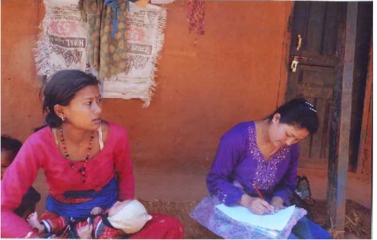
घरधुरी सर्वेक्षण गर्दा प्रशनावली भर्न लाग्दाको तस्वीर