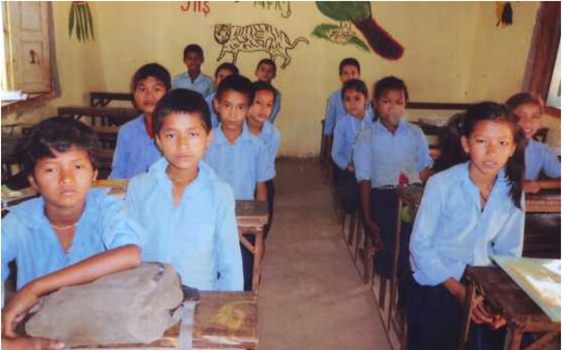
श्री गायत्रीदेवी प्रा.वि. मा कक्षा ५ मा अध्ययनरत विद्यार्थीहरुमा लक्षित समूह छलफल गर्दाको तस्वीर