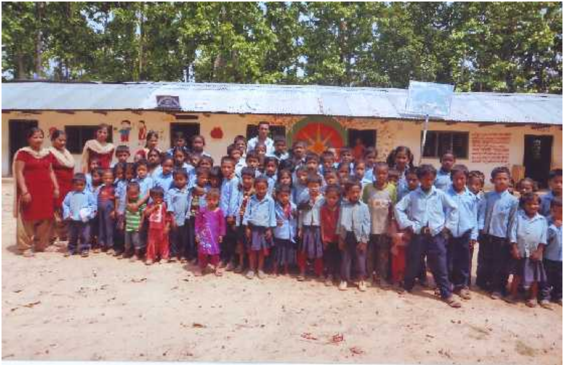
श्री गायत्रीदेवी प्रा.वि.मा अध्ययनरत विद्यार्थी र शिक्षकहरुको तस्वीर