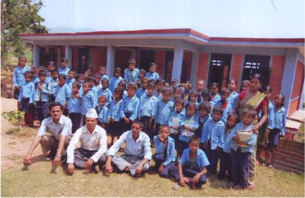
श्री रत्नदेवी प्रा.वि. मा अध्ययनरत विद्यार्थी र शिक्षकहरुको तस्वीर