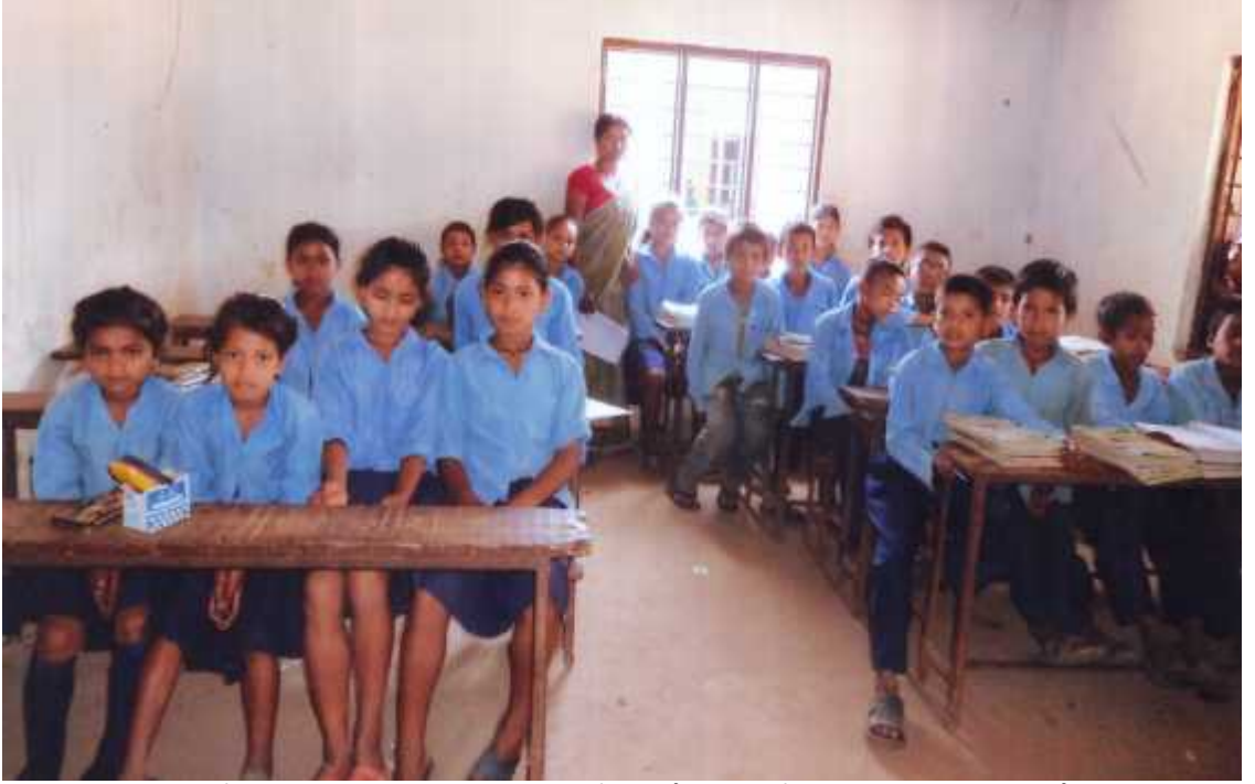
श्री रत्नदेवी प्रा.वि. मा कक्षा ५ मा अध्ययनरत विद्यार्थीहरुमा लक्षित समूह छलफल गर्दाको तस्वीर