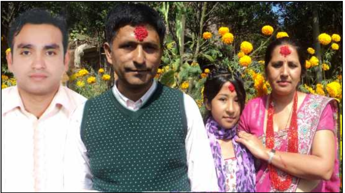
शोधनायकका परिवारका साथमा शोधार्थी