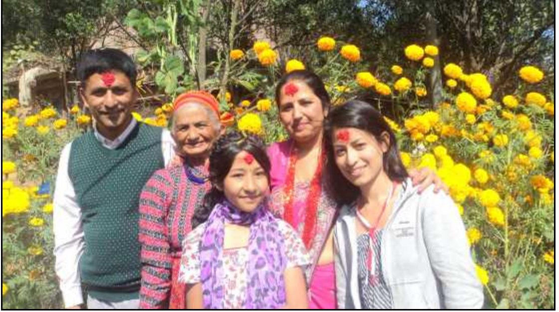
शोधनायक परिवारका साथमा