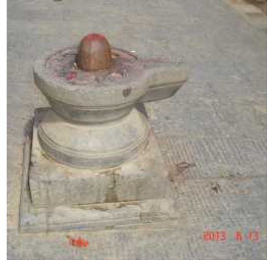
चित्र सङ्ख्या ७ : सादा शिवलिङ्गहरु