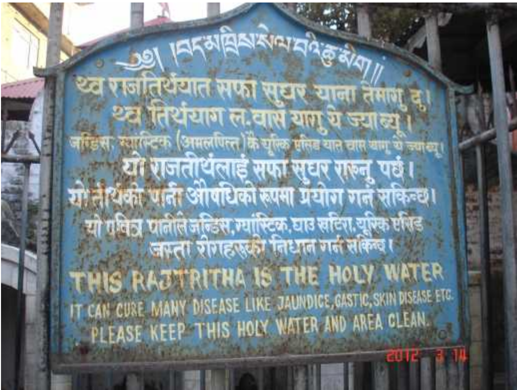
चित्र सङ्ख्या १८: राजतीर्थमा रहेको सूचना