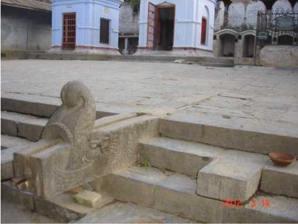
चित्र सङ्ख्या १७: राजतीर्थमा रहेको ढुङ्गेधारा