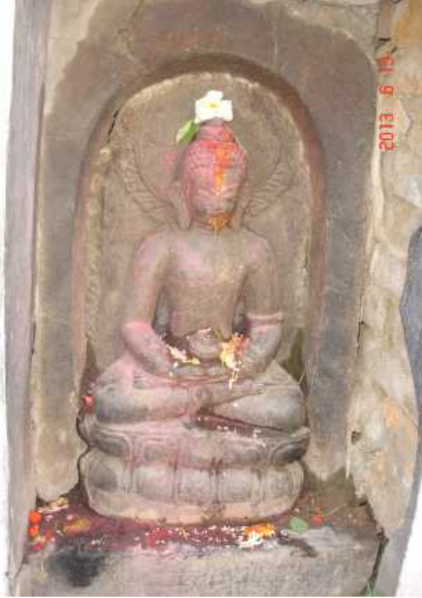
चित्र सङ्ख्या ८ : शाक्यमुनि गौतम बुद्ध