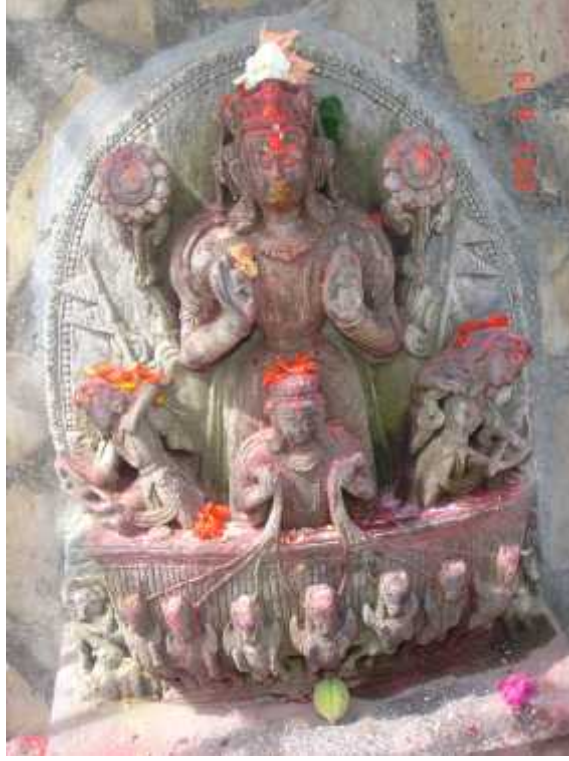
चित्र सङ्ख्या ३: सूर्यमूर्ति