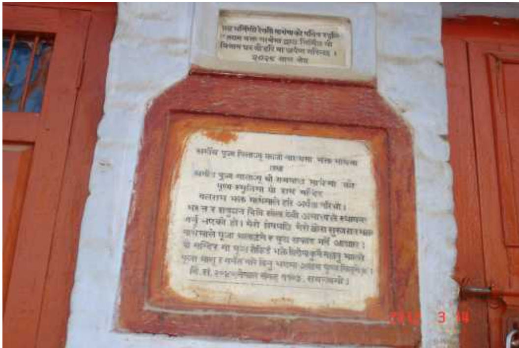
चित्र सङ्ख्या १३: मन्दिर स्थापना सम्बन्धी शिलालेखा