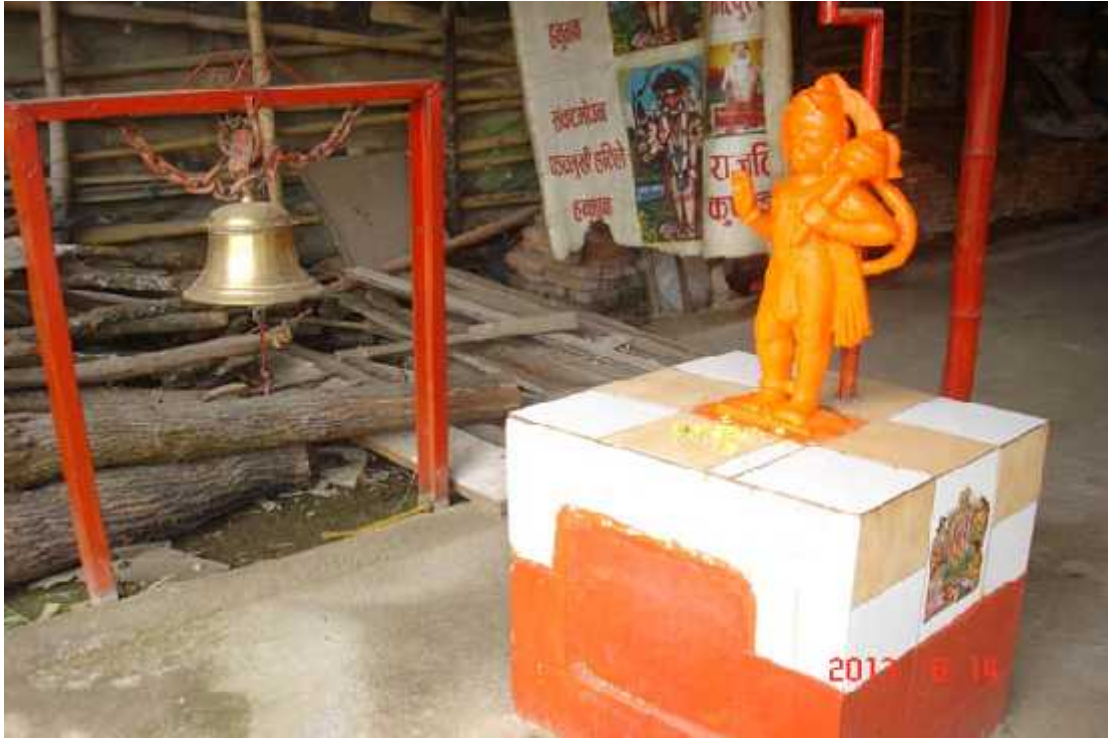
चित्र सङ्ख्या ९ : हनुमान मूर्ति