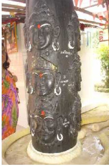
चित्र सङ्ख्या ५: द्वादश ज्योर्तिलिङ्ग