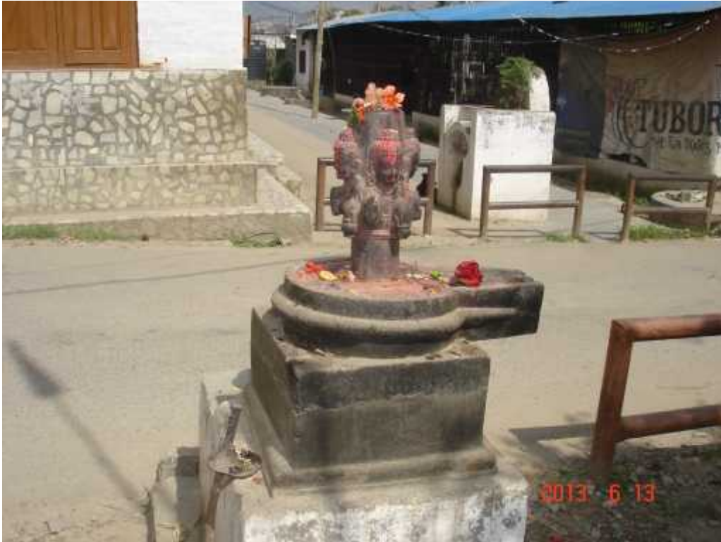
चित्र सङ्ख्या ६: पञ्चमुख शिवलिङ्ग