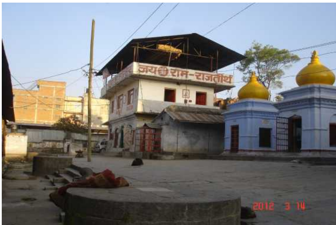
चित्र सङ्ख्या १: राजतीर्थ