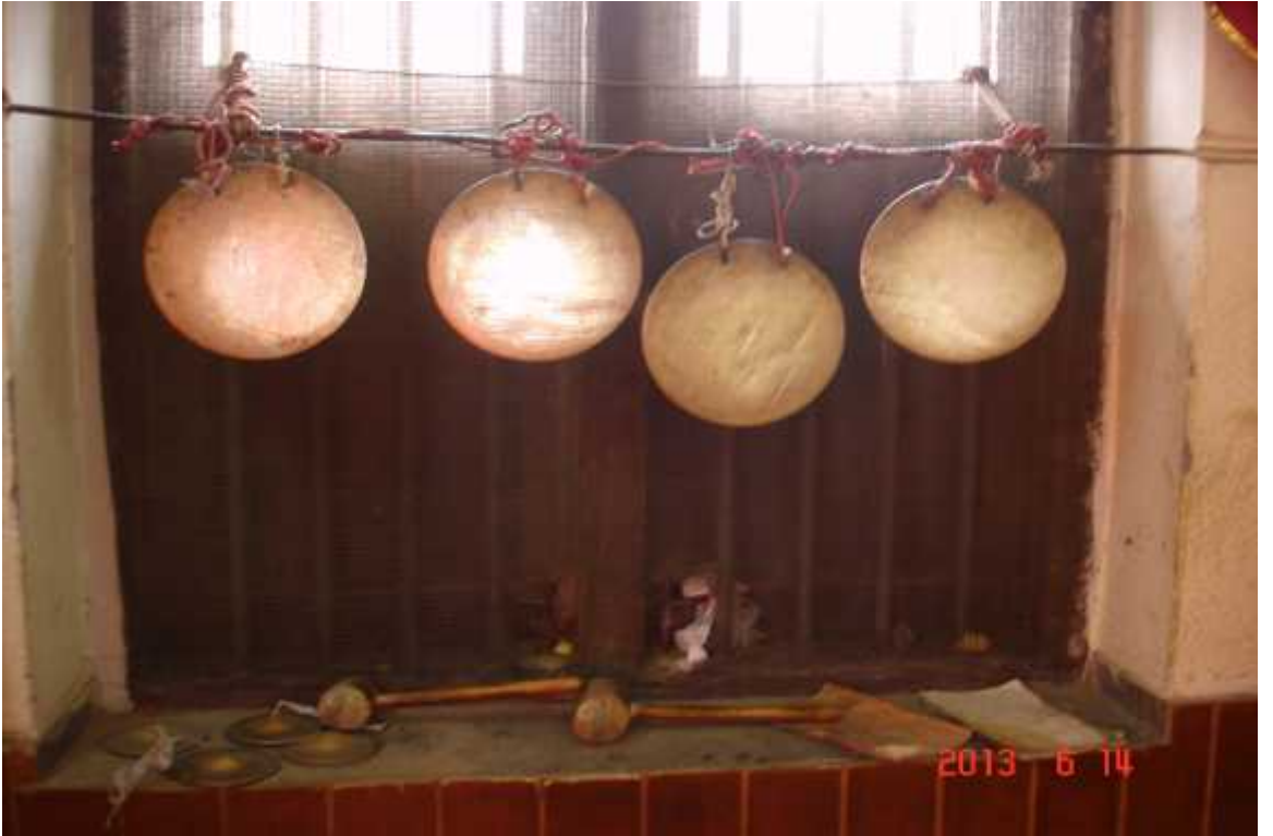
चित्र सङ्ख्या २०: भजन कीर्तनमा प्रयोग गरिने बाजाहरु ।