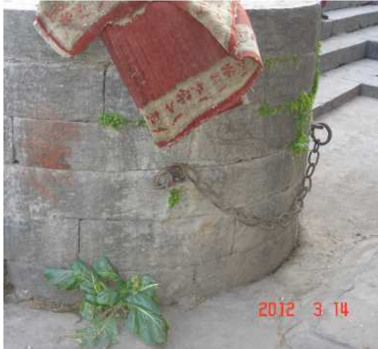
चित्र सङ्ख्या १२: नदी तटको भकारी र फलामे साङ्लो