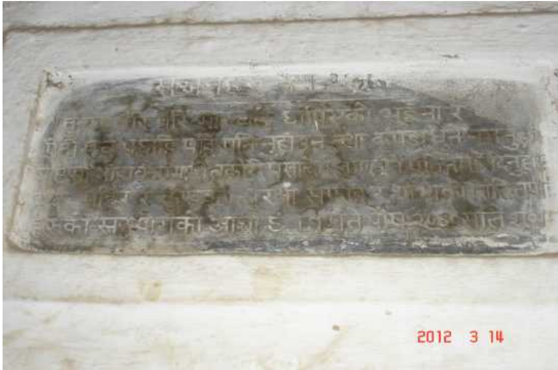
चित्र सङ्ख्या १५: राजतीर्थको महत्व सम्बन्धी लेख (ख)