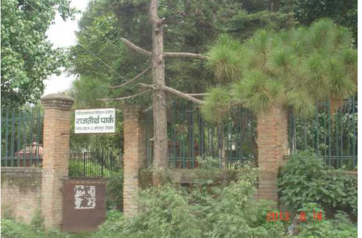
चित्र सङ्ख्या २४: राजतीर्थ पार्क