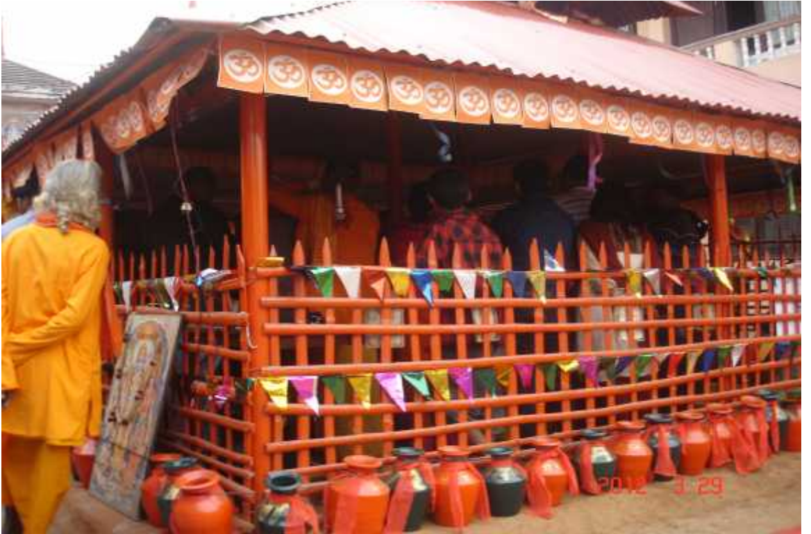
चित्र सङ्ख्या २२: राममन्दिरमा ल्याइएका १०८ घडा ।