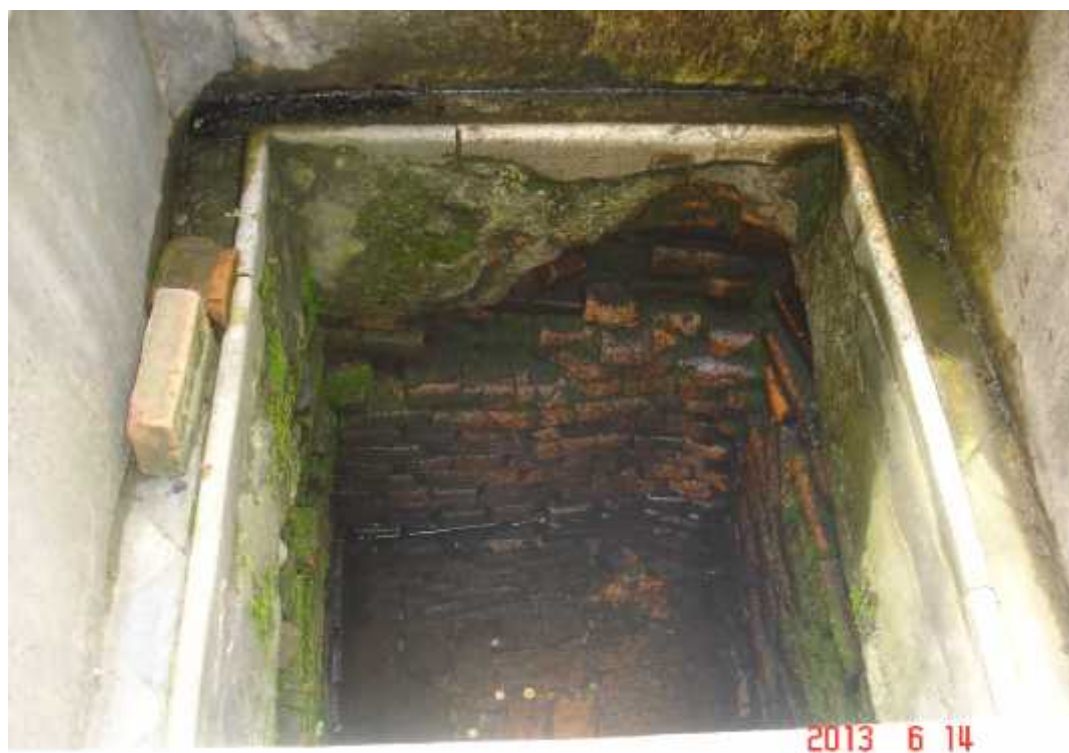
चित्र सङ्ख्या २: राजतीर्थमा रहेको कुवा ।