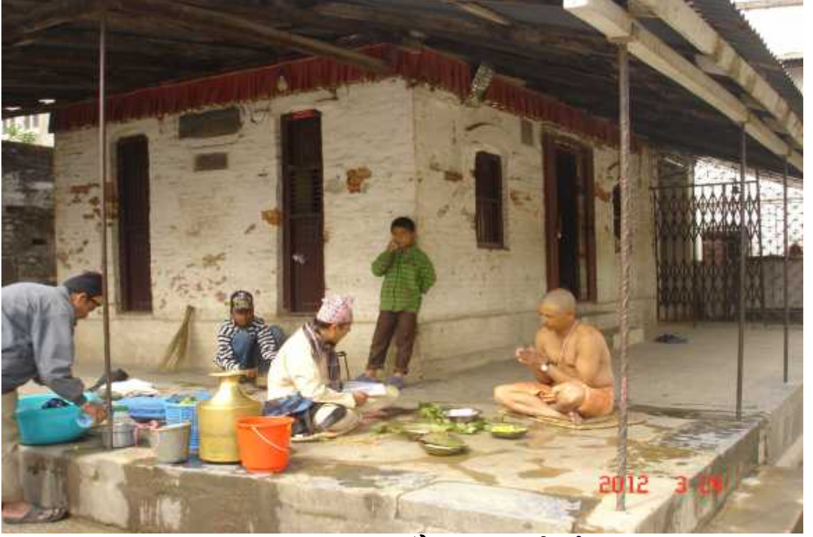
चित्र सङ्ख्या २१: श्राद्ध गराउँदै ब्राह्मण र तिर्थालु ।