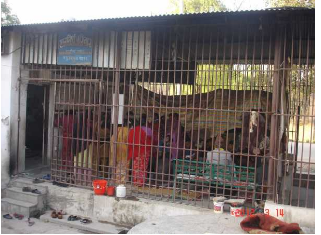
चित्र सङ्ख्या १९: भजन कीर्तन तथा पूजाआजा गर्ने पाटी ।