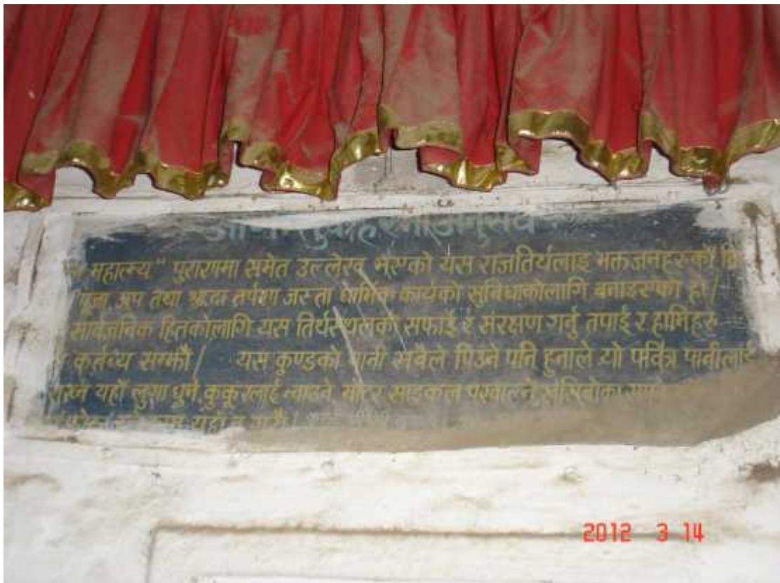
चित्र सङ्ख्या १४: राजतीर्थको महत्व सम्बन्धी लेख (क)