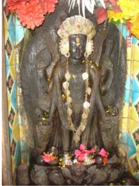
चित्र सङ्ख्या ४: नारायणको मूर्ति