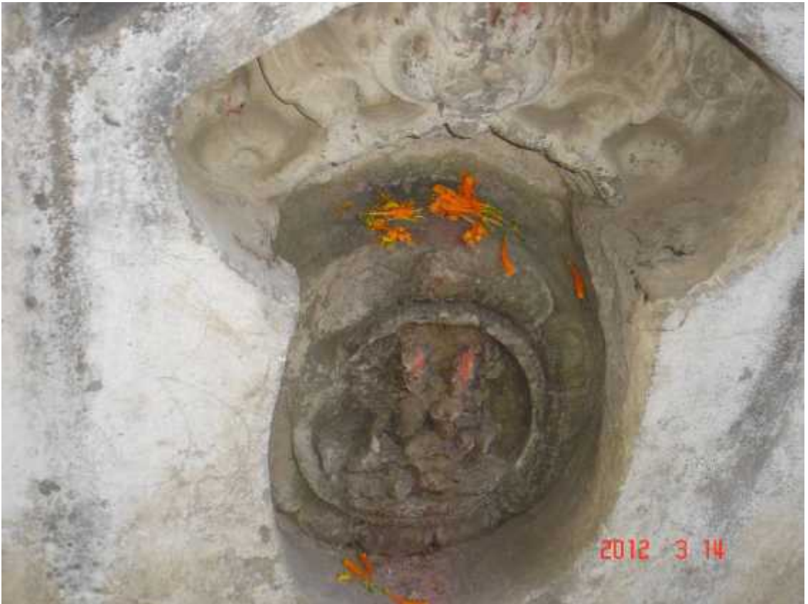
चित्र सङ्ख्या १० : उमा महेश्वरको मूर्ति