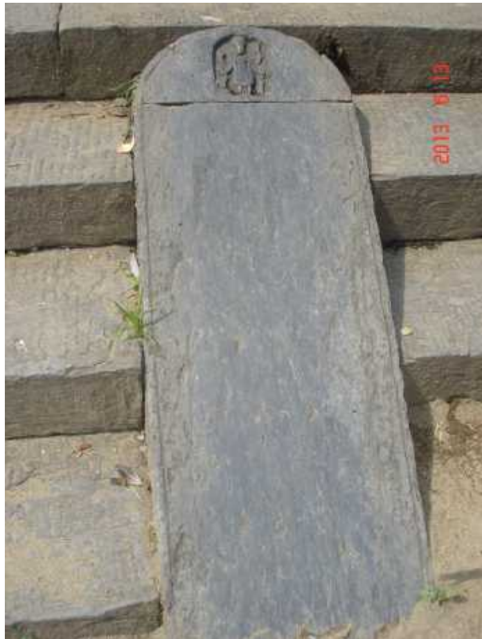
चित्र सङ्ख्या १६: ब्रम्हनाल