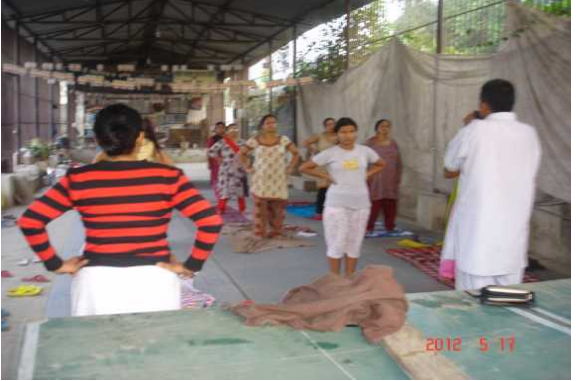
चित्र सङ्ख्या २३: राजतीर्थमा प्रातकालिन योग अभ्यास ।