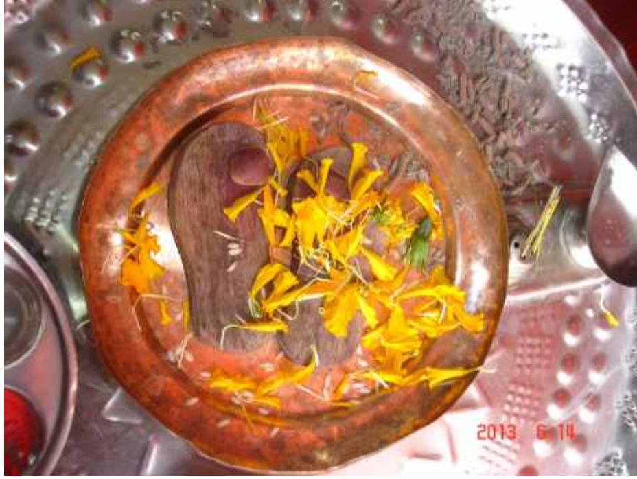
चित्र सङ्ख्या ११ : राजतीर्थमा संरक्षित काठका खराउ