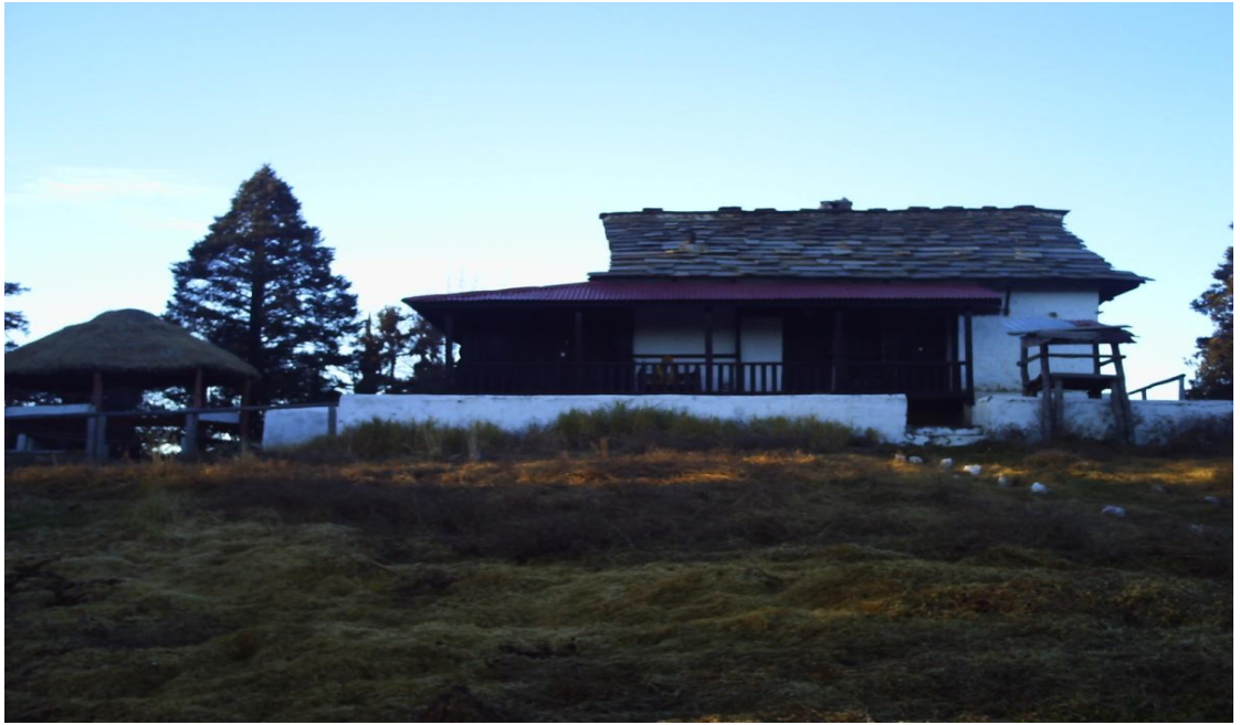
(खप्तडबाबा, खप्तड आश्रम र कुटीभिन्नका सामाग्री)