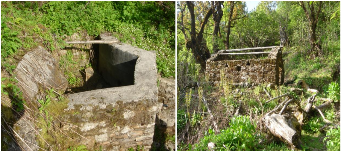
(जनराज भोजराजको महल डाँफेकोट मानिएको क्षेत्र)