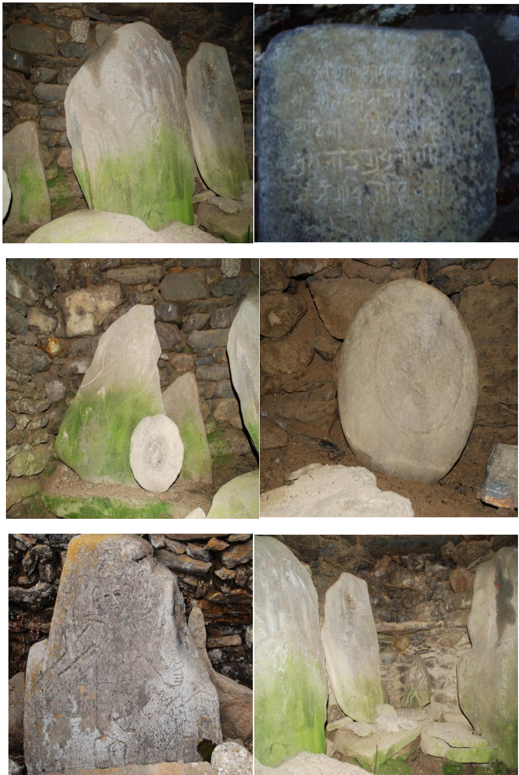
(त्रिवेणीको प्राचीन मन्दिरभित्रको प्रस्तर चित्रकला एवं शिलाभिलेख)