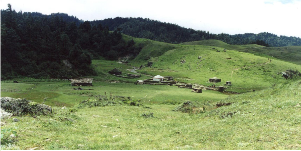
(खप्तडको भल्को दिने त्रिवेणी पाटनसहित एक दृश्य)