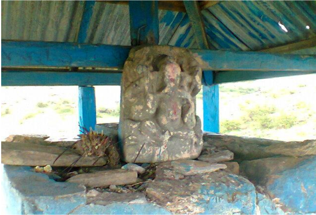
(गणेश पाटनमा अवस्थित गणेश मूर्ति)