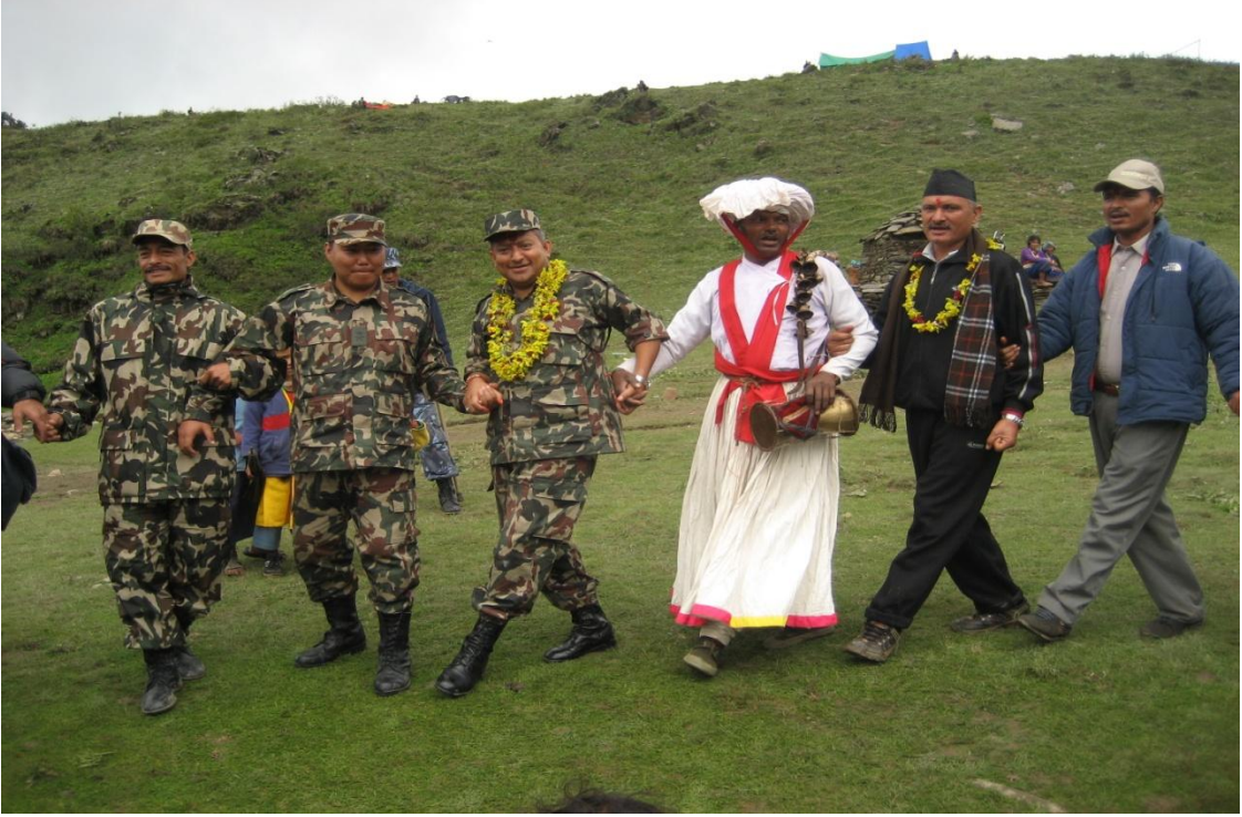
(खप्तडमा देउडा/न्याउल्या खेलै)