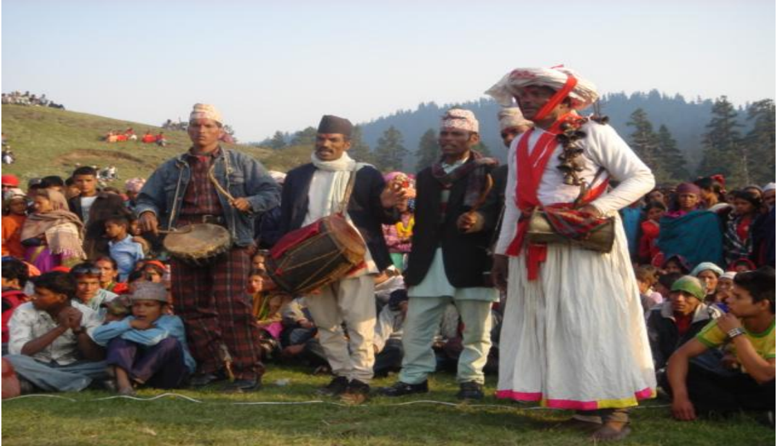
(खप्तडमा हुड्क्यौली गर्दै हुड्के गम्भीरमान नेपाली)