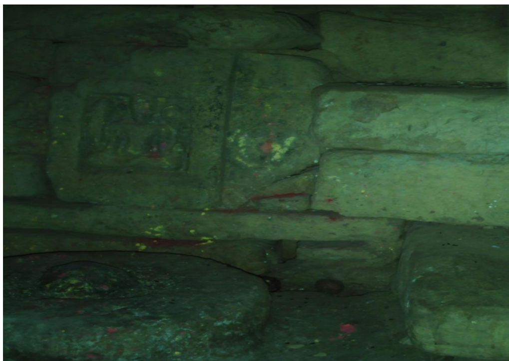
(खापरमाडौंको गवीरभिन्न रहेको प्रस्तर कला)