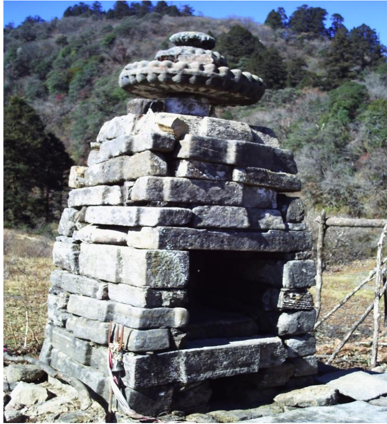
(खापरमाडौं नजिक रहेको मल्लकालिन शैलीको एक देवल)