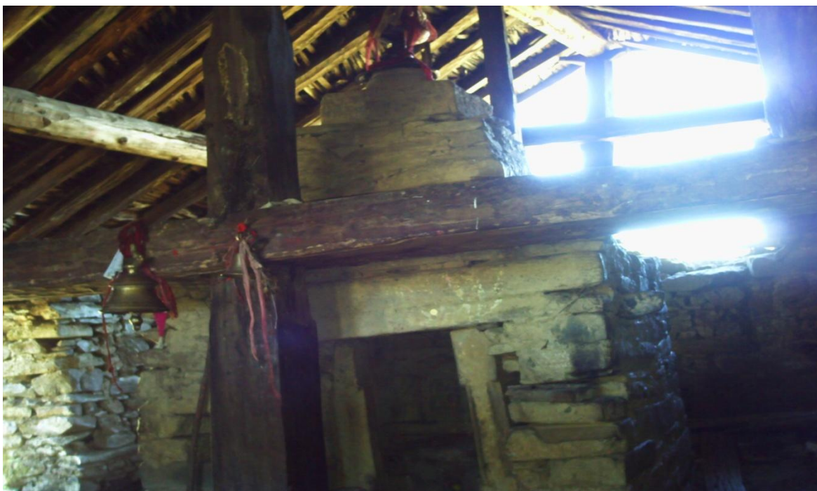
(दह खप्तडमा अवस्थित गवीरसहितको खापरमाडौं)