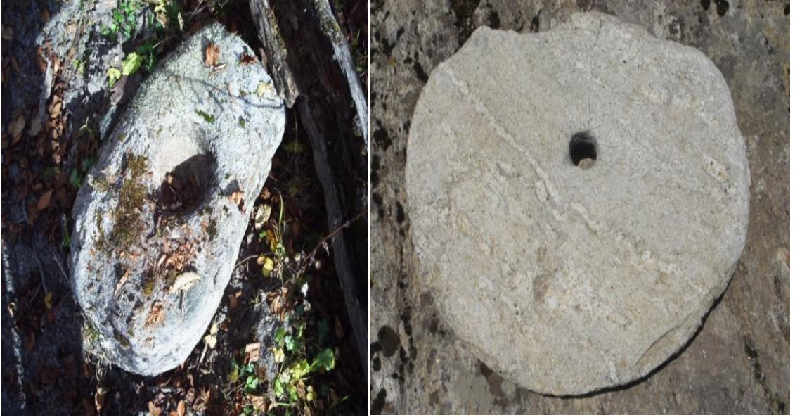
(खप्तड क्षेत्रमा पाइएका ओखल र जुतारो)