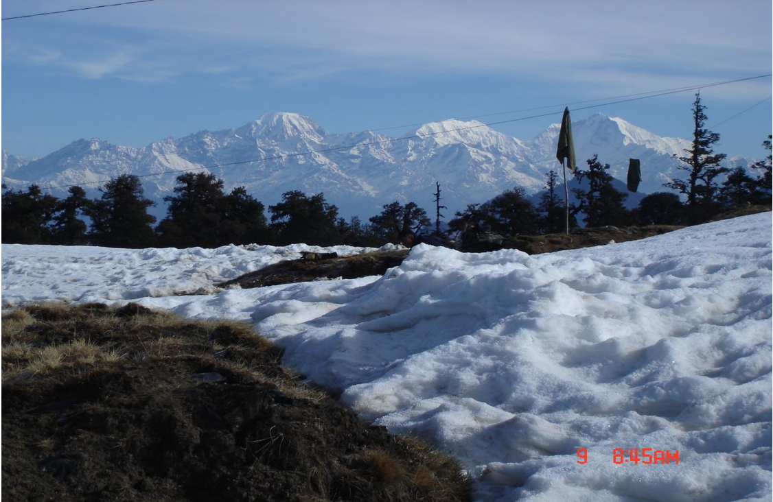
(शिशिर ऋतुको हिउँमय खप्तड)