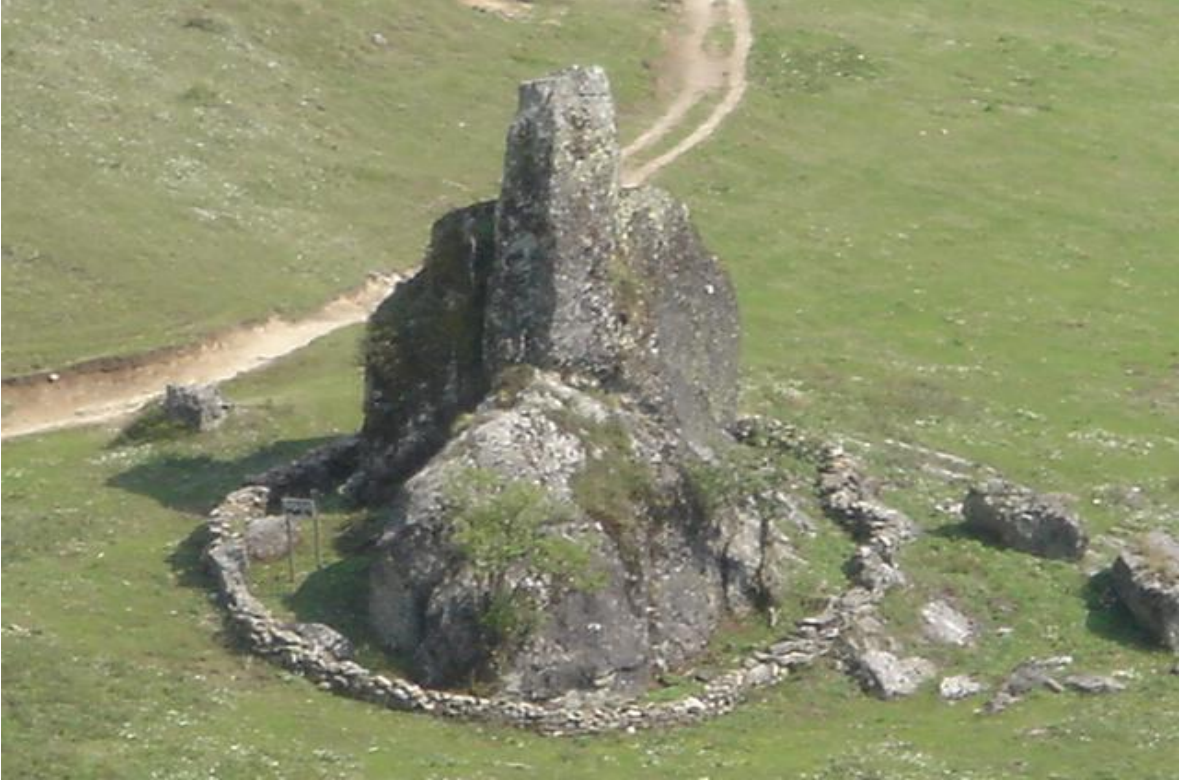
(खप्तडमा अवस्थित केदारहुंगा)