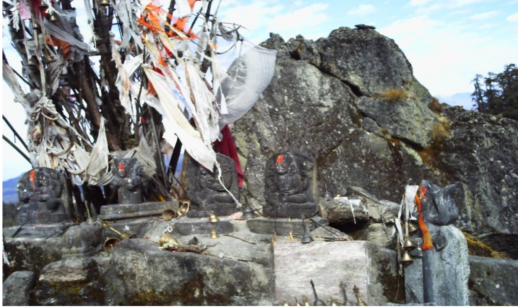
(खप्तड क्षेत्रको सबैभन्दा बढी उचाईमा अवस्थित सहस्रलिङ्ग)