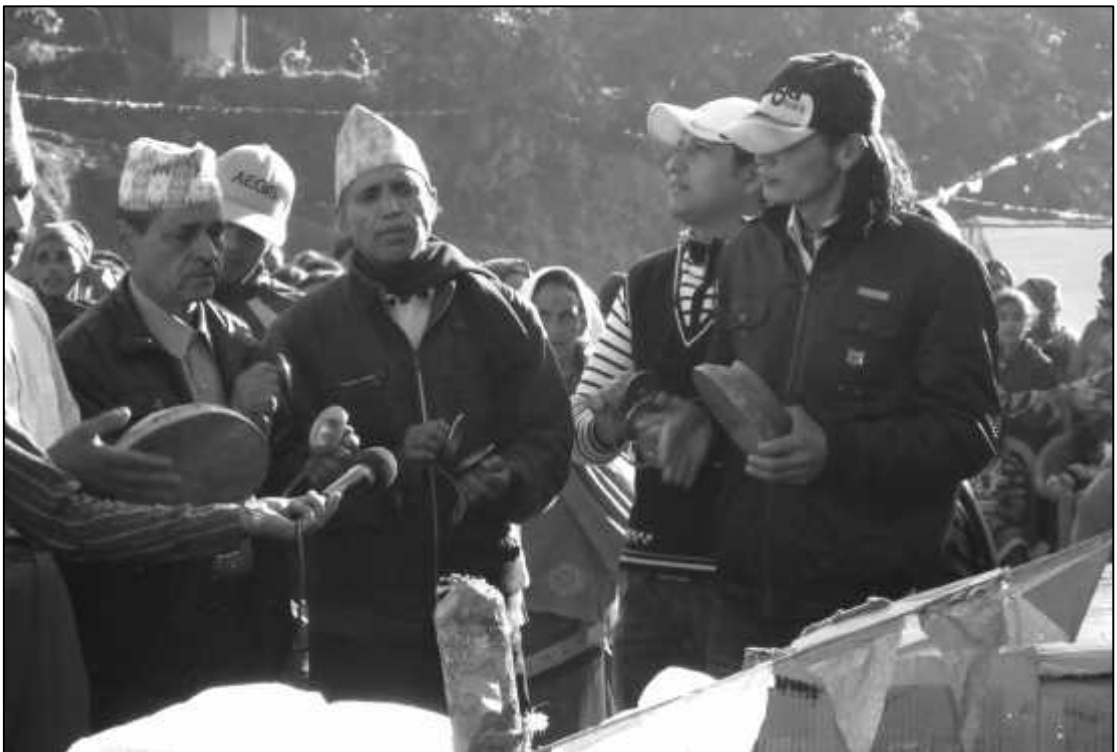
भदौरे देउरालीस्थित बहादुरे उच्च मा.वि. भवन उद्घाटनको अवसरमा भजन प्रस्तुत गर्दै स्थानीय बीसन्दा ।