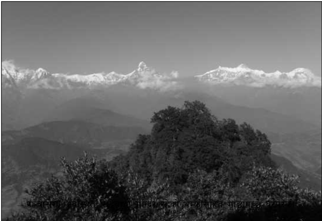
पञ्चासवा अवस्थित सिद्धवाबा मन्दिर रहेको थुम्कोसहित सालापुच्छे वरपरको