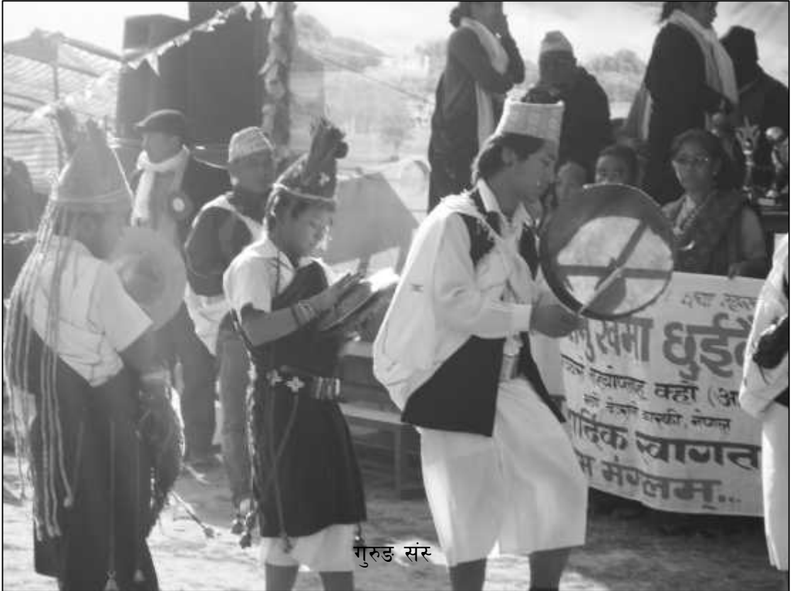
कृति अन्तर्गत भाँक्री नाच तथा भाकी प्रस्तुत गर्दै स्थानीय बासिन्दा ।