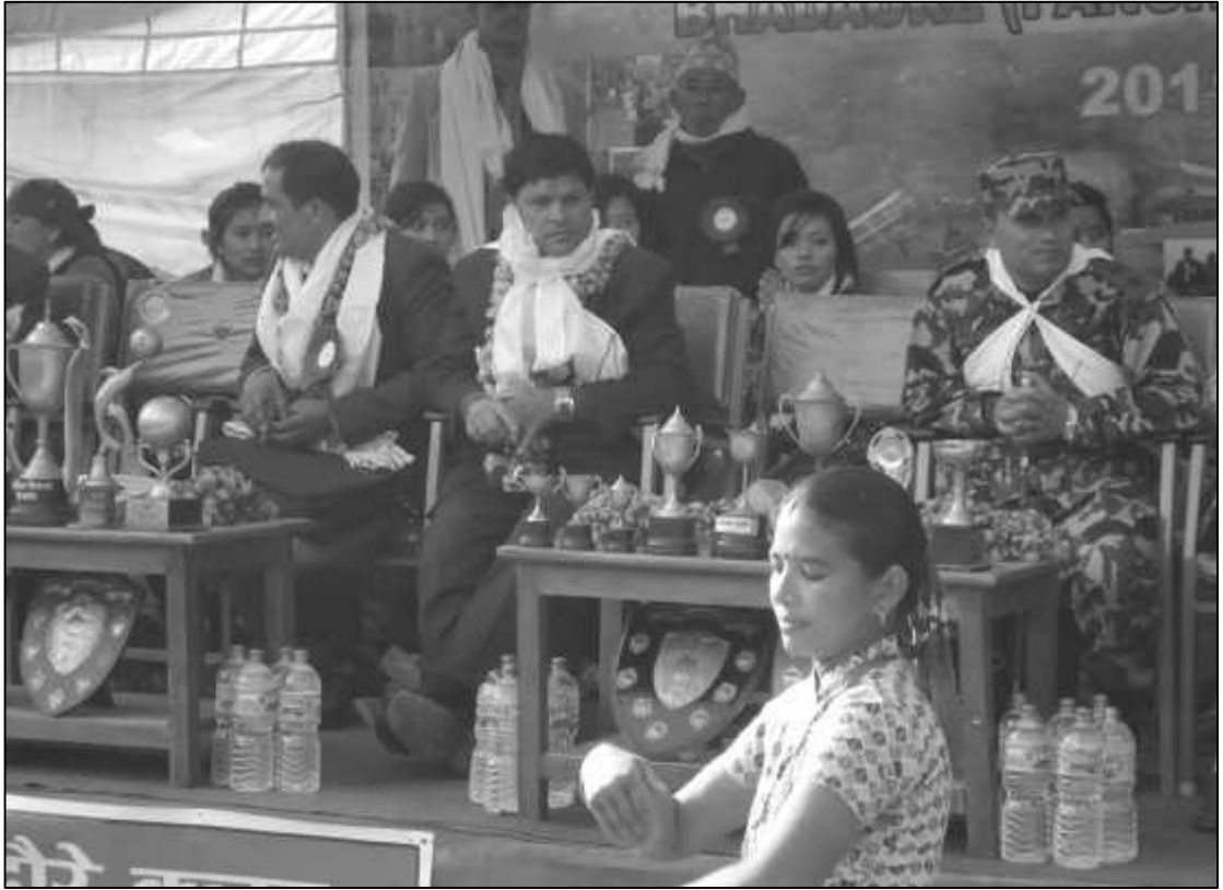
लहोसार मेला २०६८