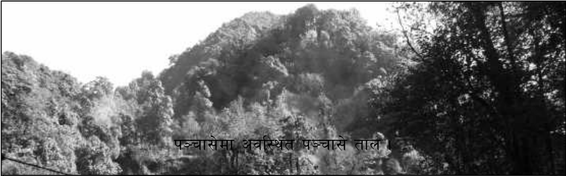
पञ्चासेमा अवस्थित पञ्चासे ताल ।