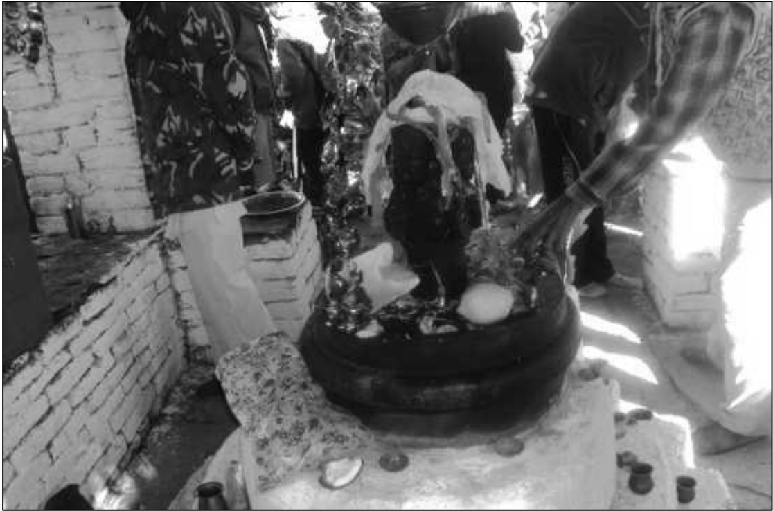
सिद्धवाबा मन्दिरभित्र अवस्थित शिवलिं ।