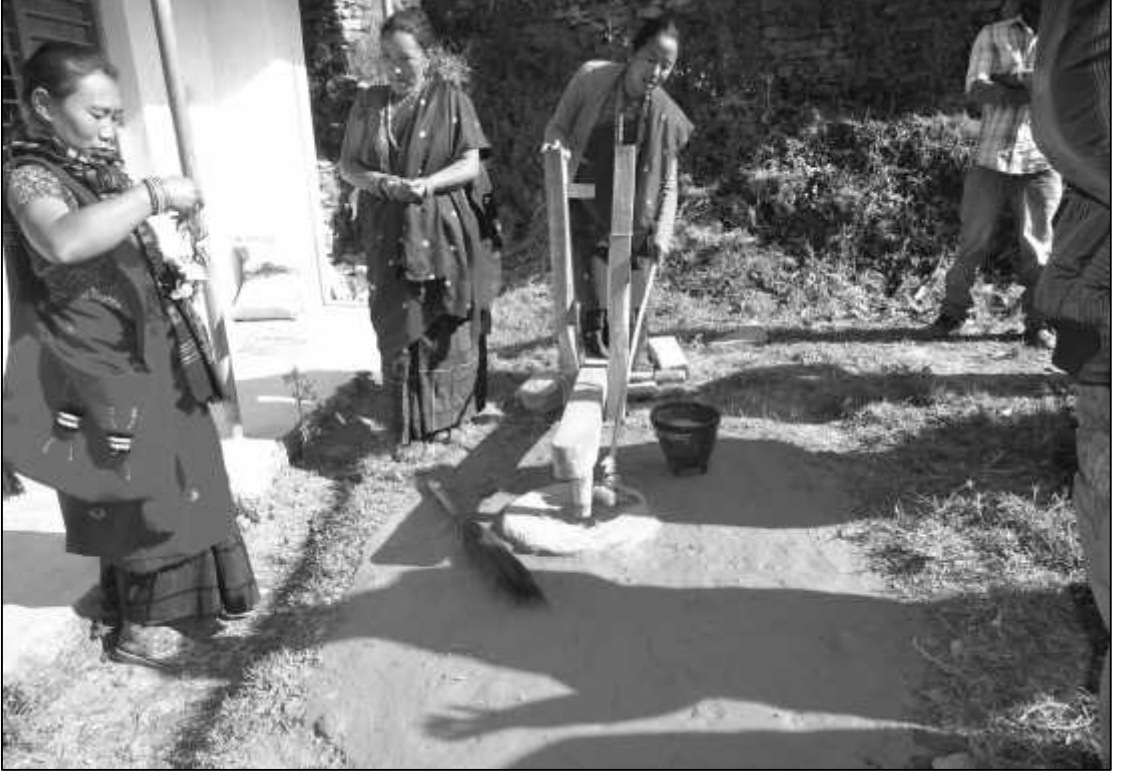
परम्परागत काठे मेसिन (ढिकी)मा स्थानीय महिलाहरू धान कुट्दै ।