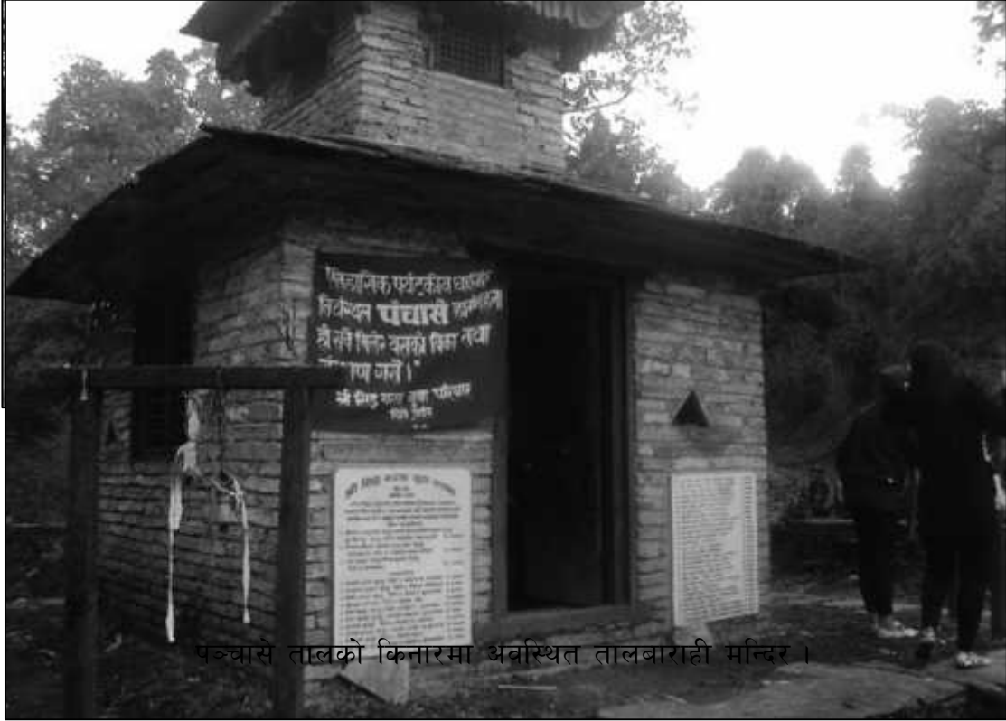
पञ्चासे तालको किनारमा अवस्थित तालबाराही मन्दिर ।