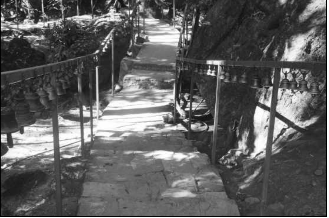
मन्दिरको प्रवेशद्वारदेखि मन्दिरसम्म बाटोको दुवैतर्फ भुण्ड्याइएका घण्टहरू ।