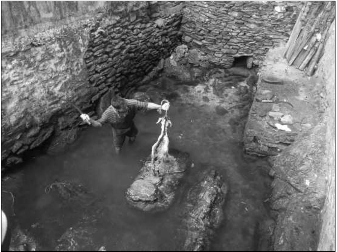
ढोरबाराहीको कुण्डमा रहेको शिलामाथि पाठीको बलि दिइँदै ।