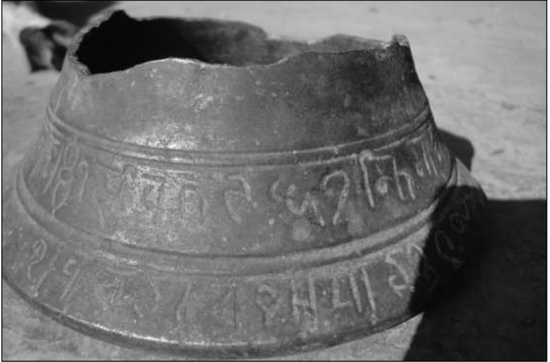
संवत् ९६७ अंकित ढोरबाराही मन्दिरमा प्राप्त सबैभन्दा पुरानो घण्टा अभिलेख ।