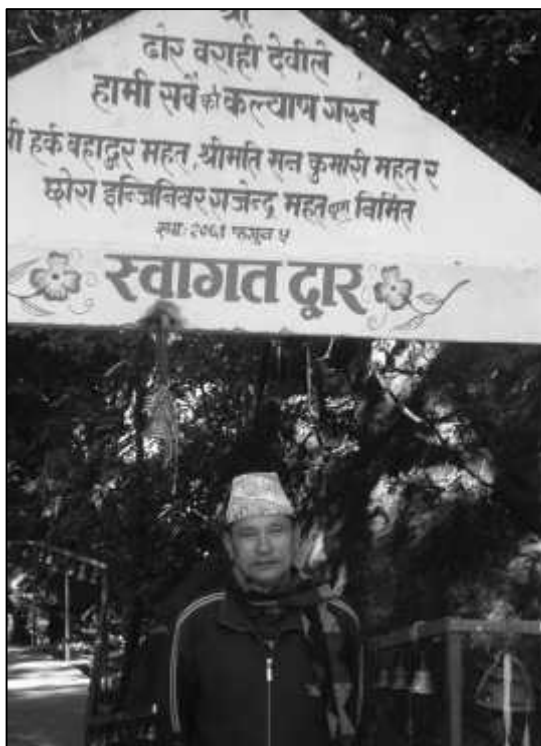
ढोरबाराही देवीको मन्दिरका हालका ठेकेदार र उनीबाट निर्मित प्रवेशद्वार ।