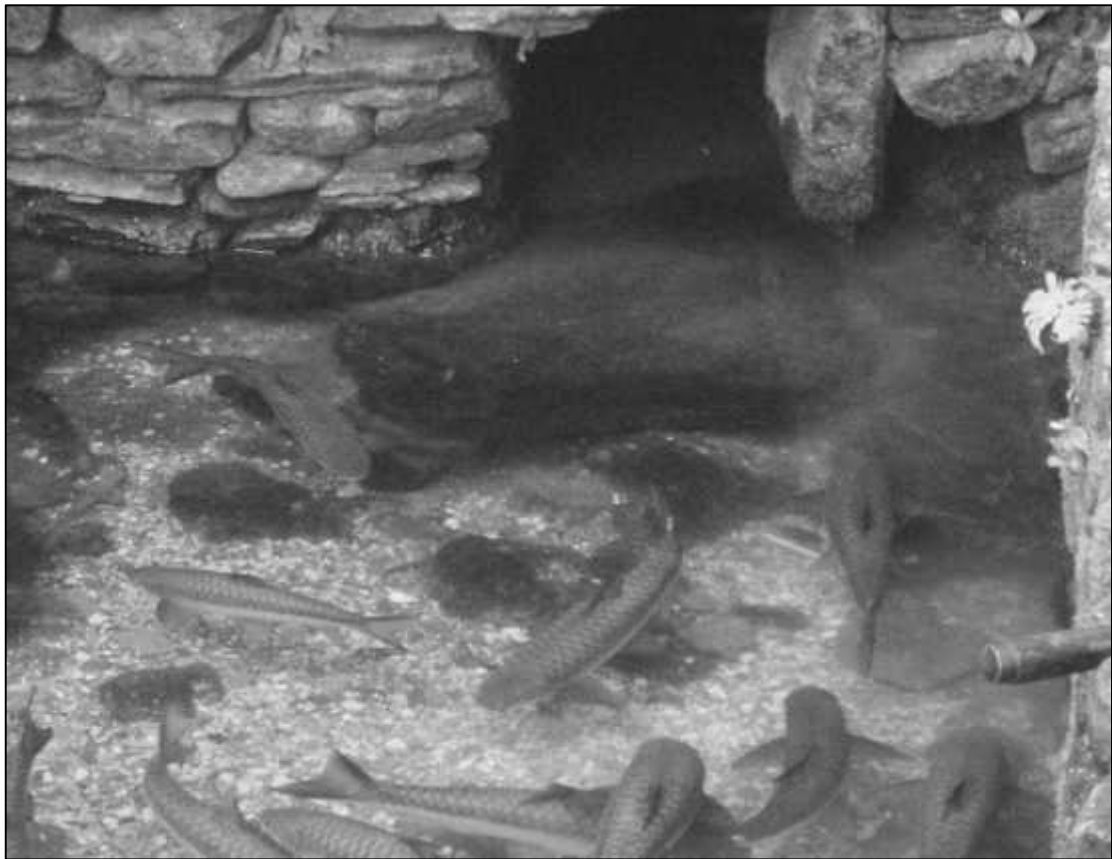
बाराही कुण्डमा लहरी छुट्ने मुहान र यसमा पालिएका माछाहरू ।