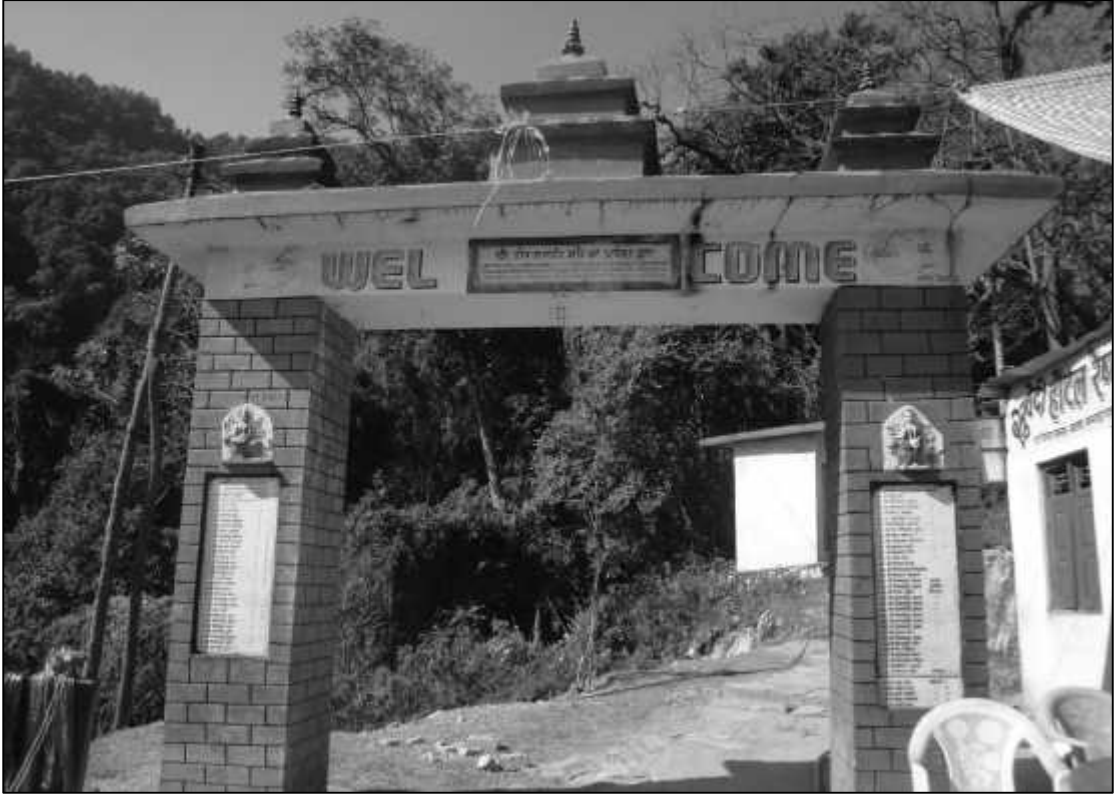
ढोरबाराही मन्दिर प्रवेशद्वार ।