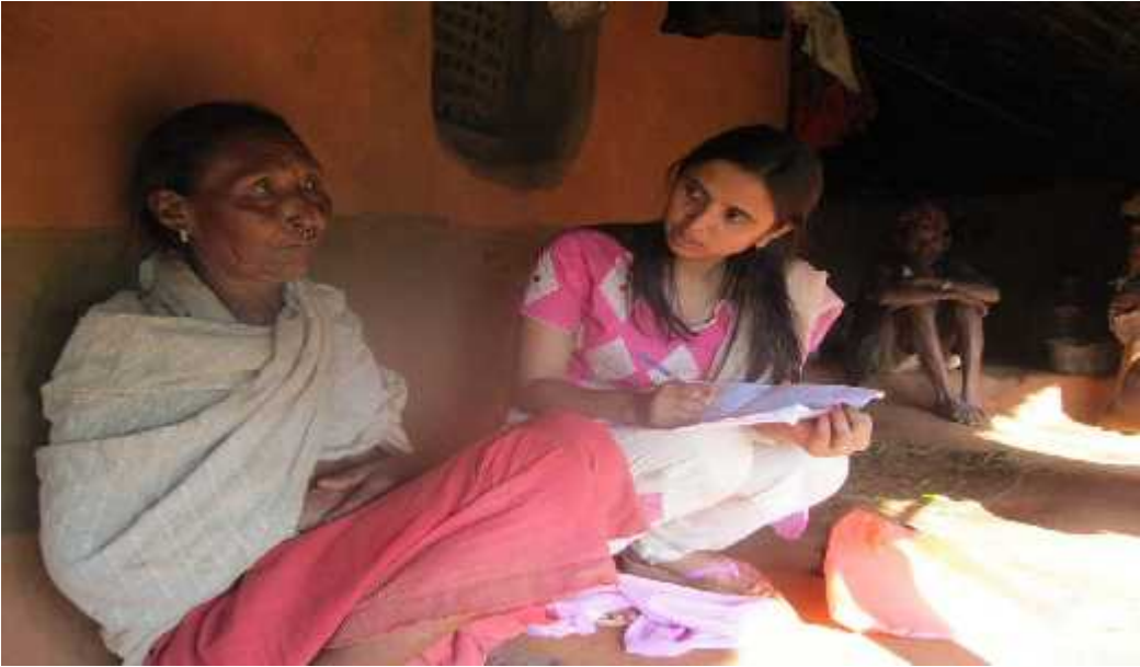
चित्र छः अनुसन्धानकर्ता उत्तरदातासँग