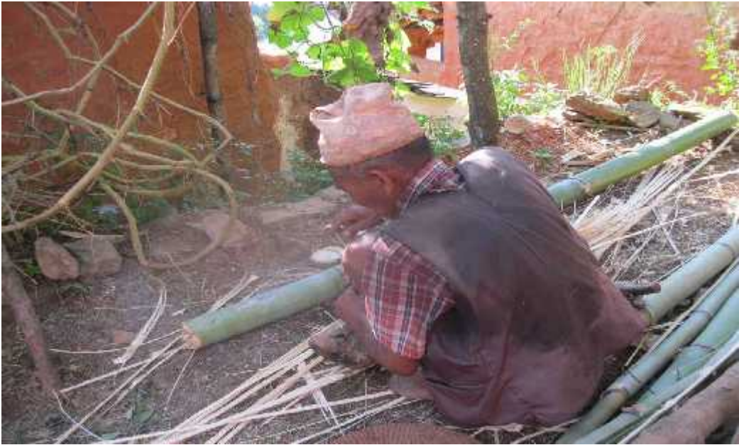
चित्र चार: डोको बुन्दै एक सार्की वृद्ध