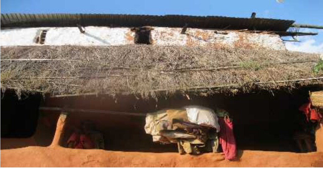
चित्र पाँच: घैयार गाउको एक घर