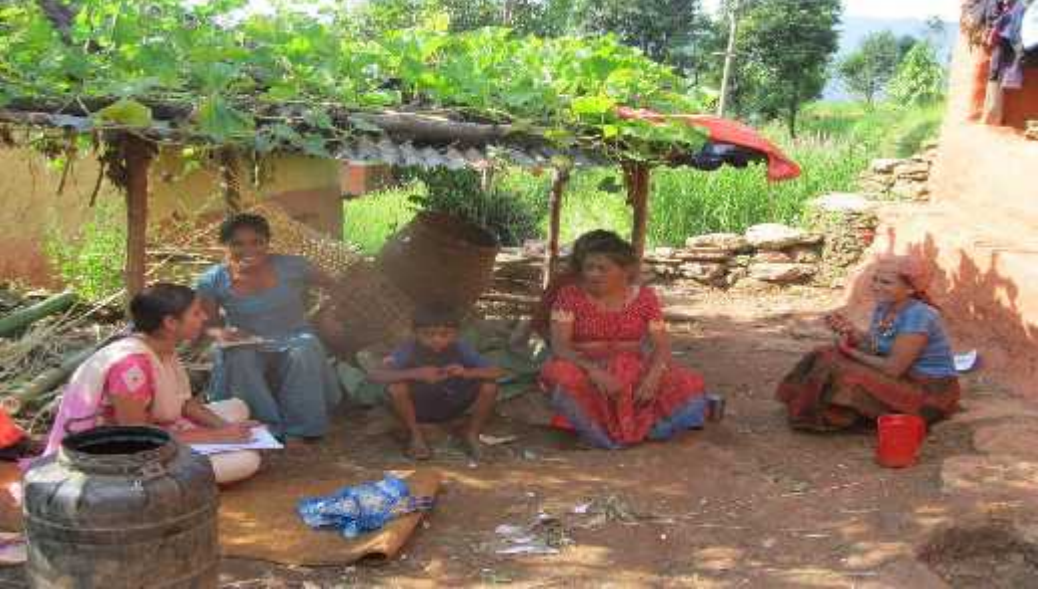
चित्र दुई: अनुसन्धानकर्ता संयुक्त परिवार सदस्यसँग छलफल गर्दै