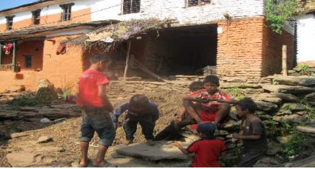
चित्र एक: घैयार समाज