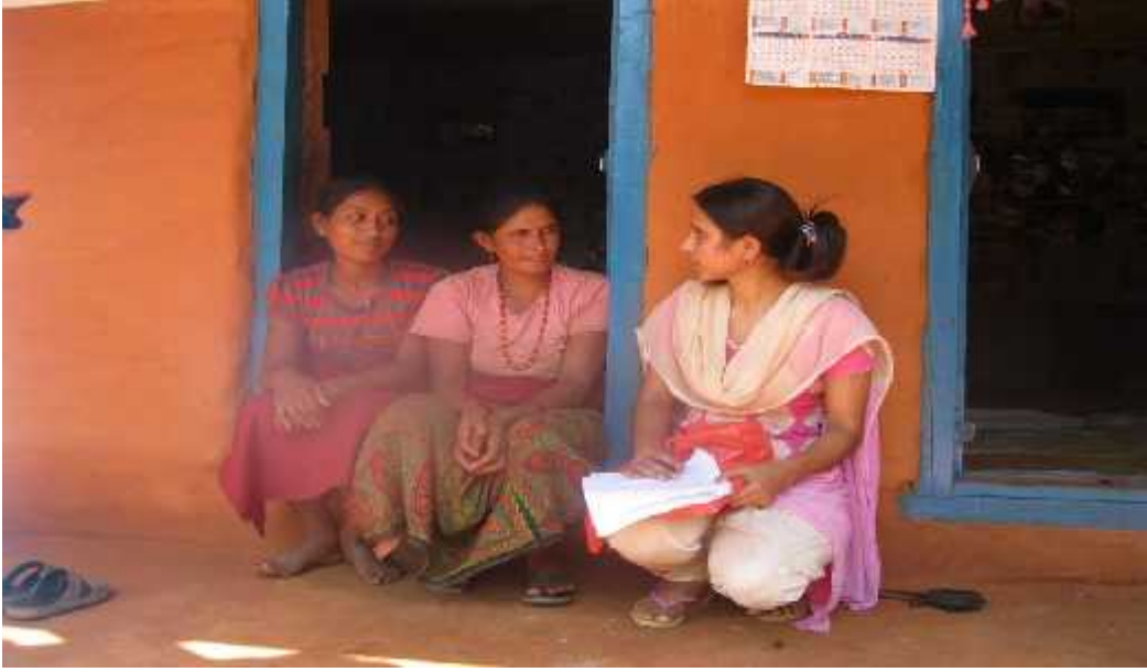
चित्र तीन: अनुसन्धानकर्ता अन्तर्वार्ता लिदै