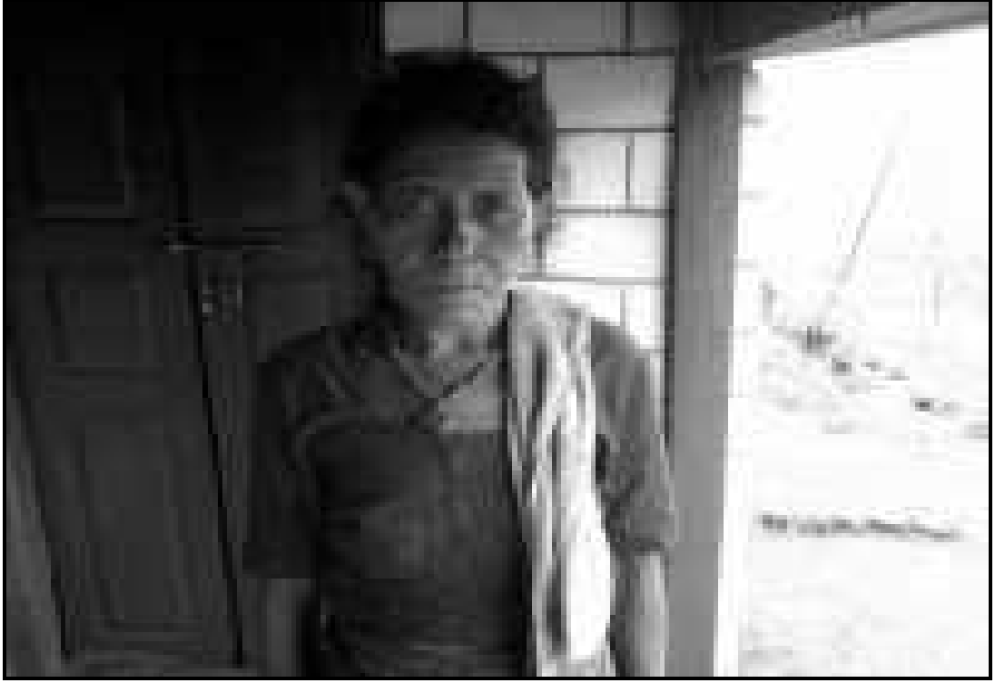
व्यक्तिगत अध्ययन एककी मंगली नेपाली