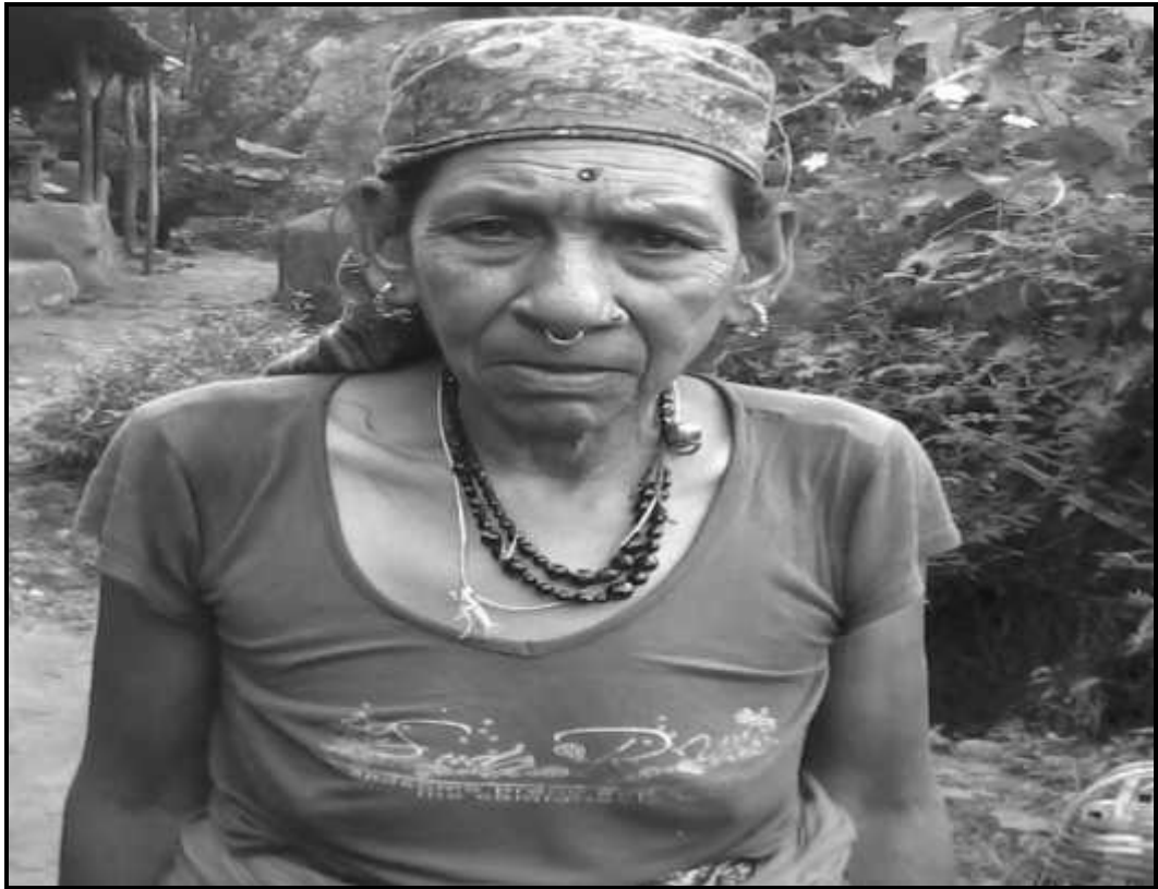
व्यक्तिगत अध्ययन एककी मोतीमाया नेपाली