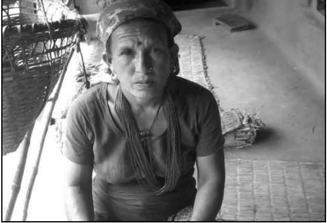
व्यक्तिगत अध्ययन अठारकी सुनसरी नेपाली