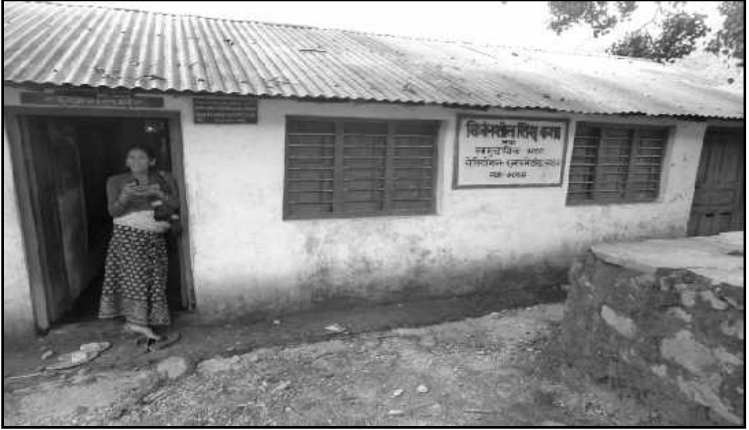
दलित महिलाहरूले बनाएको शिशु कक्षाको भवन