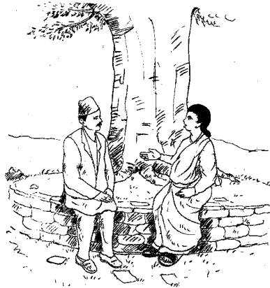
नागरिक समाजको भूमिका