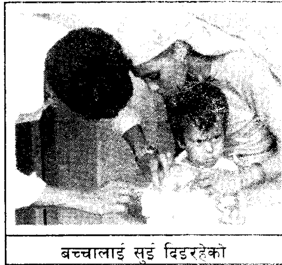
बच्चालाई सुई दिइरहेको