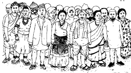
हिमाल, पहाड र तराई प्रदेशका वेशभूषासहितका मानिसहरू

सामाजिक अध्ययन पाठ्य पुस्तकको पृष्ठ ६८ विविधतामा एकता पाठमा विषयबस्तुको रूपमा प्रस्तुत राष्ट्रिय गानलाई अध्ययन गरी विश्लेषण गर्दा नेपालको अन्तरिम संविधान २०६३ को धारा ३ अनुरूप जातिय