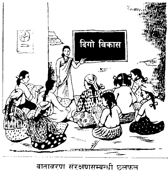
चित्र नं. २ दिगो विकास