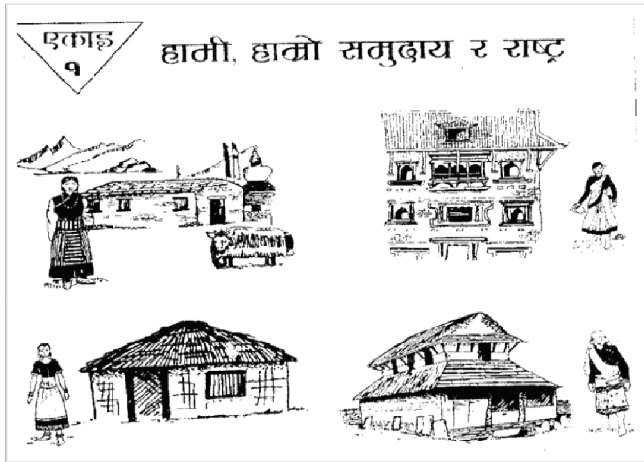
चित्र नं. १ हामी, हाम्रो समुदाय र राष्ट्र