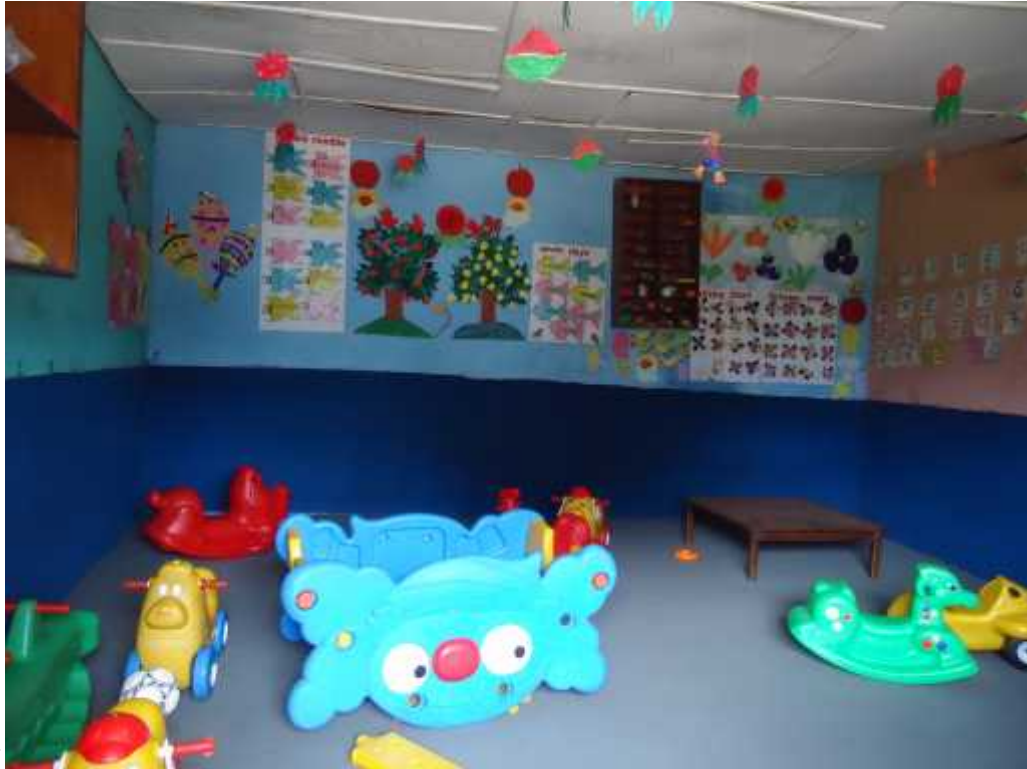
संस्थागत विद्यालयको जुनियर ल्याब