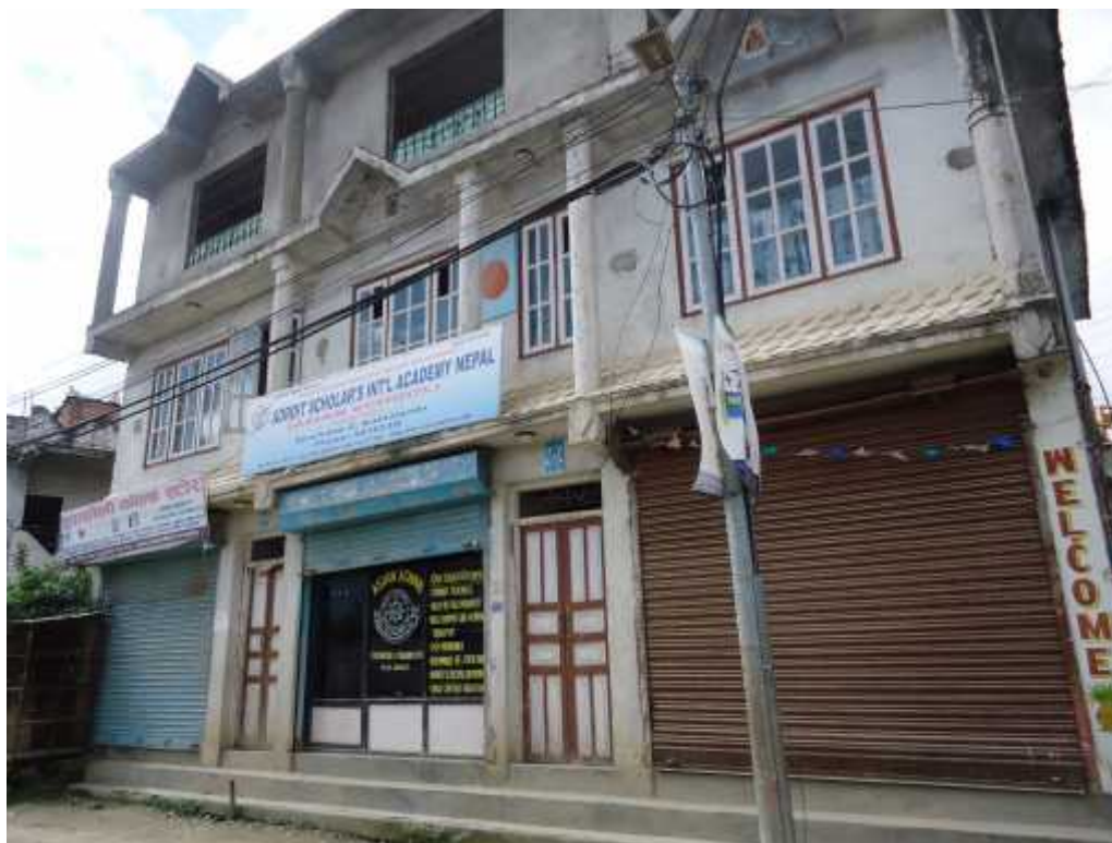
छनोटमा परेका संस्थागत विद्यालय