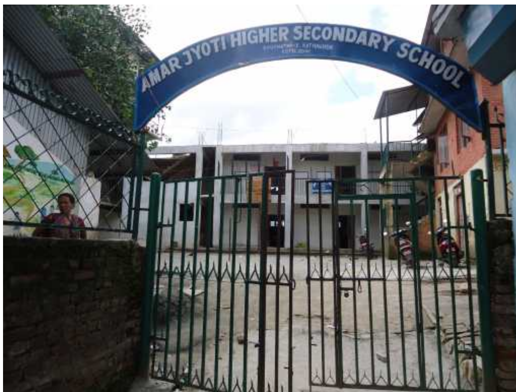
छनोटमा परेका सामुदायिक सामुदायिक विद्यालय