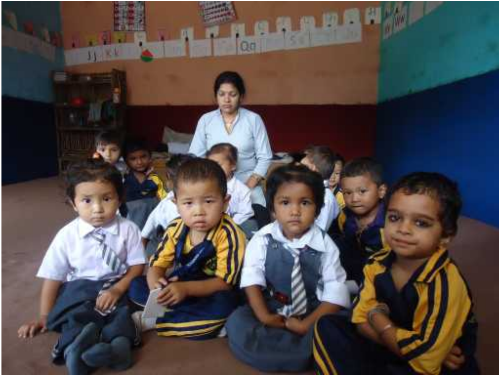
छलफलमा सहभागी संस्थागत विद्यालयका बालबालिकाहरु