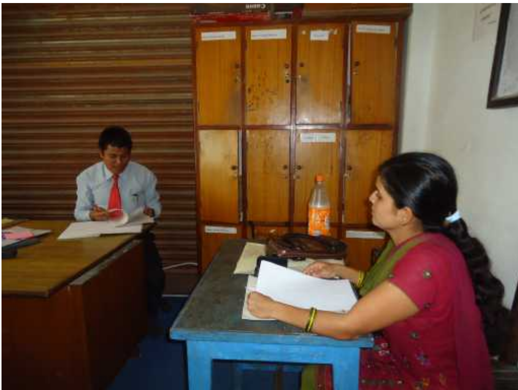
संस्थागत विद्यालयको प्र.अ. सँग गरिएको अन्तर्वार्ता