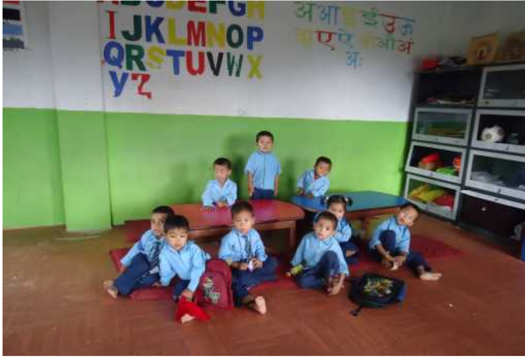
सहभागी बालबालिकाहरु (सामुदायिक)