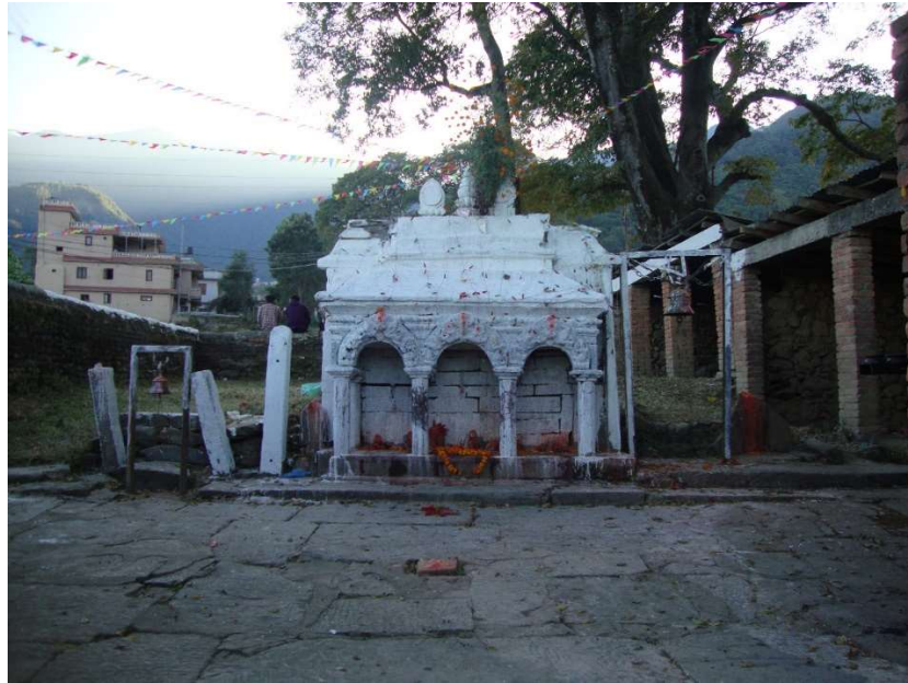
२. महालक्ष्मीको मन्दिर, मातातीर्थ जाने बाटोसँगै ।