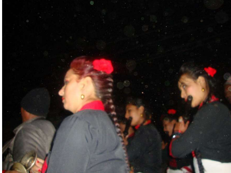
६. स्थानीय महिलाहरुको बाँसुरी वादन