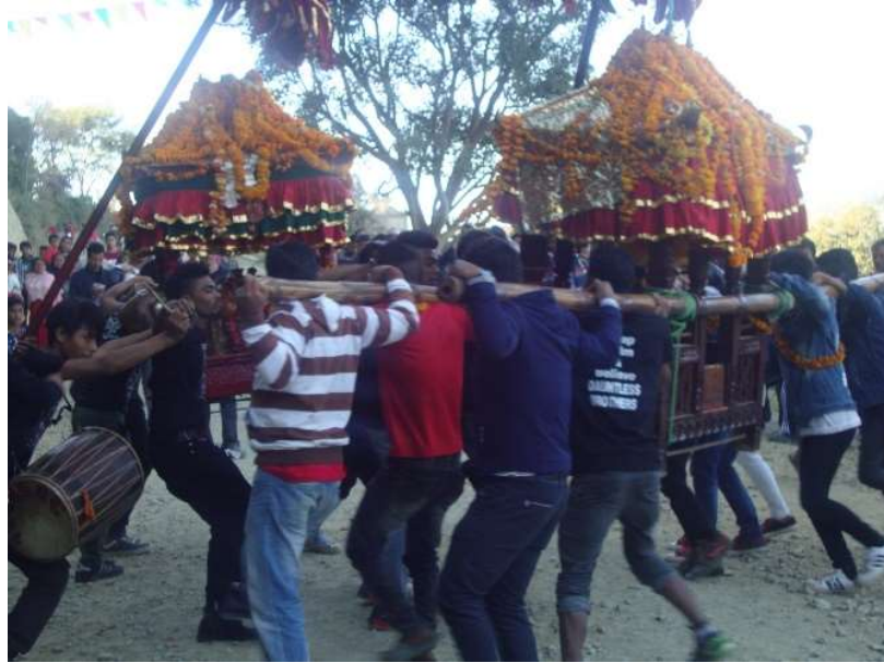
१०. खट्यात्रा गरिदै