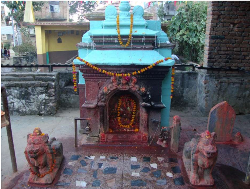
४ .सिद्धिविनायक(गणेश)को मन्दिर, गणेश टोल, बालागाउँ ।