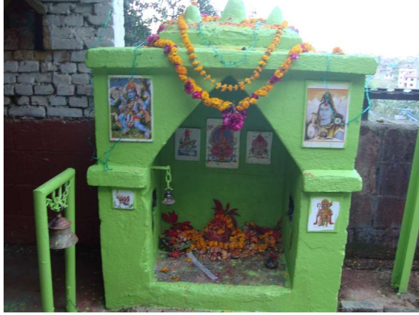
३. वनमहालक्ष्मीको मन्दिर, ईटाखेल,गोल्छाप ।