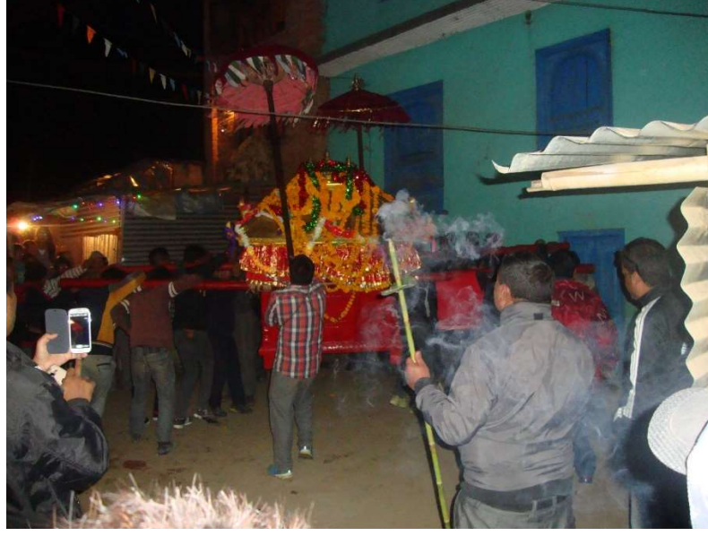
५. महालक्ष्मीको खट्