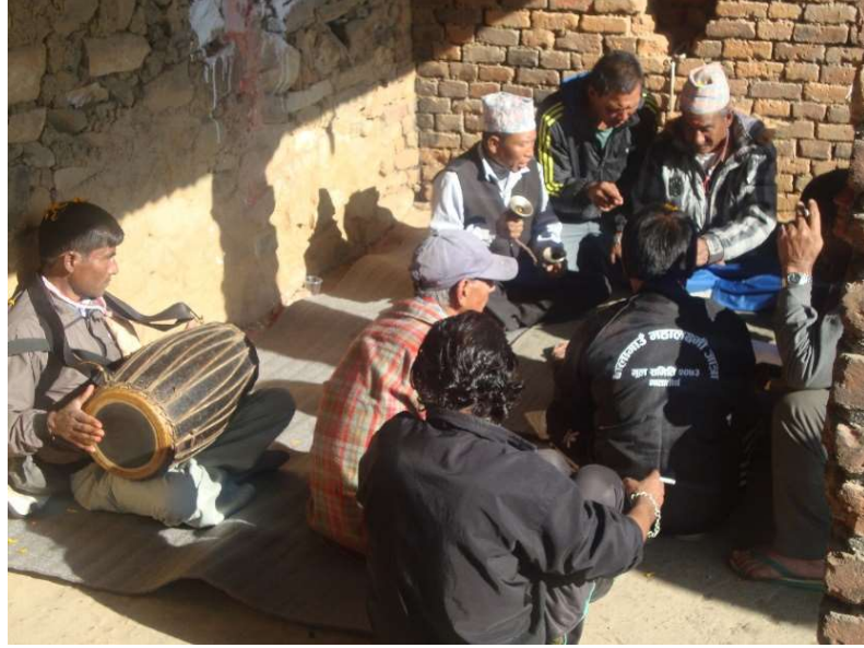
८. दाफा भजन गाउँदै