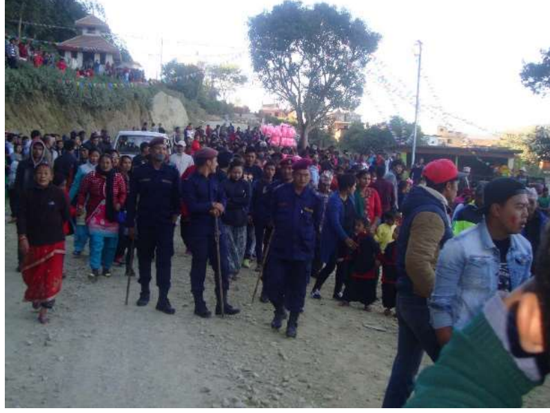
९. जात्रामा सहभागी