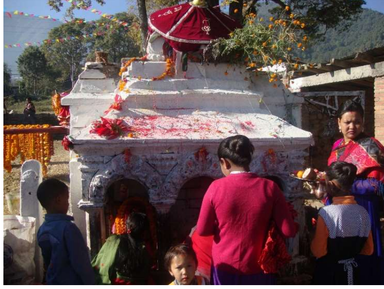
७. महालक्ष्मी मन्दिरमा पूजा गर्दै