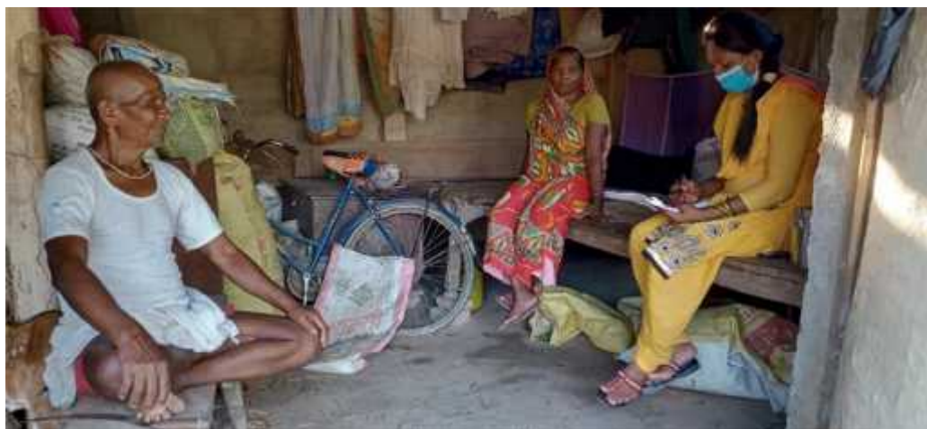
दृष्य नं. १ - अर्न्तवर्ता लिएको अवस्था