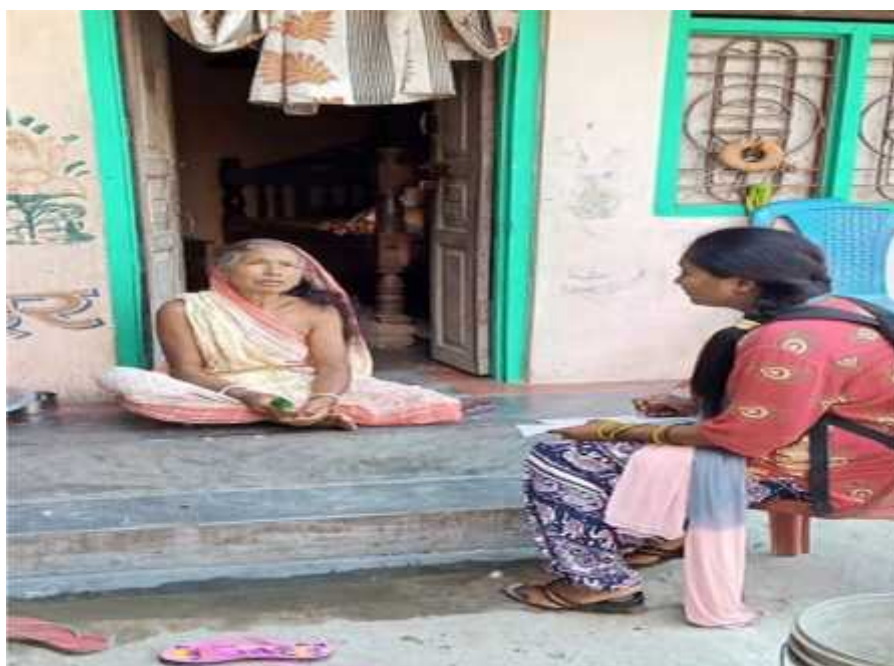
दृष्य नं. २ - अर्न्तवर्ता लिएको अवस्था