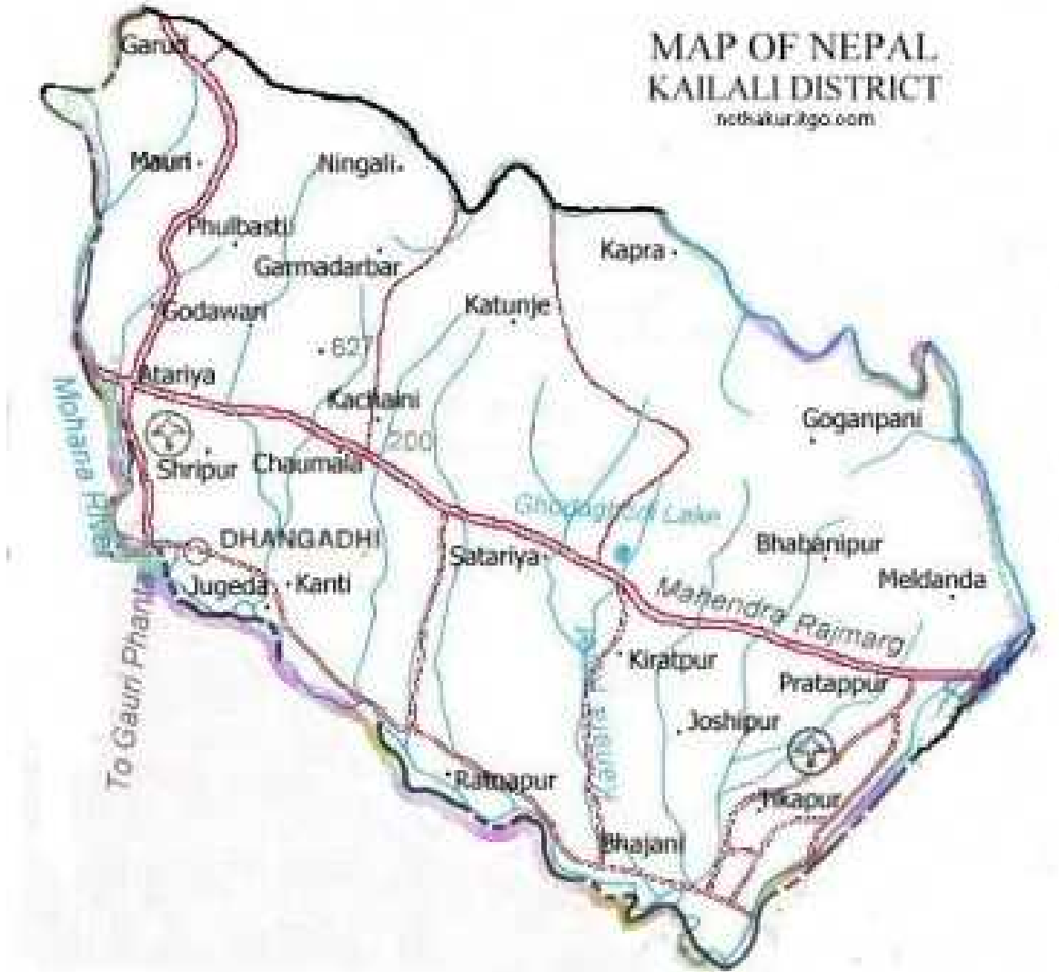
नक्सा नं.१ कैलाली जिल्ला