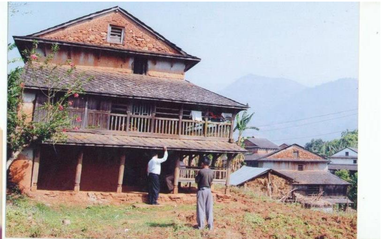
हुर्किने क्रममा कँडेलका बस्नु भएको घर (मलेखु, रिचोक्टार)