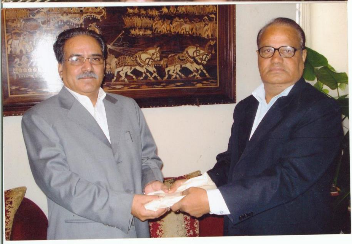
पूर्वप्रधानमन्त्री प्रचण्डलाई आफूद्वारा रचित पुस्तकहरू प्रदान गर्दै