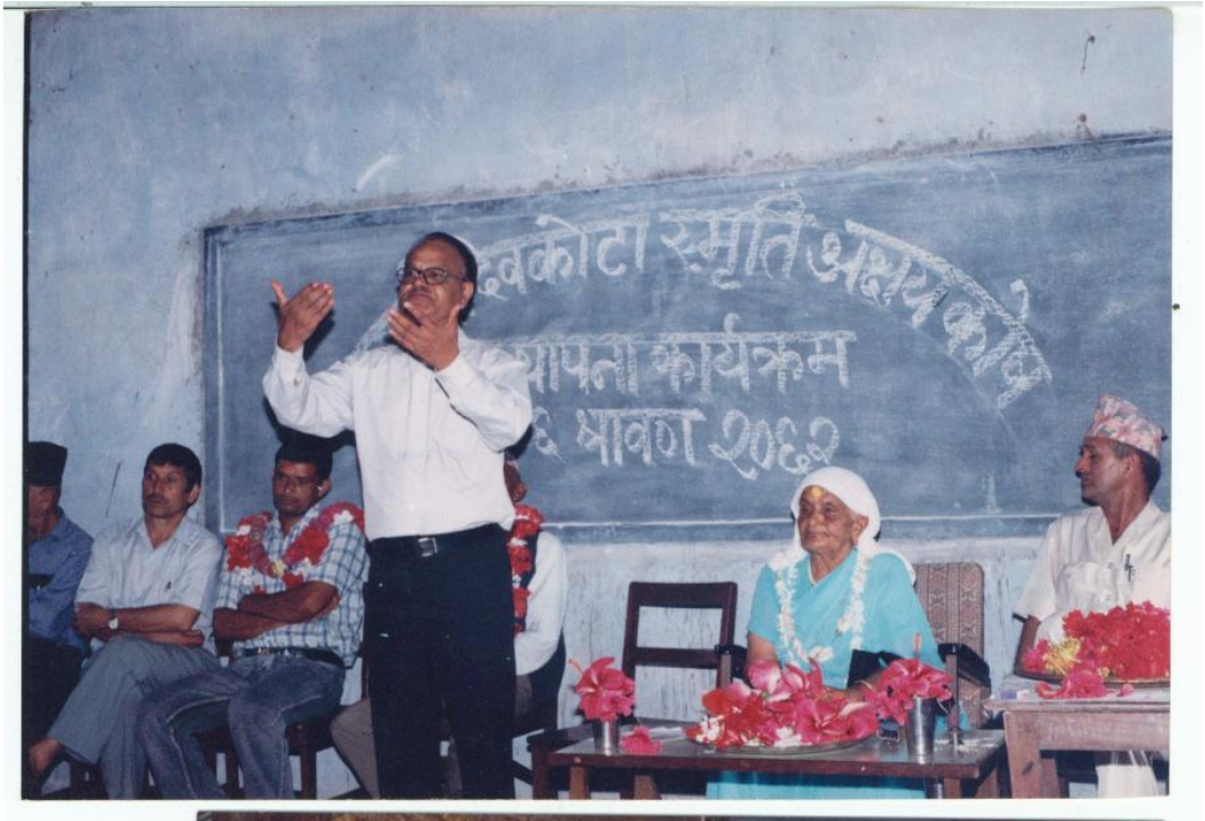
दवकोटा स्मृति अक्षयकोष स्थापना कार्यक्रममा आफ्नो मन्तव्य व्यक्त गर्दै कँडेल