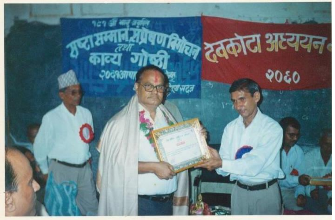
वाल्मीकि साहित्य सम्मान, रत्ननगरद्वारा सम्मान ग्रहण गर्दै