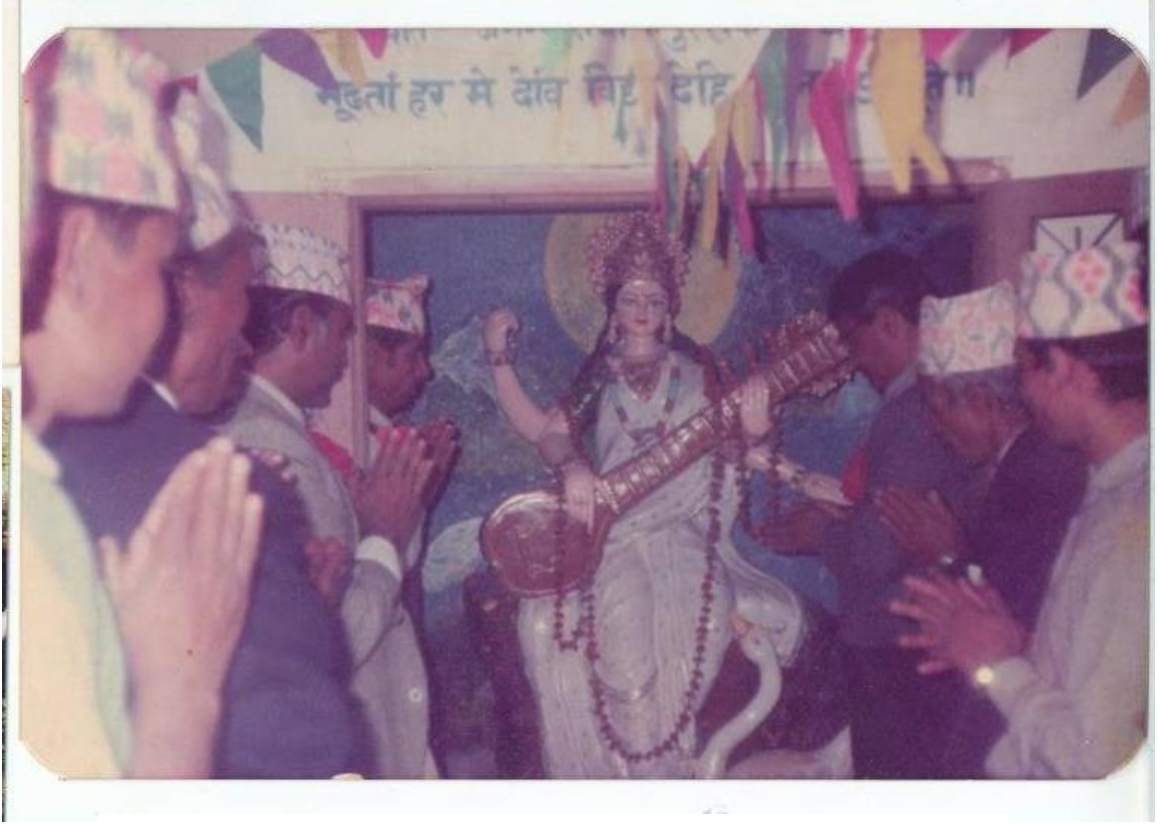
सरस्वतीको प्रतिमा अनावरण गर्दै कँडेल (नारायणी विद्या मन्दिर उच्च माध्यामिक विद्यालय)