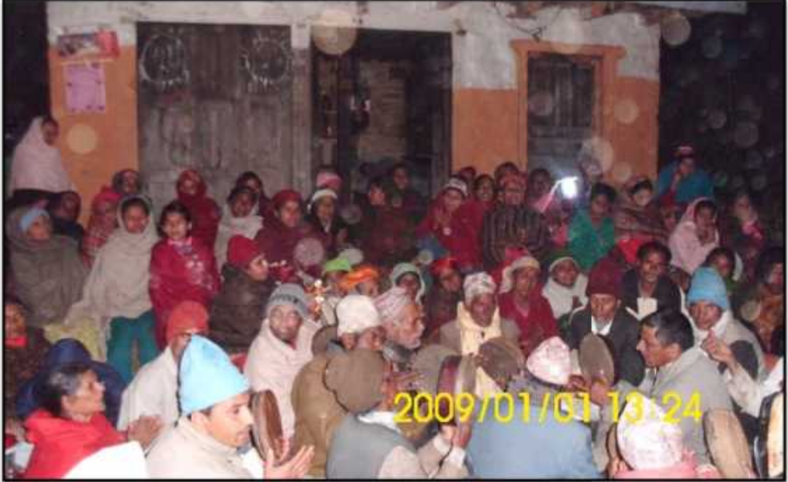
भजन गाउँदै गरेको दृश्य