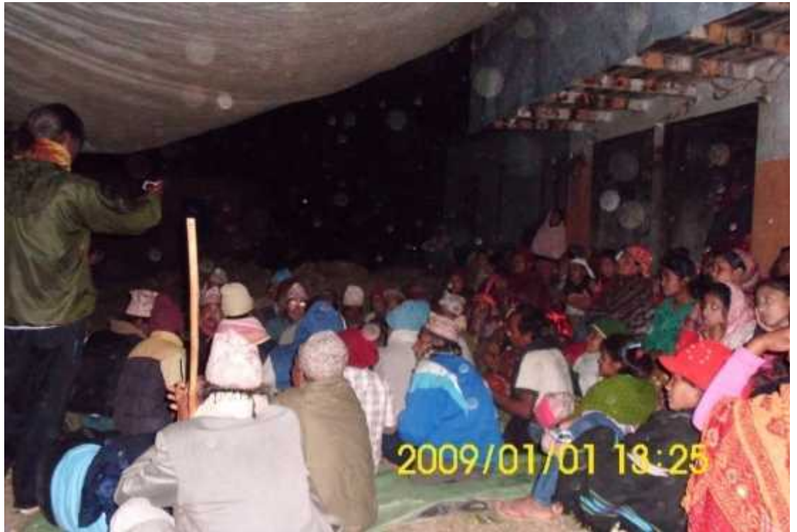
दोहोरी गीत गाउँदै गरेको दृश्य