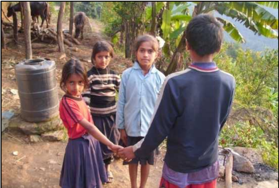
बालगीत गाउँदै गरेको दृश्य