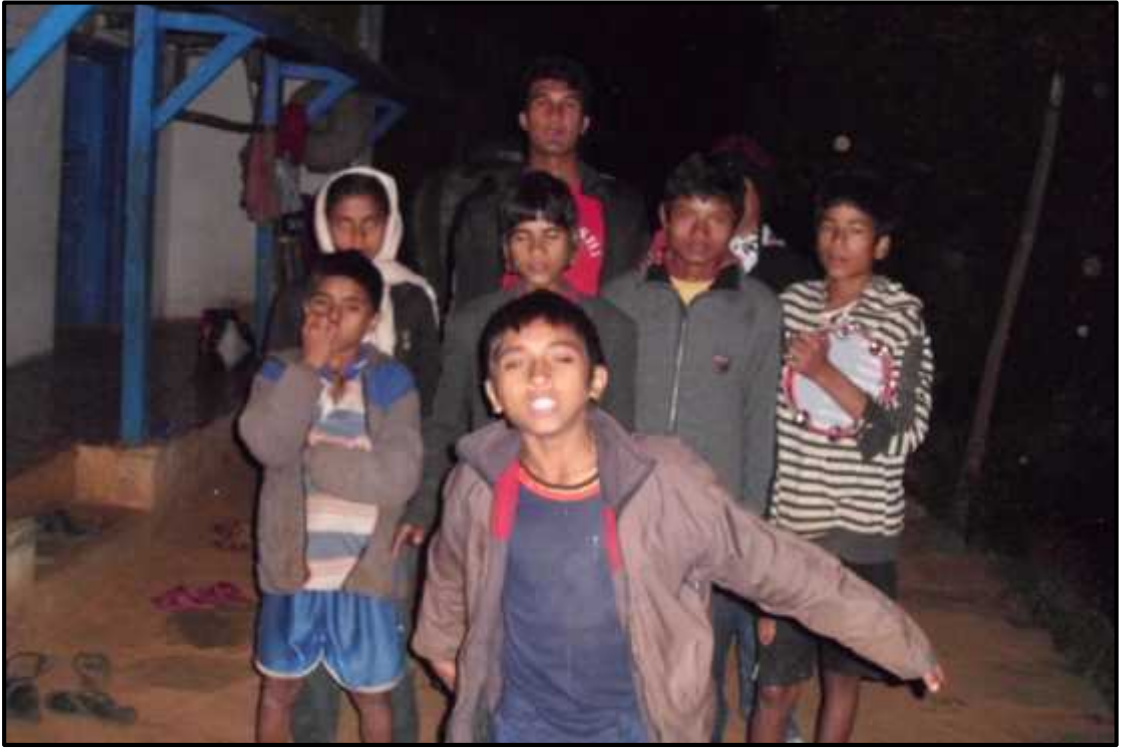
देउसी रे गीत गाउँदै गरेको दृश्य