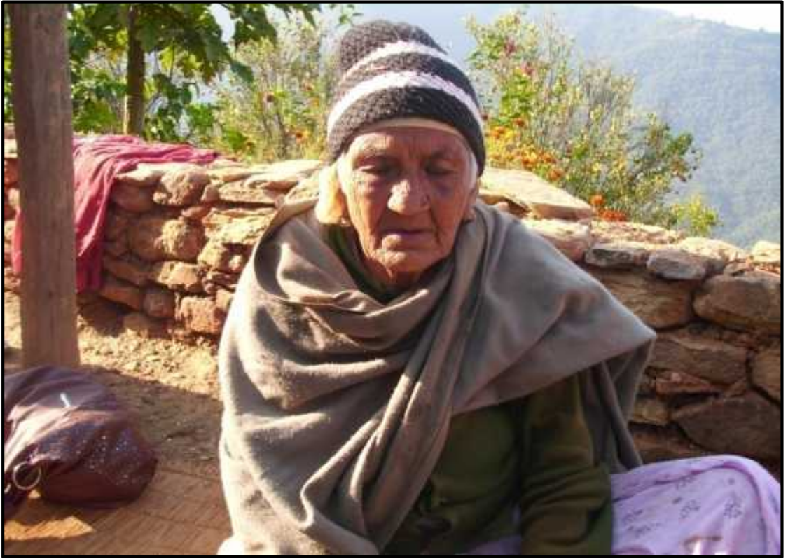
सिलोकगीत गाउँदै गरेको दृश्य