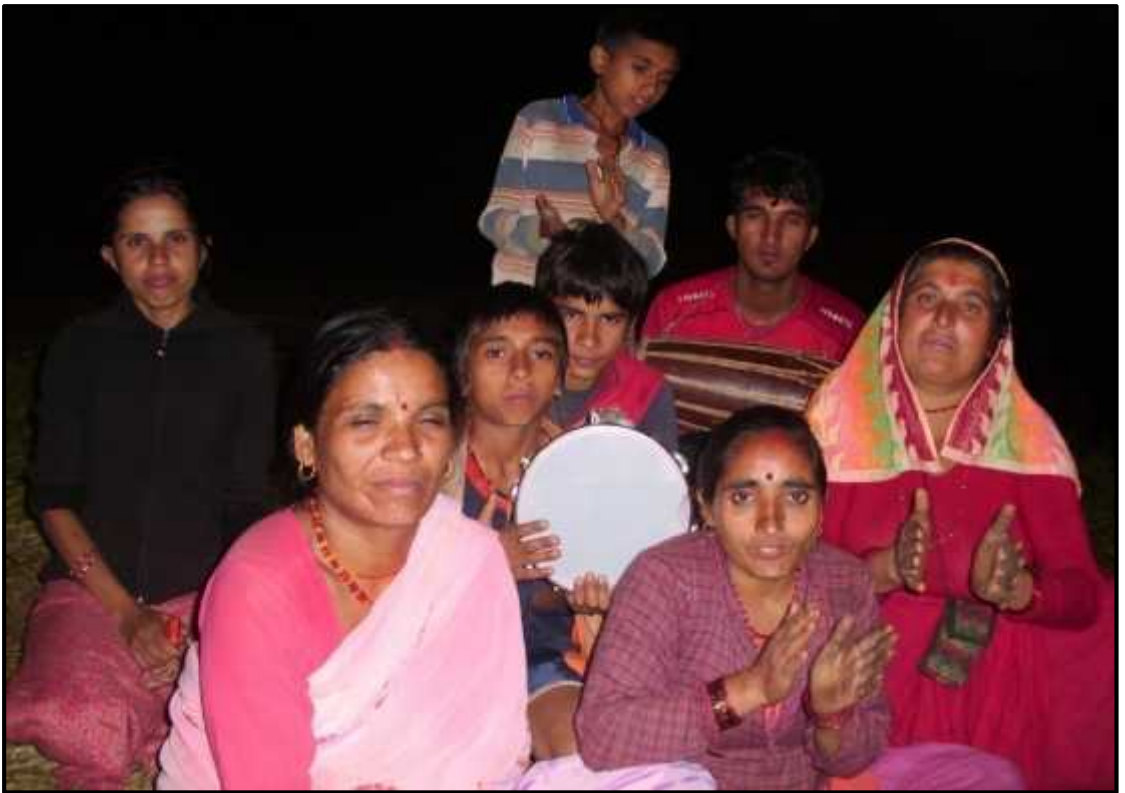
भैलीगीत गाउँदै गरेको दृश्य