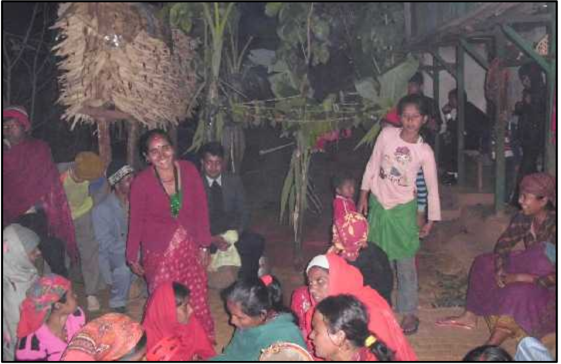
एकोहोरी गीत गाउँदै गरेको दृश्य