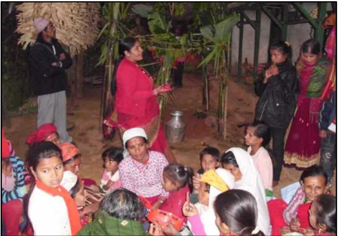
रत्यौलीगीत गाउँदै गरेको दृश्य