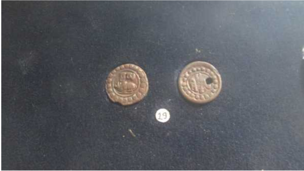
चित्र संख्या : ११ वृष मद्राको अग्रभाग, पृष्ठभाग