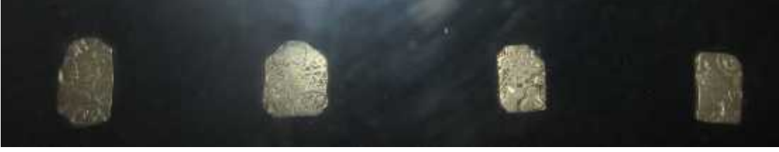
चित्र संख्या : ३ पञ्चमार्क मुद्रा