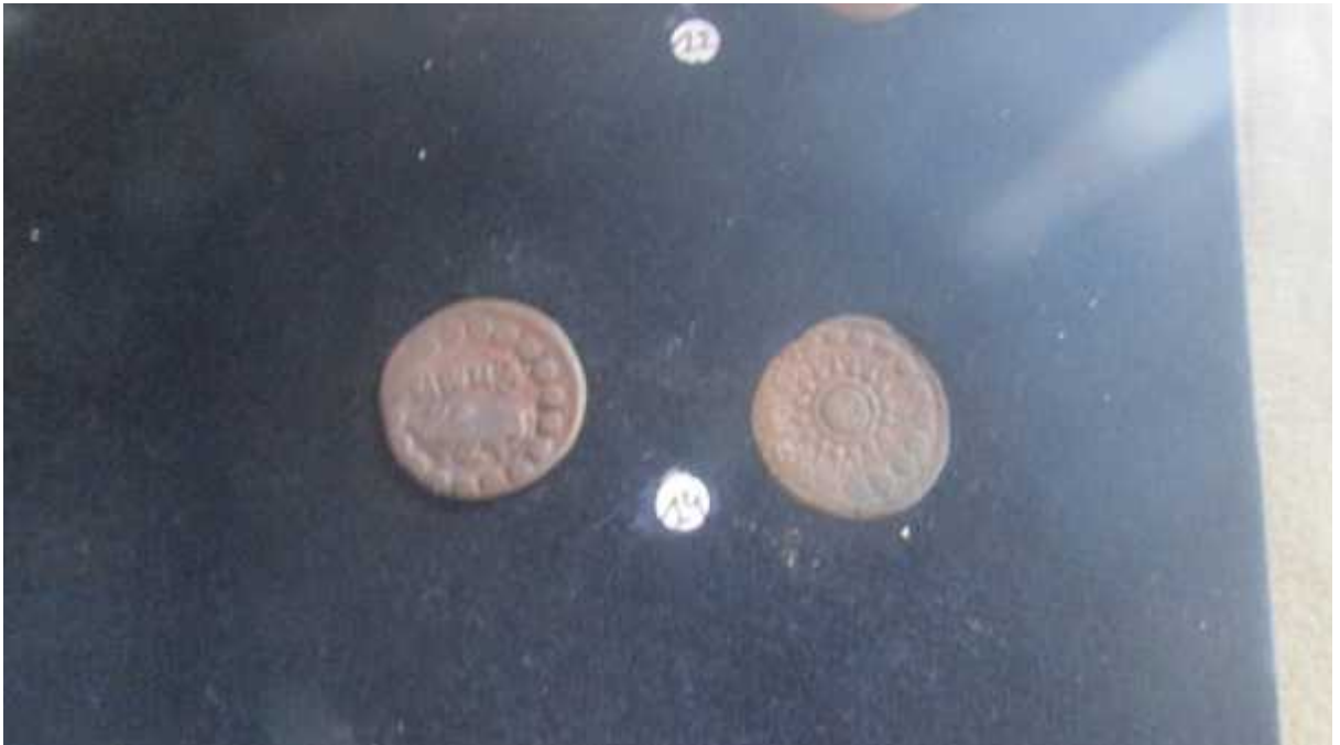
चित्र संख्या : २० पशुपतिमुद्राको अग्रभाग, पृष्ठभाग