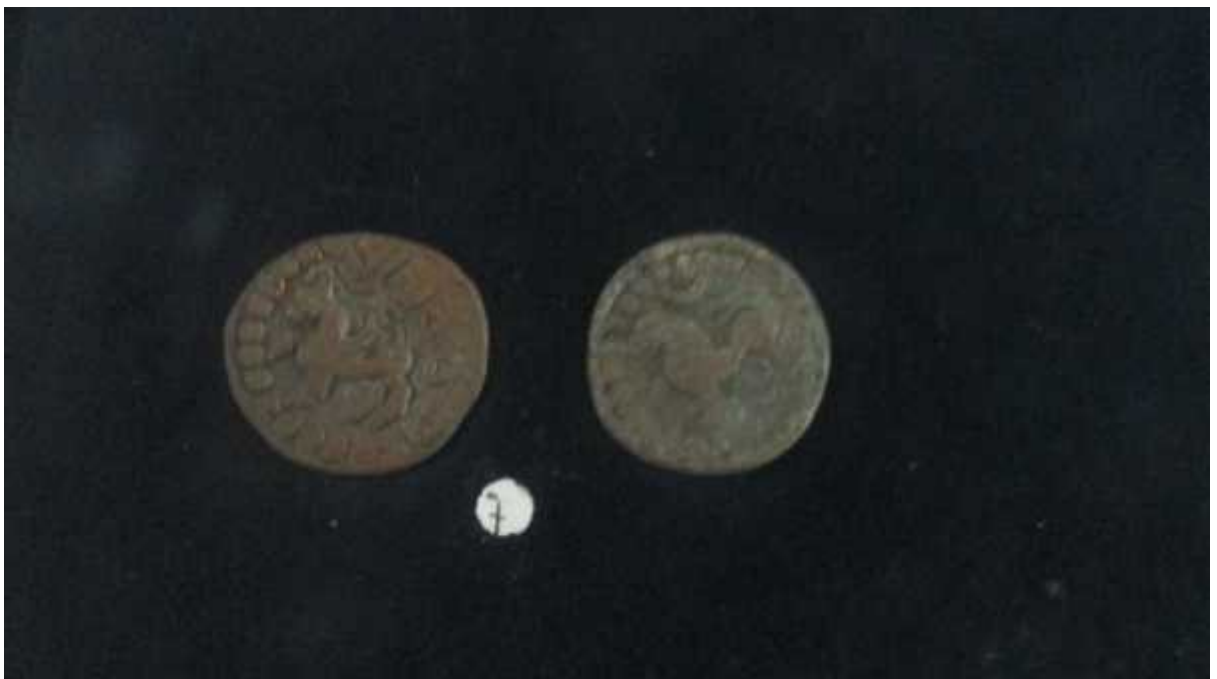
चित्र संख्या : १६ अंशुवर्माको मुद्राको अग्रभाग, पृष्ठभाग