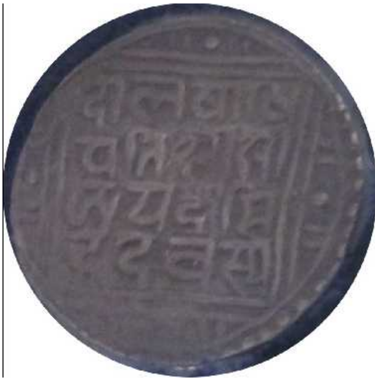
चित्र संख्या : ३० दोलखाको मुद्रा