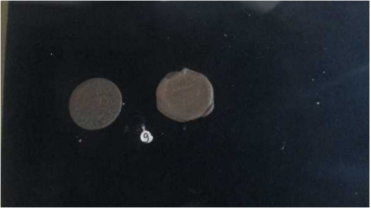
चित्र संख्या : २१ वैश्रवणमुद्राको अग्रभाग, पृष्ठभाग