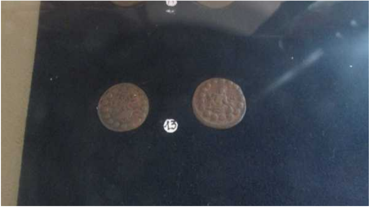
चित्र संख्या : १९ पशुपतिमुद्राको अग्रभाग, पृष्ठभाग