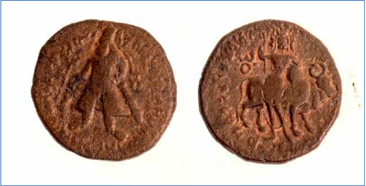
चित्र संख्या : २ कुषाणकालीनमुद्रा