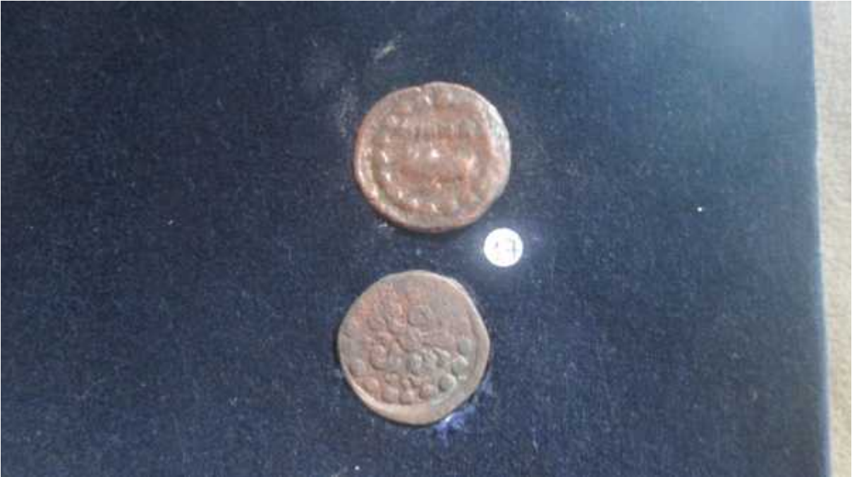
चित्र संख्या : १८ पशुपतिमुद्राको अग्रभाग, पृष्ठभाग