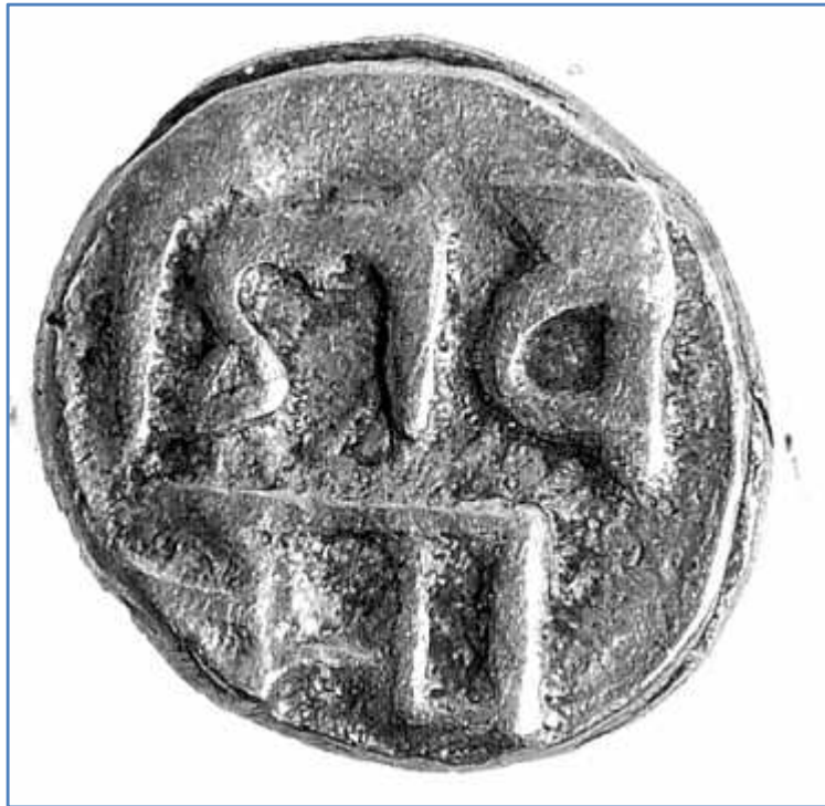
चित्र संख्या : २८ शिवदेवकामद्राको पृष्ठभाग