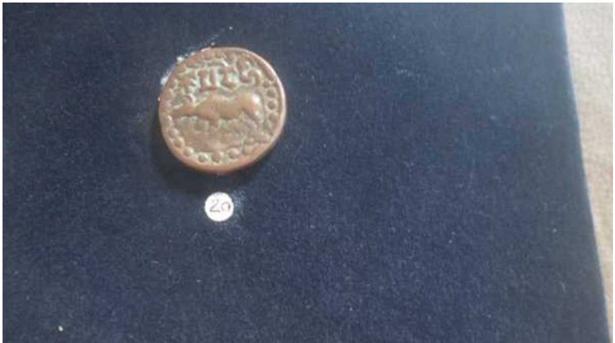
चित्र संख्या : १२ वृष मद्रा