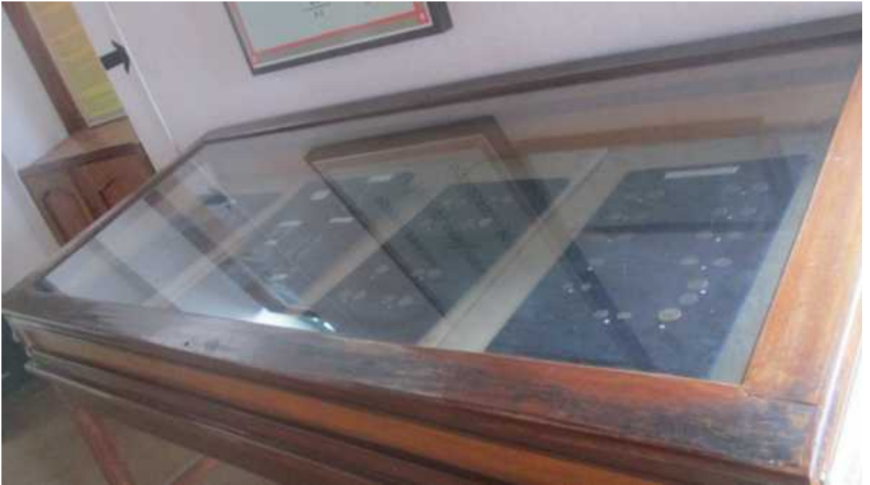
चित्र संख्या : २६ संग्रहालयमाप्रदर्शित लिच्छविकालीनमुद्राको शोकेस