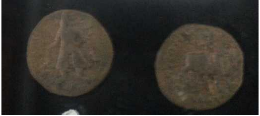
चित्र संख्या : ९ विमकदफिसेसकामुद्रा