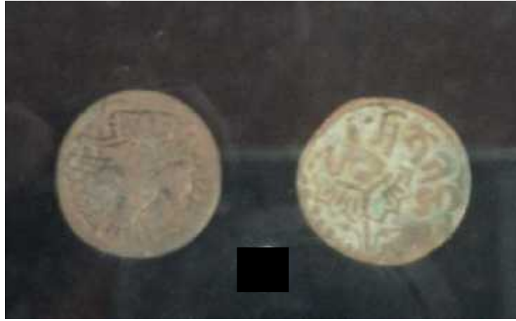
चित्र संख्या : ५ मानाङ्कमुद्राको अग्रभाग, पृष्ठभाग