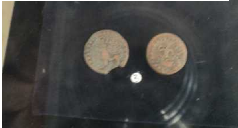
चित्र संख्या : ६ मानाङ्कमुद्राको अग्रभाग, पृष्ठभाग