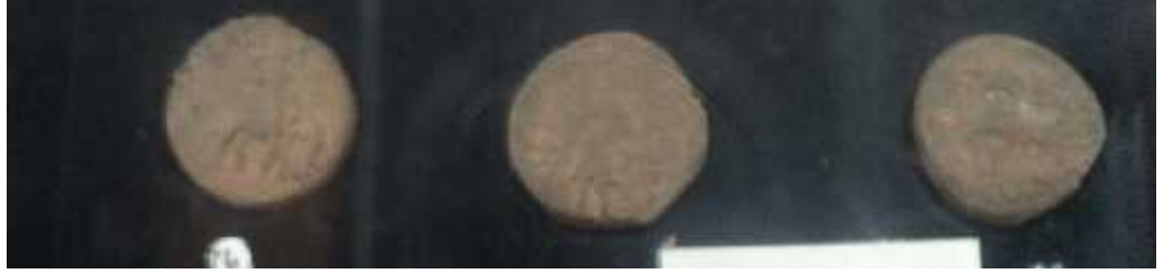
चित्र संख्या : ८ हविष्ककामुद्रा