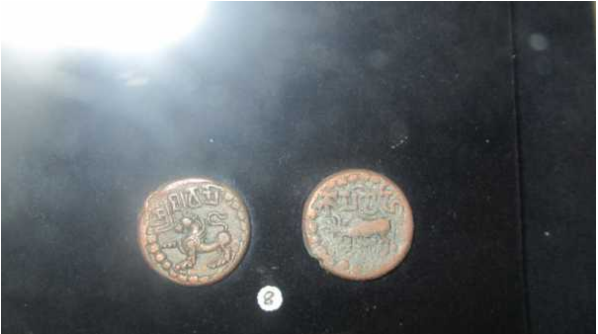
चित्र संख्या : १४ अंशुवर्माको मुद्राको अग्रभाग, पृष्ठभाग