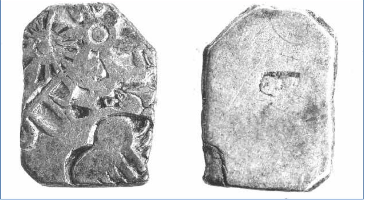
चित्र संख्या : १ भारतीयउपमहाद्वीपकापञ्चमार्क मुद्रा