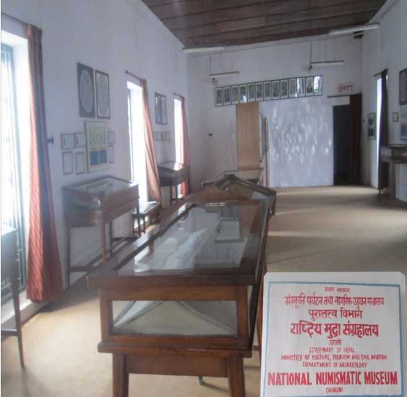
चित्र संख्या : २७ राष्ट्रियमुद्रा संग्रहालय