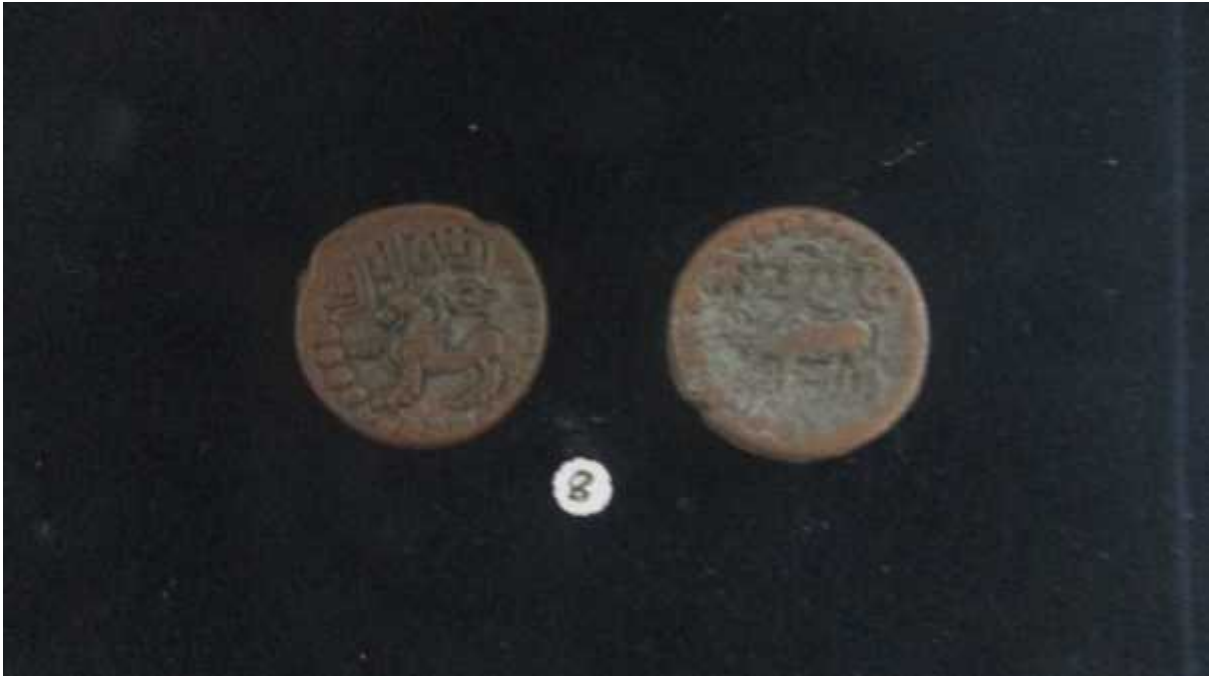
चित्र संख्या : १५ अंशुवर्माको मुद्राको अग्रभाग, पृष्ठभाग