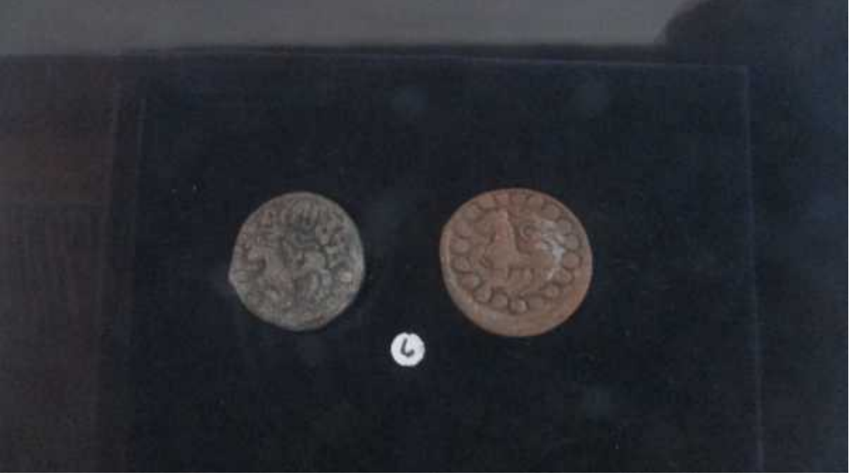
चित्र संख्या : १३ अंशुवर्माको मुद्राको अग्रभाग, पृष्ठभाग