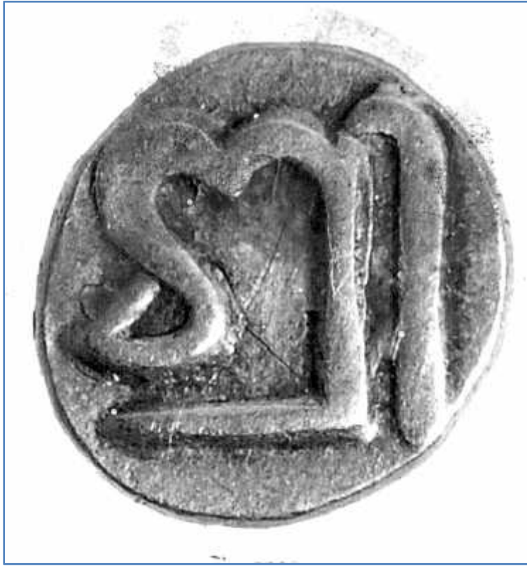
चित्र संख्या : २८ शिवदेवकामद्राको अग्रभाग