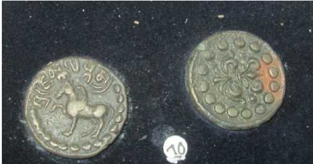
चित्र संख्या : १० जिष्णु गुप्तकामुद्राको अग्रभाग, पृष्ठभाग