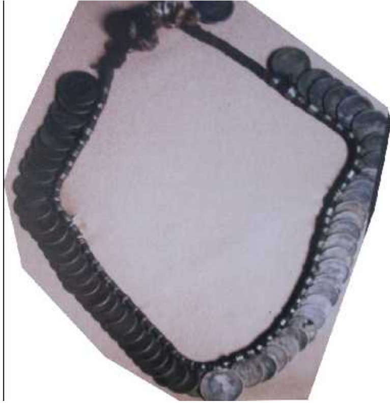
चित्र संख्या : २५ मुद्राको माला