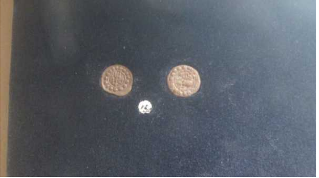
चित्र संख्या : १७ पशुपतिमुद्राको अग्रभाग, पृष्ठभाग