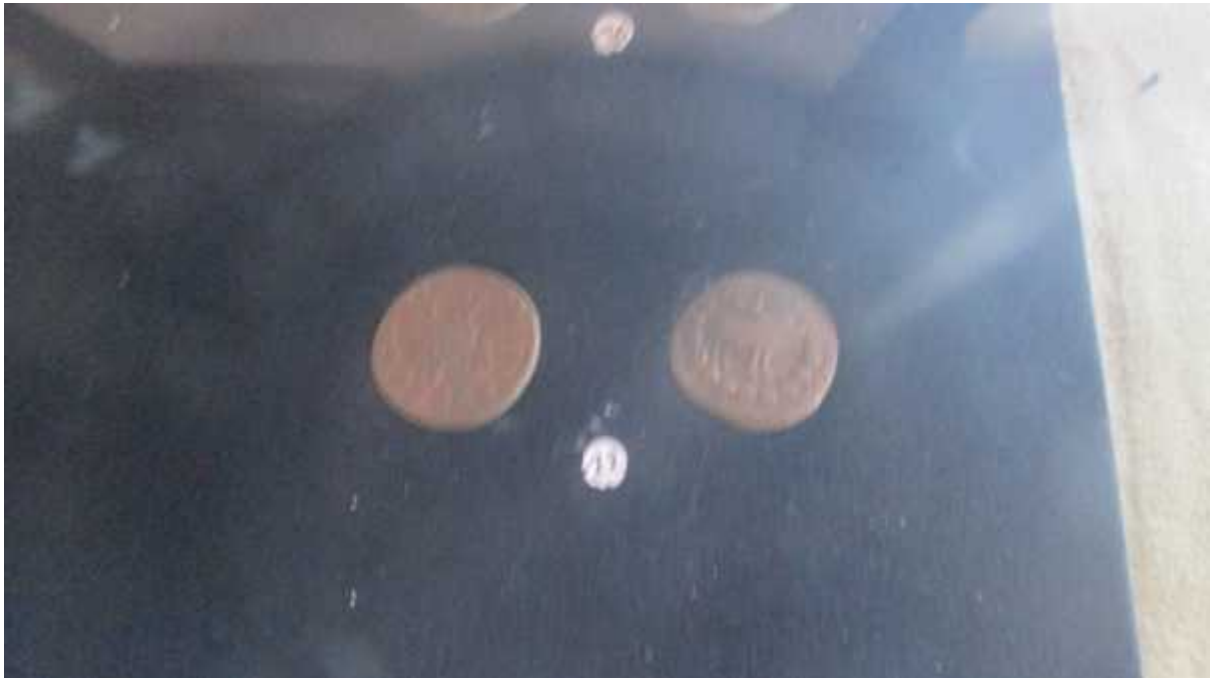
चित्र संख्या : २२ गुणाङ्कमुद्राको अग्रभाग, पृष्ठभाग