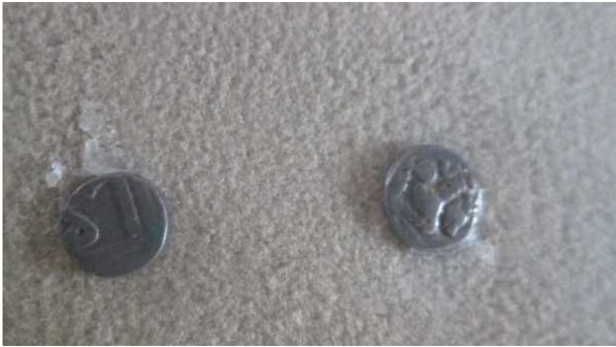
चित्र संख्या : २९ शिवदेवकाद्रम्ममुद्रा