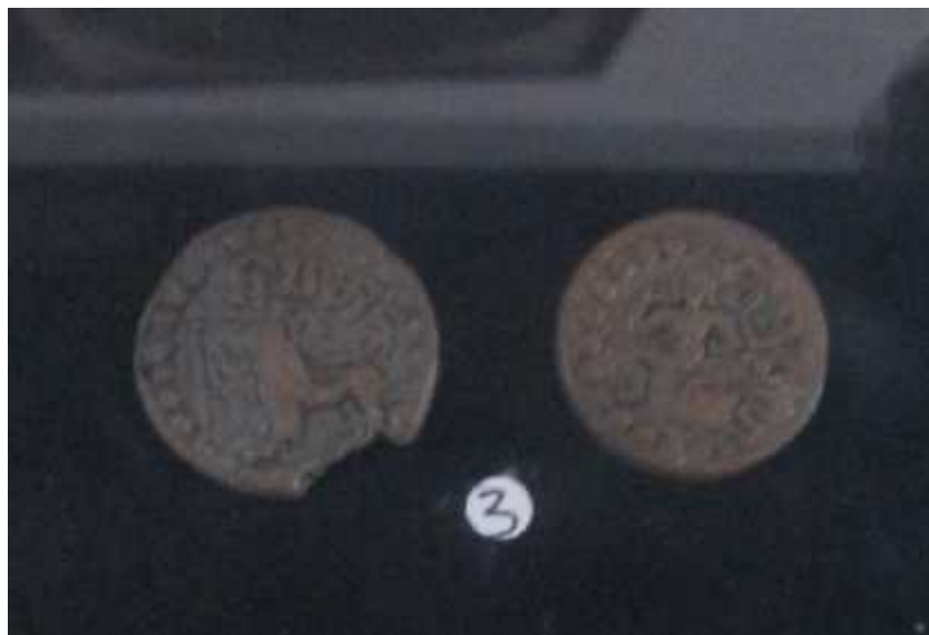
चित्र संख्या : ७ मानाङ्कमुद्राको अग्रभाग, पृष्ठभाग