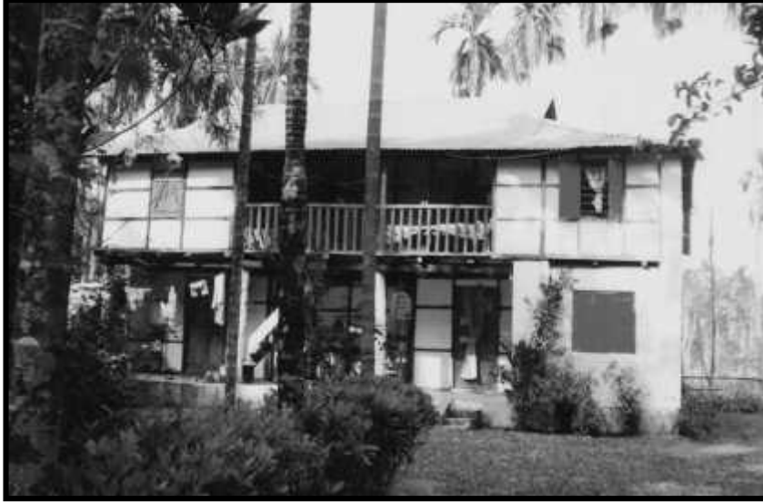
वि.सं. २०२९ मा निर्मित शोधनायकको निवास (कालिस्थान, शनिश्चरे-३, भापा)