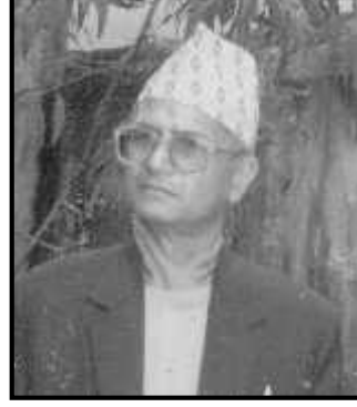
शिक्षण सेवाबाट अवकाश हुनु पूर्व शोधनायक