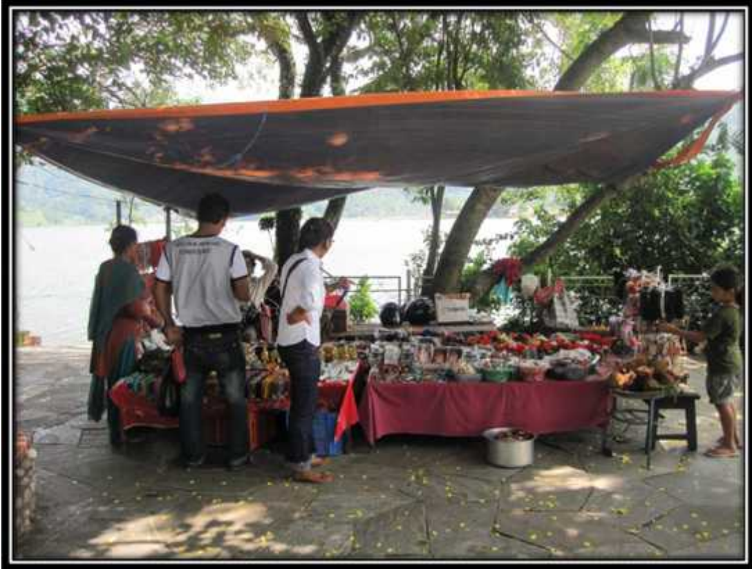
मन्दिर परिसरमा रहेको पूजा सामग्री बेच्ने पसल