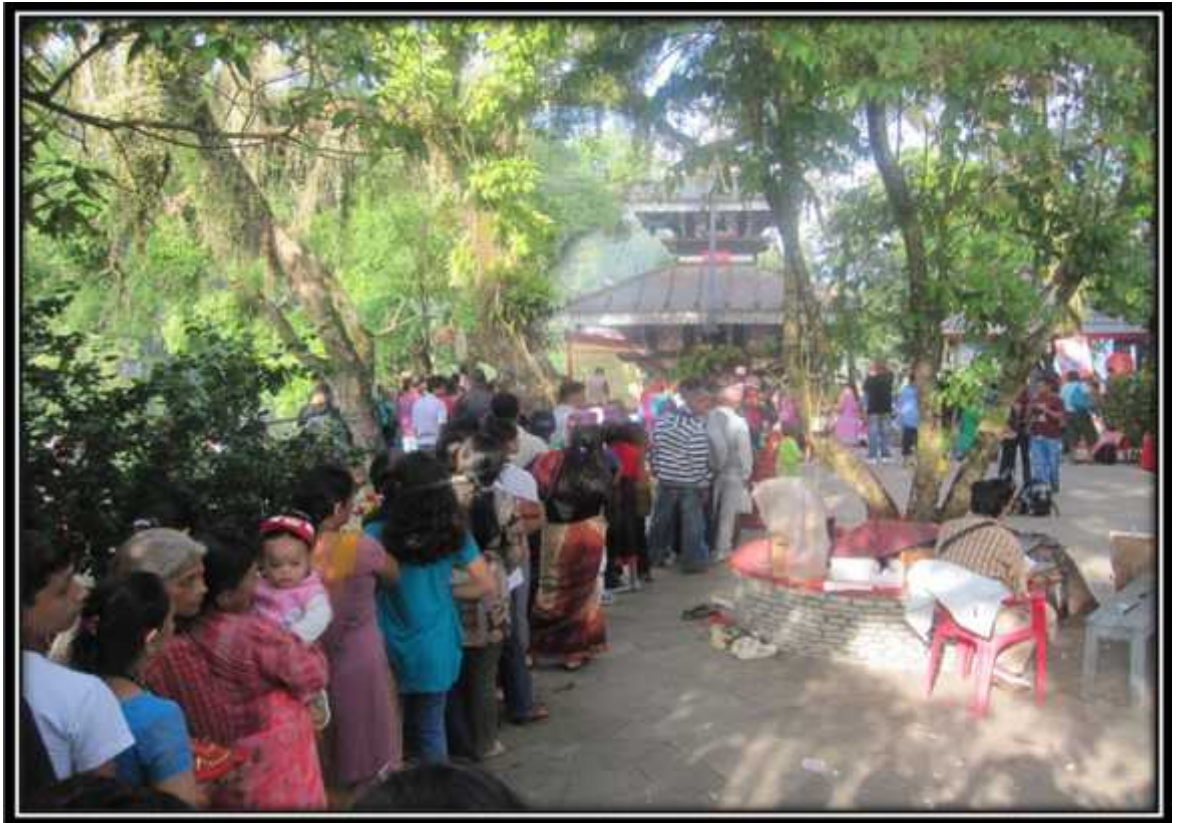
श्री तालवाराहीमन्दिरमादर्शन गर्न लामबद्ध भक्तजनहरु तस्विर नं. ३