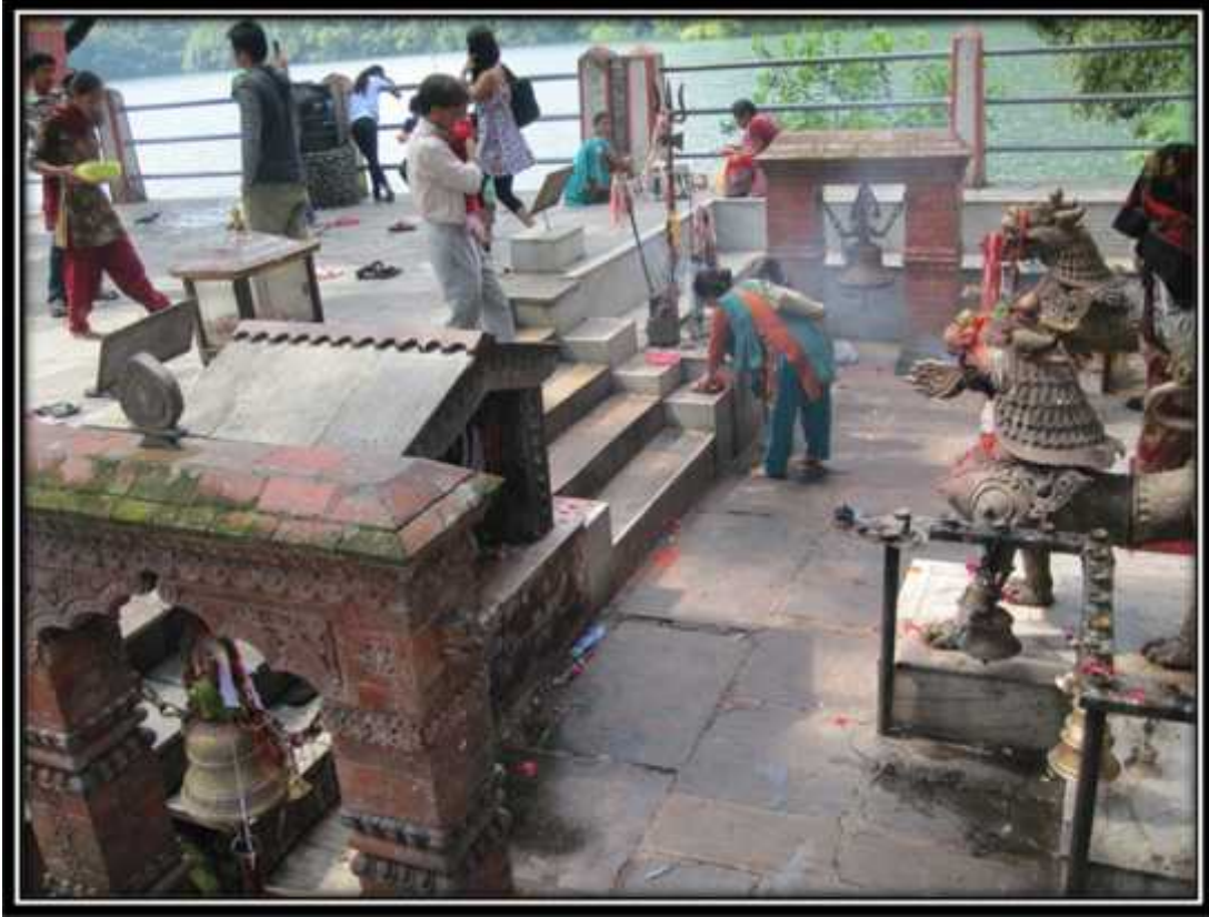
मन्दिरको दुवै छेउमा रहेका दुई ठूला ठूला घण्टाहरू तस्विर नं. ८