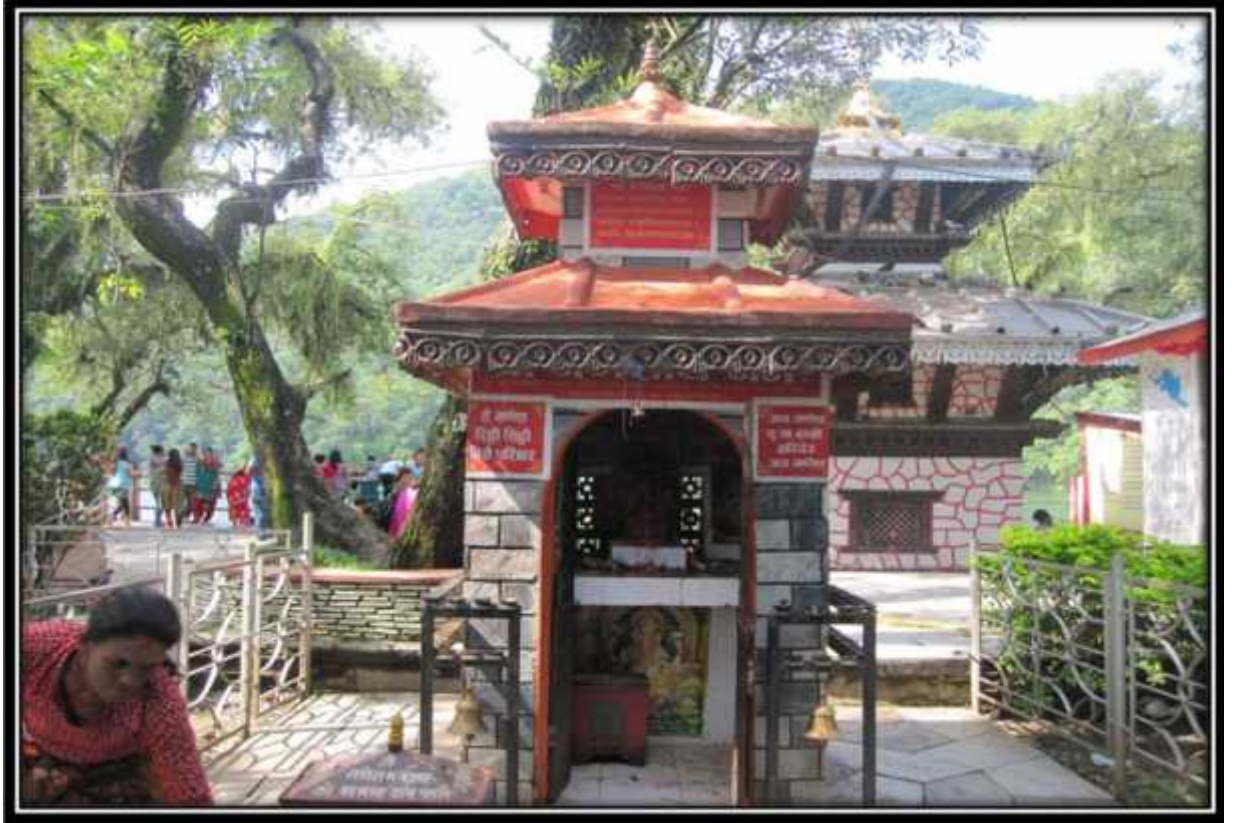
श्री तालवाराहीमन्दिर परिसरमा रहेको गणेश मन्दिर तस्विर नं. २