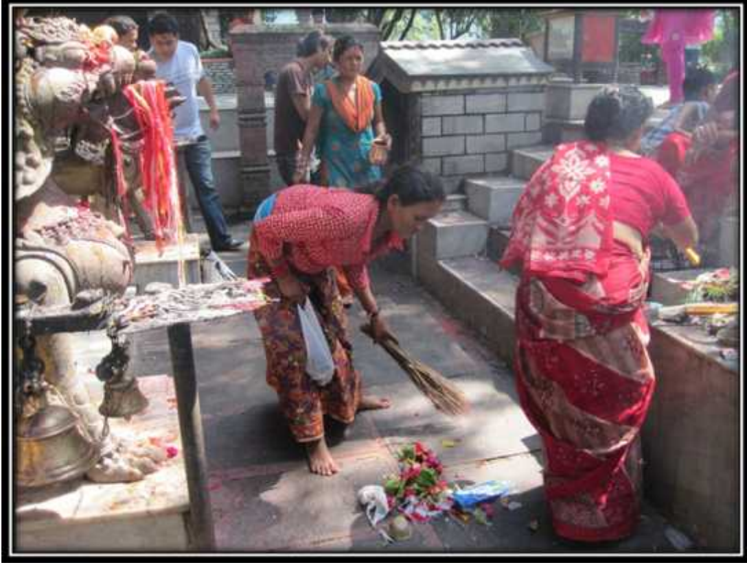
मन्दिर परिसरमा सरसफाई गर्दै सफाईकर्मी कर्मचारी तस्विर नं. १८