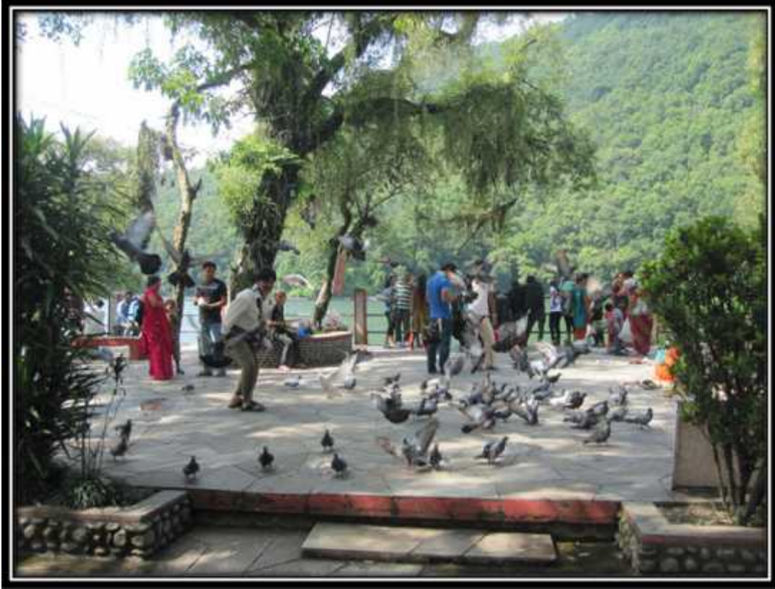
मन्दिरमा उडाईएका परेवाहरू तस्विर नं. १०