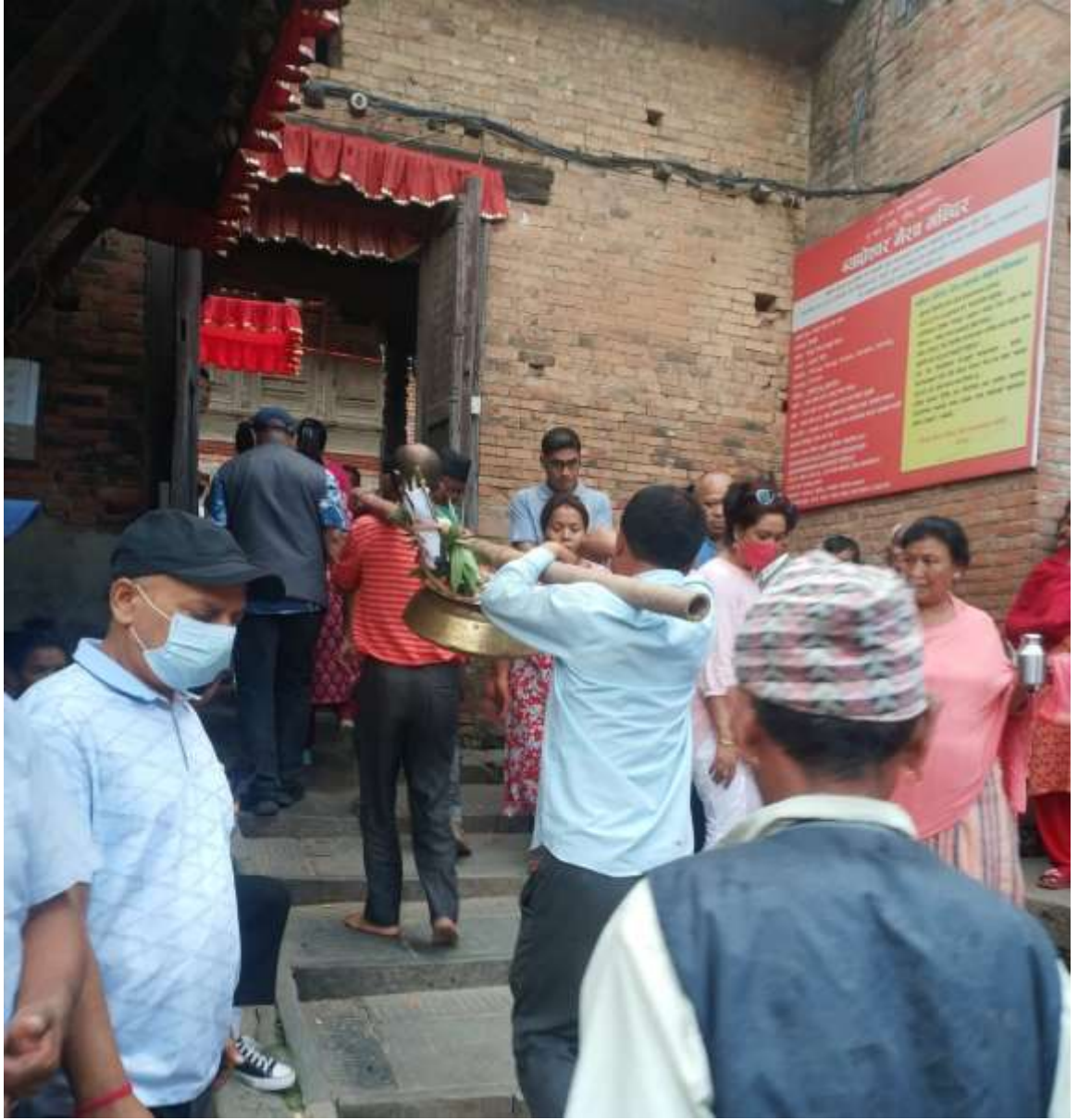
चित्र ९ : बौ : बलेगु लैजादै