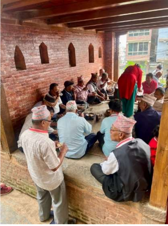
चित्र ५ : समयबजि ग्रहण गर्दै स्थानिय बासिन्दाहरु