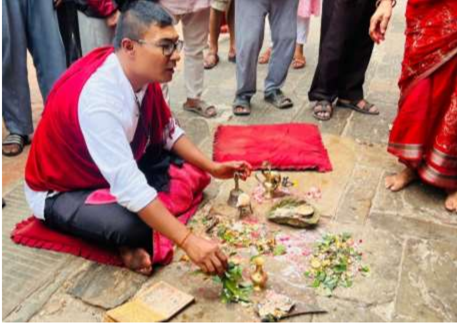
चित्र ७ : ब्रजाचार्य पुजारी र थकालिवाट बह्य होम पुजा विधि गरिदै