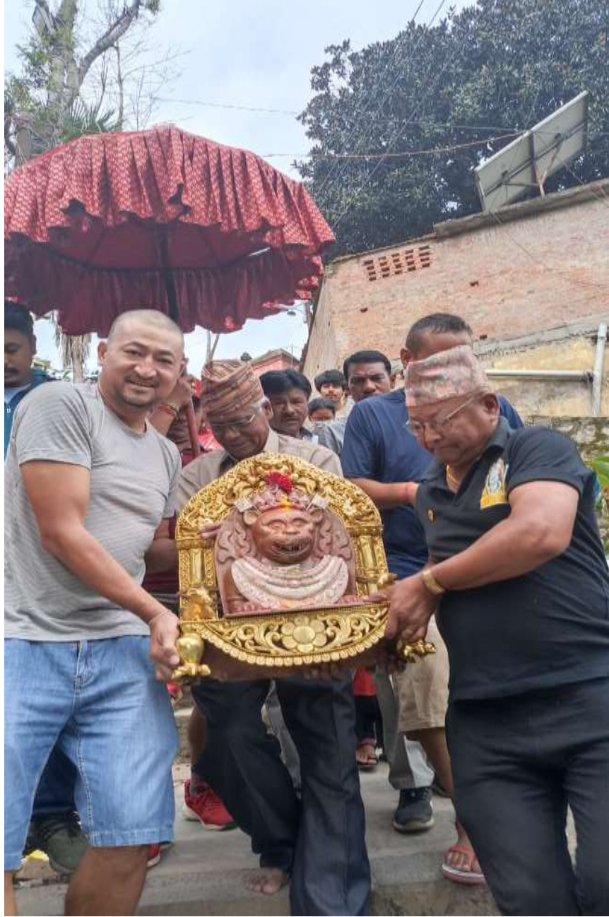
चित्र १ : मुकुटलाई आजु : बुगांमा स्नान गर्न लगिदै