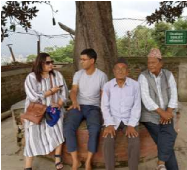
चित्र ११ : शोध अनुसन्धानको बेलामा अर्न्तवार्ता लिईएको व्यक्तिहरू मध्यको केहिसँग तस्विर