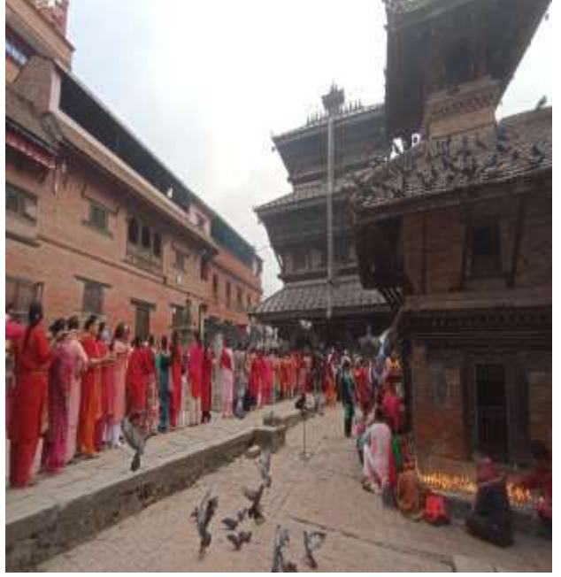
चित्र २ : जात्राको दिन बाघभैरव मन्दिरमा पूजाआजा गर्न आएका श्रदालु भक्तजनहरू