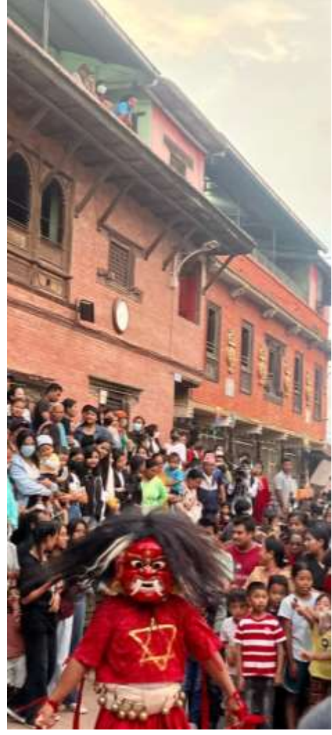
चित्र १० : लाखे नाच