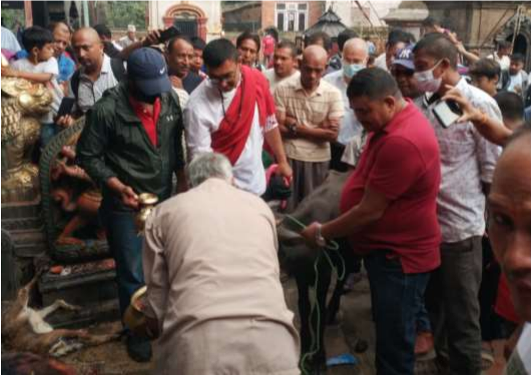
चित्र ८ : बलि दिदैं गरिएको अवस्था