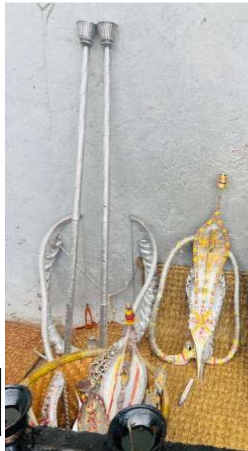
चित्र ४ : बाघभैरवमा चढाएको गरगहनाहरू