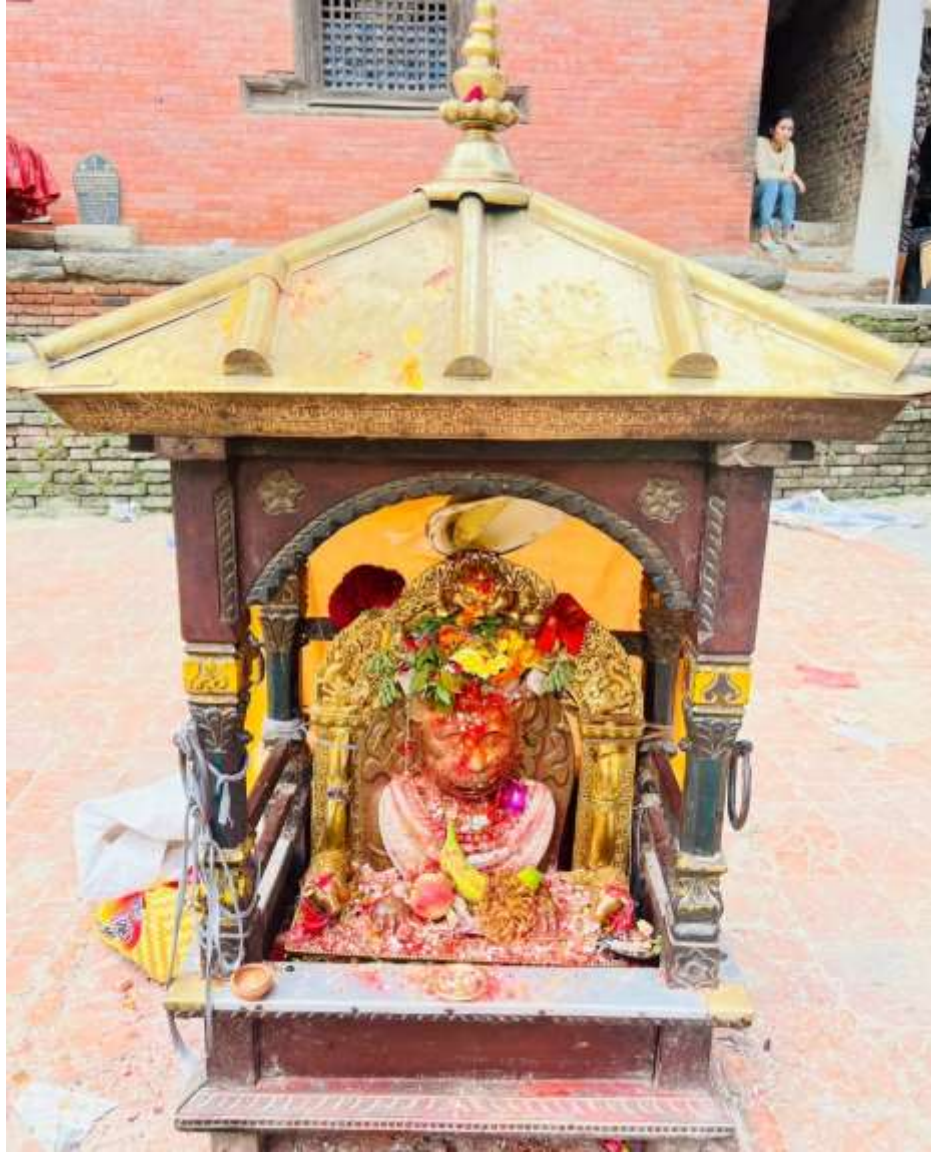
चित्र ३ : वाघभैरवको रथ