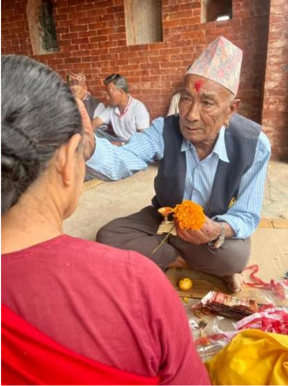
चित्र ६ : थकालिबाट टिका ग्रहणगर्दै स्थानिय